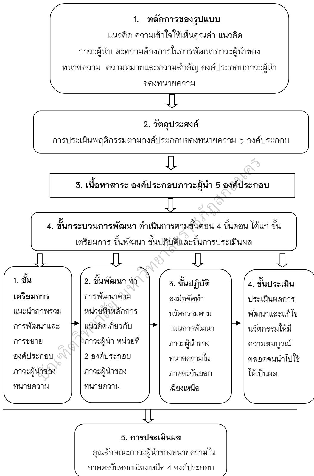
ภาพประกอบ 2 รูปแบบการพัฒนาภาวะผู้นำของทนายความ