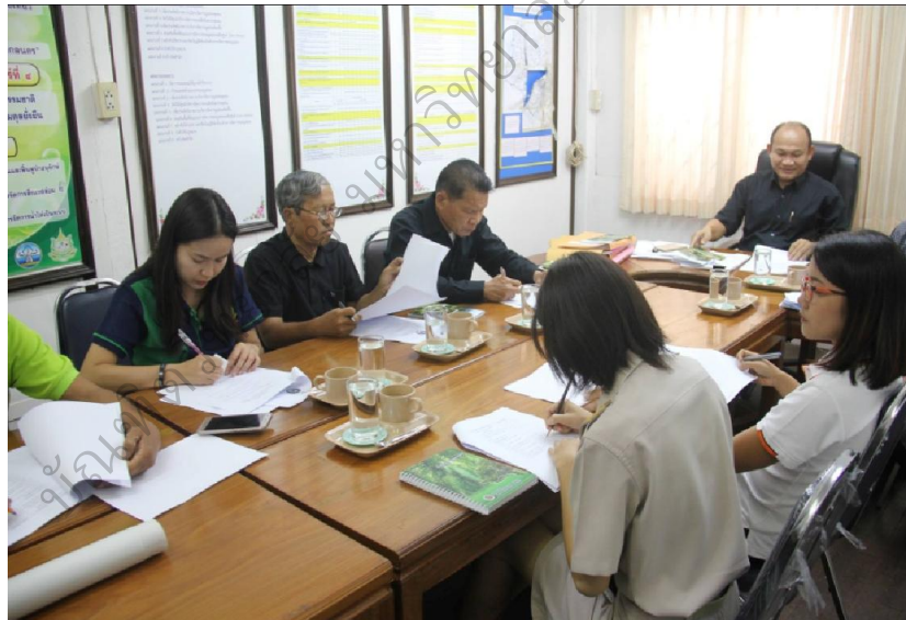
ภาพประกอบ 2 ศึกษาสภาพและปัญหาการให้บริการของสำนักงานทรัพยากรธรรมชาติและสิ่งแวดล้อม จังหวัดสกลนคร