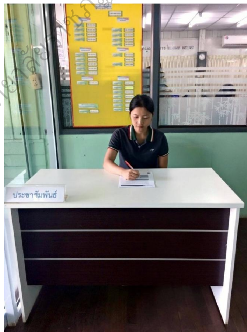
ภาพประกอบ 4 ผลการพัฒนาคุณภาพการให้บริการสำนักงานทรัพยากรธรรมชาติและสิ่งแวดล้อม จังหวัดสกลนคร