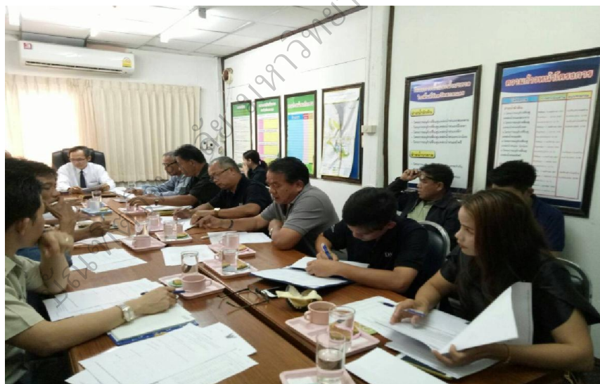
ภาพประกอบ 3 แนวทางการให้บริการของสำนักงานทรัพยากรธรรมชาติและสิ่งแวดล้อม จังหวัดสกลนคร