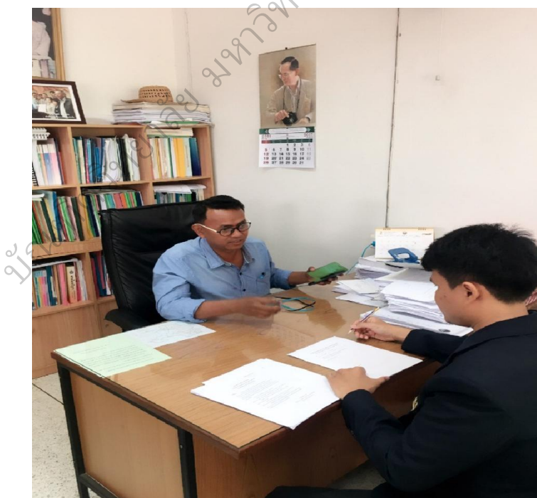
ภาพประกอบ 5 การสัมภาษณ์เชิงลึกเพื่อหาแนวทางพัฒนาประสิทธิภาพในการปฏิบัติงาน