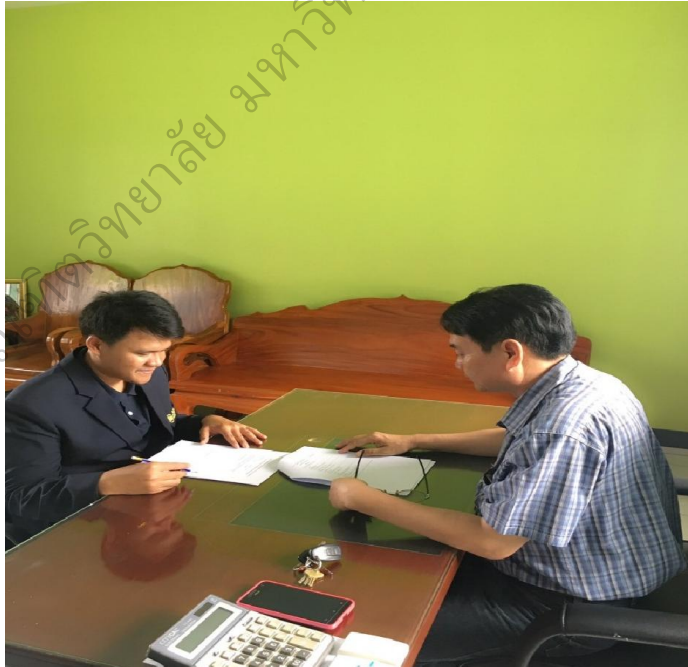
ภาพประกอบ 6 การสัมภาษณ์เชิงลึกเพื่อหาแนวทางพัฒนาประสิทธิภาพในการปฏิบัติงาน