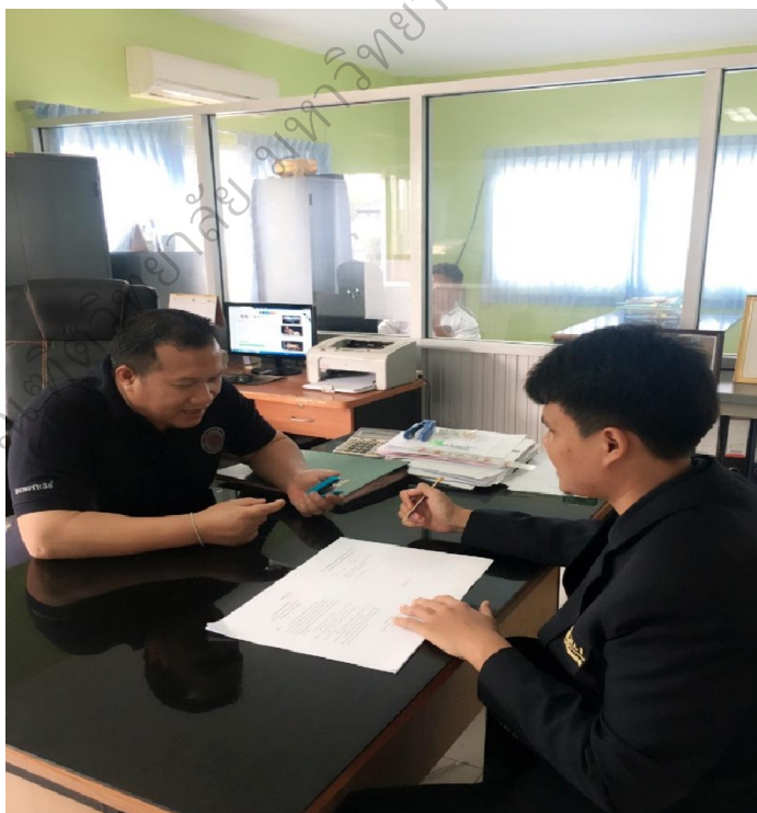
ภาพประกอบ 4 การสัมภาษณ์เชิงลึกเพื่อหาแนวทางพัฒนาประสิทธิภาพในการปฏิบัติงาน