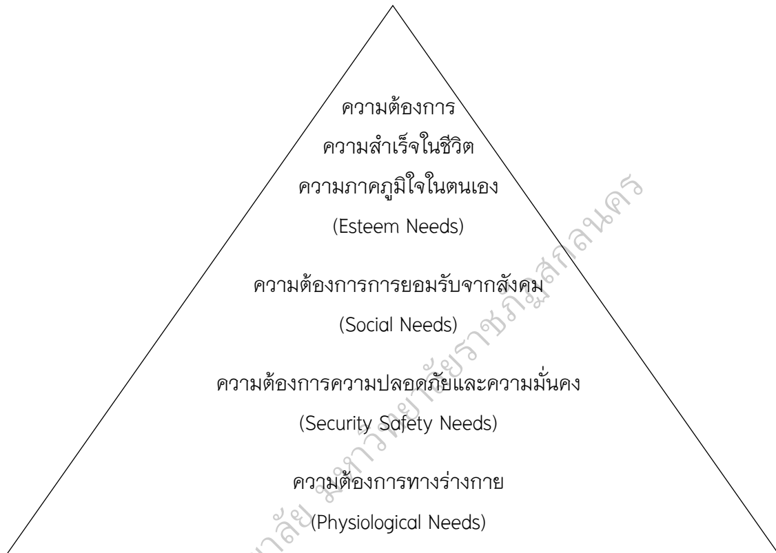
ภาพประกอบ 3 ลำดับขั้นความต้องการของมาสโลว์

ที่มีการกล่าวขวัญอย่างแพร่หลาย มาสโลว์ มองว่าความต้องการของมนุษย์มีลักษณะเป็นลำดับขั้น จากระดับต่ำไปยังสูงสุด เมื่อความต้องการในระดับหนึ่งได้รับการตอบสนองแล้ว มนุษย์ก็จะมีความต้องการอื่นในระดับที่สูงขึ้นต่อไป ดังภาพประกอบ 4