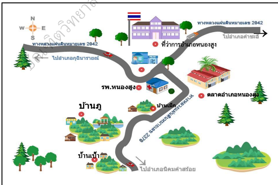
ภาพประกอบ 2 แผนที่แสดงเส้นทางคมนาคมไปยังบ้านภู

“บ้านภู” แห่งจังหวัดมุกดาหาร เป็นหมู่บ้านผู้ไท แห่งหนึ่งตั้งอยู่บริเวณเนิน “ภูเขาหินเหล็กไฟ” ห่างจากตัวจังหวัดมุกดาหารขึ้นไปทางทิศใต้ระยะประมาณ 70 กว่า กิโลเมตร ผู้วิจัยเดินทางจากตัวเมืองมุกดาหารโดยใช้เส้นทางหลวงแผ่นดินหมายเลข 212 เลี้ยวขวาเข้าทางหลวงหมายเลข 2042 (สี่แยกนิคม) ตรงไปอำเภอหนองสูง ระยะทาง 60 กว่ากิโลเมตร ถึงอำเภอหนองสูง จากตัวอำเภอขึ้นไปตามถนนลาดยางประมาณ 300 กว่าเมตรพบกับทางแยกมี “ป้อมจุดตรวจการ” ตำรวจ 3-4 คนประจำอยู่บริเวณทางแยกไปบ้านภู เลี้ยวไปทางซ้ายผ่านตลาดสด ประมาณ 1 กิโลเมตร เลี้ยวขวาตามถนนหมายเลข 2370 ผ่านบ้านป่าเม็ก ชาวบ้านละแวกนั้นเรียก “ภูจ้อก้อ” เมื่อลงจากภูจ้อก้อไปเป็นที่ตั้งหมู่บ้านภู อยู่ห่างจากตัวอำเภอประมาณ 6 กิโลเมตร รายละเอียดดังภาพประกอบ 2 , 3 และ 4