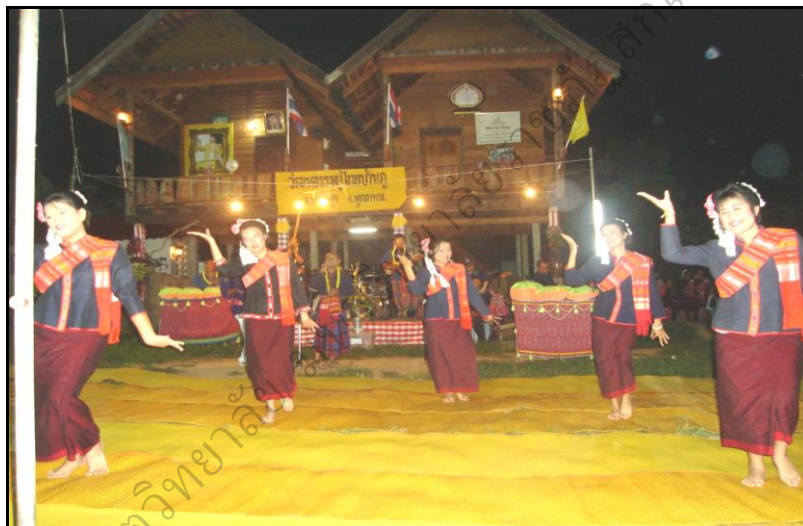
ภาพประกอบ 12 แสดงการฟ้อนรำผู้ไท

“การฟ้อนผู้ไท” ซึ่งเป็นการแสดงเพื่อต้อนรับแขกที่เข้ามาในชุมชน ตั้งแต่อดีตก็จะเป็นการทำบุญหรืองานเทศกาลต่าง ๆ ในการปฏิบัติตามฮีตครองของหมู่บ้าน เช่น ฟ้อนเพื่อต้อนรับผ้าป่า หรือนักท่องเที่ยวที่เดินทางเข้ามาในหมู่บ้าน ทุก ๆ ปี ตั้งแต่สมัยก่อนจนถึงปัจจุบันมีผ้าป่ามาที่บ้านภูทุกปี ซึ่งหนุ่มสาวจะต้องมีหน้าที่ในกิจกรรม ก็จะเป็นการฟ้อน ซึ่งการแสดงที่แสดงรับผ้าป่าและนักท่องเที่ยวคือ ฟ้อนผู้ไท ฟ้อนไม้ (ลาวกระทบไม้) และเซิ้ง ในการฝึกซ้อมนั้นมีทั้งชาวบ้านซ้อมกันเอง ขณะเดียวกันกิจกรรมการฟ้อนจะดำเนินการควบคู่ไปกับการร้องเพลงพื้นบ้านและวงดนตรีหนุ่มสาวชาวสาวผาแดงด้วย