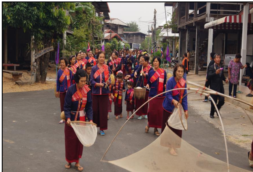
ภาพประกอบ 9 แสดงวิถีชีวิตชนเผ่าผู้ไท

ผู้วิจัยรู้ว่าบ้านภูเป็นหมู่บ้าน “ผู้ไท” ตั้งแต่ยังไม่ได้เดินทางมาถึง จากการได้ยินได้ฟังจากและดูสารคดีการพัฒนาหมู่บ้านเศรษฐกิจพอเพียงภาคตะวันออกเฉียงเหนือ และเมื่อผู้วิจัยเดินทางมายังหมู่บ้านแล้วได้พบกับชาวบ้านพวกเขาบอกว่า ภาษาที่ชาวบ้านใช้พูดคุยกัน คือ ภาษาผู้ไท นอกจากนั้นชาวบ้านยังประกาศตนเองว่าเป็นหมู่บ้าน วัฒนธรรมผู้ไทด้วย รวมไปถึงคำขวัญอำเภอหนองสูงที่ว่า “หนองสูงถิ่นผู้ไท เมืองพระไกรสรราช ตาดโตนน้ำตกสวย ห้วยบังอี่น้ำใส ผ้าไหมเลิศหรู ภูจ้อก้อแหล่งธรรม ลีกล้วยี่เหยา ทิวเขางามตา”