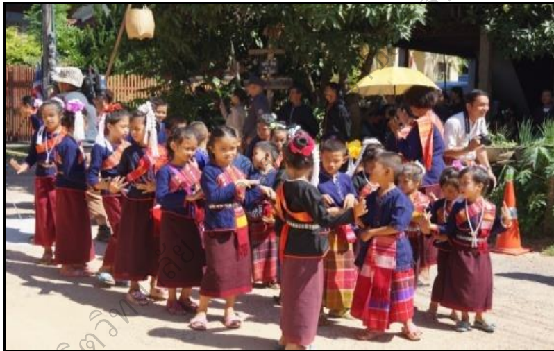
ภาพประกอบ 7 แสดงการแต่งกายของเด็กเยาวชนในชุมชนเผ่าผู้ไท