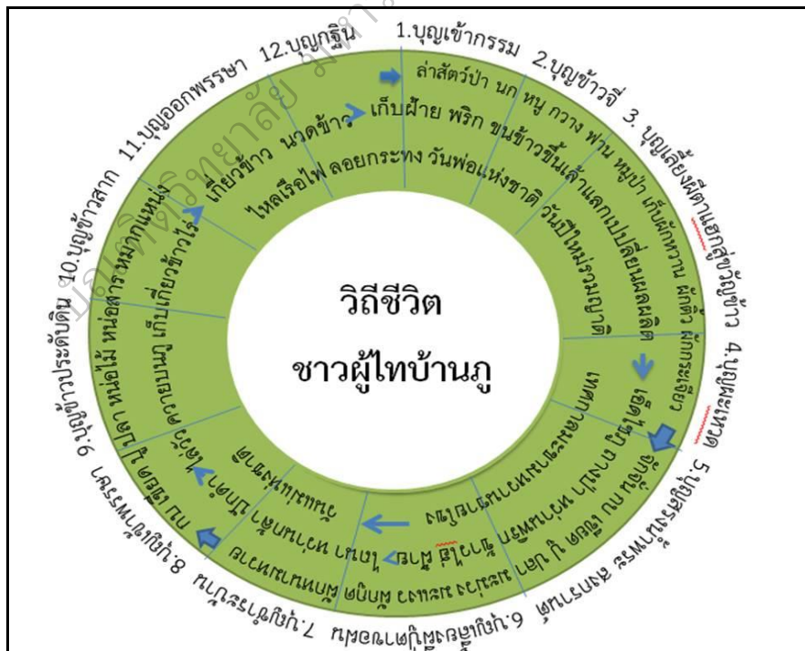
ภาพประกอบ 10 แสดงวิถีชีวิตทางชาติพันธุ์ผู้ไทบ้านภู