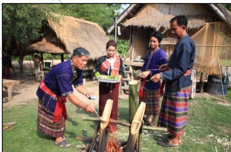
ภาพประกอบ 8 แสดงการประกอบอาหารแกงกะบั้ง