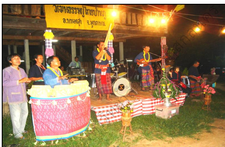
ภาพประกอบ 11 การแสดงวงดนตรีหนุ่มผาขาวสาวผาแดง

11.1 วงดนตรี ในปัจจุบันการแสดงออกถึงสำนึกทางชาติพันธุ์บนเวทีลานวัฒนธรรม เพื่อบรรเลงประกอบ การกินเลี้ยงขันโตกพาแลง การพ้อนรำ ชาวบ้านจึงริ่หรือสร้างวงดนตรีขึ้น ตั้งชื่อว่า “หนุ่มผาขาวสาวผาแดง” ซึ่งบ้านภูล้อมรอบด้วยภูเขาทั้งสี่ด้าน แต่ภูเขาขาวและภูเขาแดงมีความสำคัญต่อการดำรงชีพของชาวภูเป็นอย่างมาก เป็นแหล่งหาอยู่หากิน ด้วยความภาคภูมิใจในพื้นที่ซึ่งมีสภาพแวดล้อมที่สวยงาม จึงทำให้คนในท้องถิ่นมีอารมณ์ที่สุนทรีย์ อยู่ร่วมกันด้วยความผาสุกสนุกสนานเพลิดเพลิน