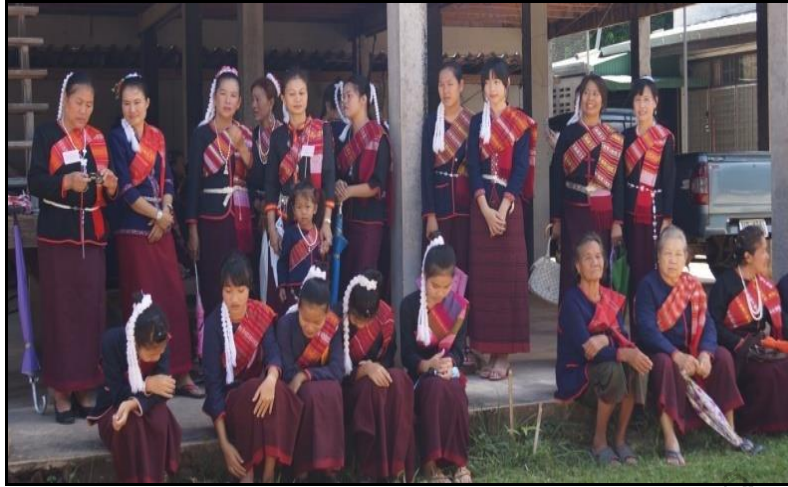
ภาพประกอบ 6 แสดงการแต่งกายของผู้หญิงบ้านภู