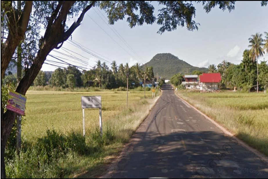
ภาพประกอบ 3 สภาพทั่วไปของหมู่บ้านภู ตำบลบ้านเป้า อำเภอหนองสูง