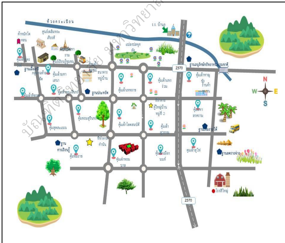
ภาพประกอบ 4 แสดงแผนที่เดินทางบ้านภู ตำบลบ้านเป้า อำเภอหนองสูง จังหวัดมุกดาหาร