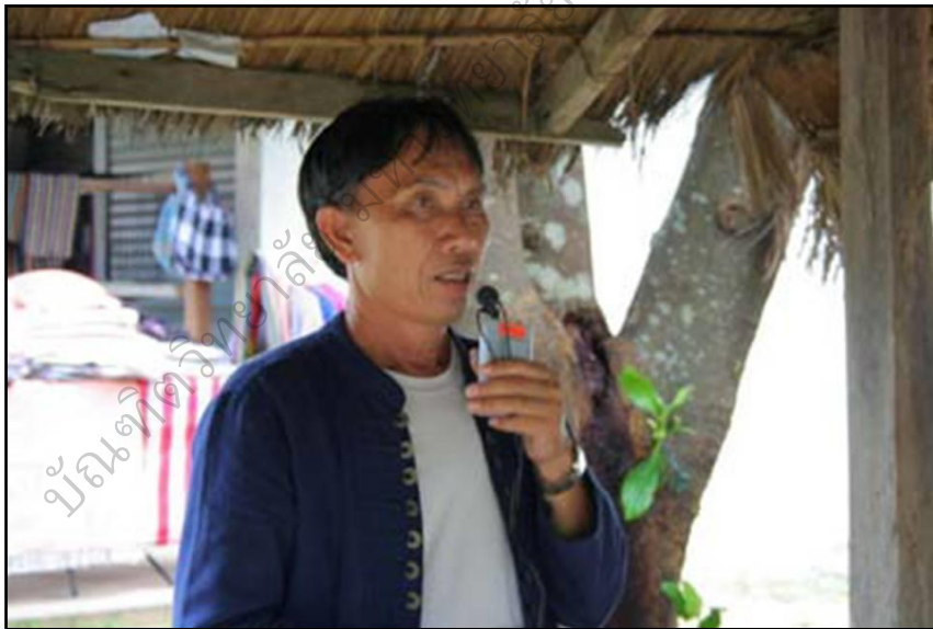
ภาพประกอบ 35 แสดงการบรรยายฐานเอื้ออารี

‘เอื้ออารี’ เป็นการอยู่ร่วมกันแบบพี่แบบน้องเกื้อกูลพึ่งพาอาศัยกันและกันมีอะไรแบ่งปันกันช่วงฤดูทำนาช่วยแรงกันช่วยเหลือกันถ้าใครมีเงินอาจเอาเงินไปจ้างคนข้างนอกแต่หากเป็นการลงแรงช่วยเหลือกันทำให้เกิดความรักความสามัคคีกันมากขึ้น