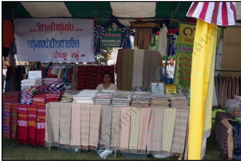
ภาพประกอบ 24 จุดแสดงและจำหน่ายสินค้าของชาวบ้านภายในวัดศรีนันทาราม

กลุ่มผู้ผลิตผู้ประกอบการสินค้าชุมชนและสินค้าตามโครงการ หนึ่งตำบล หนึ่งผลิตภัณฑ์ (นตผ.) เรียกกันว่า ‘OTOP’ นำมาจัดแสดงและจำหน่าย