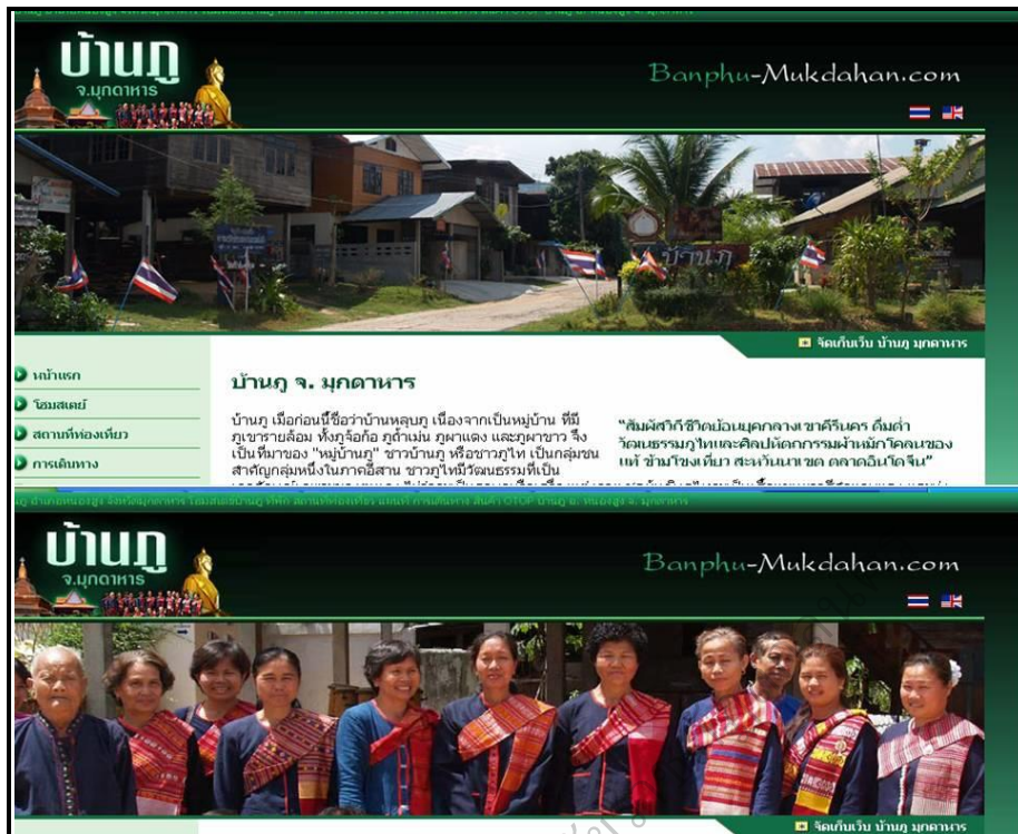
ภาพประกอบ 19 การประชาสัมพันธ์การท่องเที่ยวของบ้านภู่ จังหวัดมุกดาหาร

จากข้อค้นพบเกี่ยวกับแนวทางการจัดการหมู่บ้านวัฒนธรรมเพื่อการท่องเที่ยว (โฮมสเตย์) บ้านภู่ ตำบลบ้านเป้า อำเภอหนองสูง จังหวัดมุกดาหาร ในครั้งนี้พบว่า หมู่บ้านมีการจัดการด้านที่พักอาศัยด้านอาหารด้านวัฒนธรรมด้านแหล่งท่องเที่ยว ด้านผลิตภัณฑ์และด้านการประชาสัมพันธ์ของหมู่บ้านต้องจัดให้อยู่ในเกณฑ์มาตรฐานโฮมสเตย์