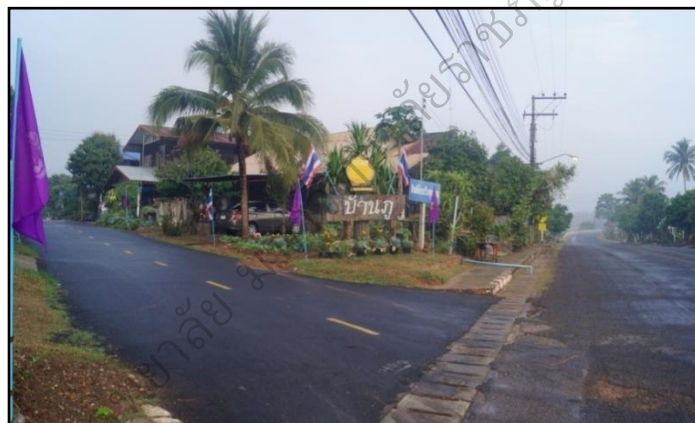
ภาพประกอบ 25 แสดงพื้นที่สภาพทั่วไปของหมู่บ้านภู