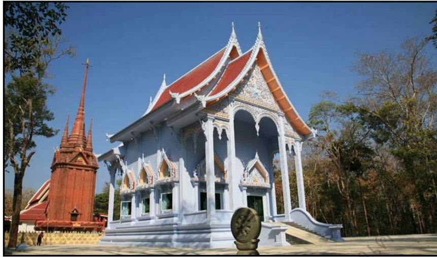
ภาพประกอบ 17 วัดป่าวิเวกวัดนาราม