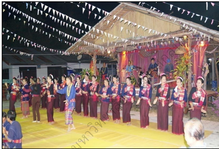
ภาพประกอบ 15 กลุ่มแม่บ้านใช้เวลาหลังจากรับแขกเสร็จแล้วเพื่อซ้อมรำแพว

ให้เด็กรำด้วย การเรียนรู้ท่ารำจากวีซีดีบางครั้งชาวบ้านผู้แสดงออกท่าทางพ้องเอง โดยไม่มีรูปแบบที่ตายตัว กำหนดไว้ เช่น พ็อนลงช่วง ที่ผู้แสดงเป็นผู้เฒ่าชายหญิง ผู้เฒ่าชายหญิง จะทำการอื้อฝ้าย และเซ็นฝ้าย ไปและมีอ้อมรำไปด้วย ส่วนผู้ชายก็เข้ามาและพ้องเกี่ยวกัน โดยท่าพ็อนลงช่วงนี้ เป็นท่าพ็อนแบบงายๆ และไม่มีรูปแบบที่ตายตัวแน่นอน ท่าพ็อนขึ้น อยู่กับอารมณ์และความสนุกสนานของผู้แสดง