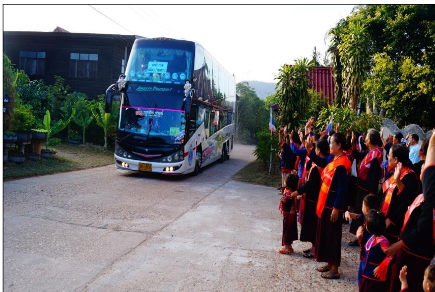
ภาพประกอบ 21 แสดงจุดรับและส่งนักท่องเที่ยว

3.7.2 วัดศรีนันทารามพื้นที่บริเวณวัดศรีนันทาราม ชาวบ้านภูได้ร่วมกันจัดกิจกรรมและสร้างกิจกรรม โดยถือว่าการสร้างอัตลักษณ์ทางชาติพันธุ์ผู้ไทบ้านภูขึ้นใหม่ ให้ความหมายใหม่เพื่อนำเสนอแก่นักท่องเที่ยวประกอบด้วยพื้นที่ความรู้ ศูนย์การเรียนรู้ชุมชนบ้านภูศูนย์พิพิธภัณฑ์เฉลิมพระเกียรติพระบาทสมเด็จพระเจ้าอยู่หัวภูมิพลอดุลยเดชพื้นที่พิพิธภัณฑ์เฉลิมพระเกียรติสมเด็จพระรัตนราชสุตาฯ สยามบรมราชกุมารีพื้นที่ลานวัฒนธรรมผู้ไทบ้านภูพื้นที่จำหน่ายสินค้าพื้นเมืองและของที่ระลึกตามรายละเอียดดังนี้