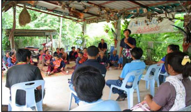
ภาพประกอบ 33 แสดงการบรรยายฐานการเรียนรู้วิถีกลุ่มชาติพันธุ์ผู้ไทของบ้านภู

ฐานเรียนรู้นี้แสดงถึงปราชญ์ชาวบ้านครูภูมิปัญญาด้านต่าง ๆ ในหมู่บ้าน อาทิเช่นเครื่องมือจับปลาเครื่องดักสัตว์การแสดงเครื่องประดับโบราณสมุดข่อยใบลาน หรือกิจกรรมการผลิตแปรรูปสมุนไพรหอมสมุนไพรยาตำรับหอมเป่าหอมน้ำมันหอมระดูกหอมยาฝนและการถ่ายทอดภูมิปัญญาจากผู้อาวุโสในหมู่บ้านเช่นการเล่านิทาน การดูดวง