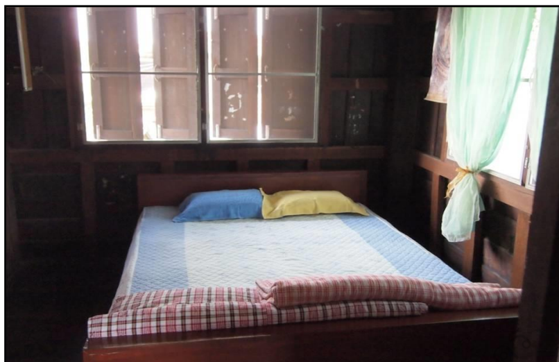
ภาพประกอบ 29 แสดงห้องนอนบ้านพักโฮมสเตย์