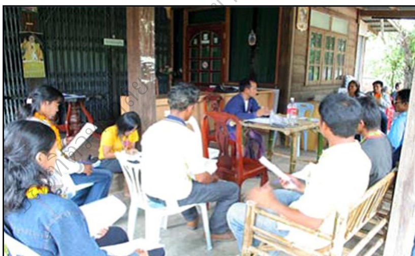
ภาพประกอบ 32 แสดงการบรรยายและตอบข้อสงสัยของผู้มาศึกษาดูงาน

ร่วมกันสมาชิกต้องจ่ายค่าธรรมเนียมการบริหารจัดการและสมาชิกต้องเป็นคนบ้านภู หมู่ที่ 1 และหมู่ที่ 2 เท่านั้นเพราะจะไม่ยุ่งยากในการติดตามทวงหนี้สมาชิกต้องมีความ ซื่อสัตย์สุจริตไม่คดโกงคณะกรรมการอยู่ในวาระครั้ง 2 ปีสำหรับการถือหุ้นให้ถือหุ้น 10 หุ้นขึ้นไป หุ้นละ 10 บาท แรกเข้าเปิดบัญชี 20 บาทไม่จำกัดวัยทุกคนสามารถเป็นสมาชิก ได้เมื่อเป็นสมาชิกจะได้สมุดผู้ฝากคล้ายกับสมุดบัญชีธนาคารมีทั้งเงินฝากและเงินกู้ การกู้ยืมต้องเขียนคำร้องก่อนที่จะกู้ยืมและต้องทำสัญญาเงินกู้สำหรับสมุดผู้ฝากเงิน ต้องมีธุรกิจเร่งด่วนเท่านั้นหนึ่งคนกู้ได้ไม่เกิน 40,000 บาทแล้วแต่กรณีบางครั้งที่กู้เพื่อเป็น ค่าเทอมลูกหรือกู้เพื่อการเกษตรก็ได้และต้องมีผู้ค้ำประกัน 2 คน คิดดอกเบี้ย ร้อยละ 6.7 สตางค์ต่อเดือนทุกวันเสาร์ที่ 2 ของเดือน เป็นวันทำงานของธนาคารหมู่บ้านสำหรับ ผู้ที่ต้องการฝากและชำระหนี้สามารถทำได้ในวันดังกล่าวและธนาคารจะประชุมสามัญ ปีละครั้ง จากการสังเกตพบว่าจากคำถามของลูกแพงหากมีเงินใช้หนี้ไม่พอทำอย่างไร วิทยากรให้ข้อมูลว่า หากไม่มีเงินจริง ๆ ให้จ่ายเงินต้นพร้อมดอกเบี้ยก่อนได้หรือหากไม่มี จริง ๆ ให้จ่ายเฉพาะดอกเบี้ยแต่อย่างน้อยต้องใช้คืนสามารถทยอยใช้คืนได้