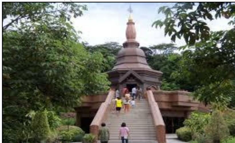
ภาพประกอบ 18 วัดบรรพตคีรี (วัดภูจ้อก้อ)

วัดบรรพตคีรี เป็นวัดธรรมยุติกายที่สำคัญตั้งอยู่บนภูจ้อก้อเป็นภูเขาขนาดย่อมที่สงบสวยงาม มีลักษณะป่าเบญจพรรณทั้งแนวก่อนหินน้อยใหญ่วัดแห่งนี้เคยเป็นที่จำพรรษาของหลวงปู่หล้า เขมปัตตโต พระวัดป่ากรรมฐานในสายหลวงปู่มั่น ที่เคร่งครัดปฏิบัติภาวนาและอบรมธรรมเทศนาแก่สาธุชนทั้งหลาย