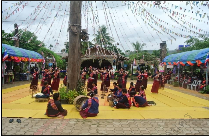
ภาพประกอบ 23 การแสดงพื้นถิ่นที่ลานวัฒนธรรมกับการบริหารการพัฒนาอัตลักษณ์

หลังจากแลกเปลี่ยนเรียนรู้กันเสร็จแล้ว พิธีกรและฝ่ายจัดการนำนักท่องเที่ยวเข้าพักบ้านโฮมสเตย์มาชี้แจงและเข้าของบ้านพักโฮมสเตย์มารับนักท่องเที่ยวเข้าบ้านพักตามลำดับคิวที่ได้ตกลงกันไว้ นอกจากนี้ยังมีชาวบ้าน กลุ่มองค์กร กลุ่มอาชีพ และกลุ่มผลิตภัณฑ์ชุมชนได้นำสินค้ามาร่วมจัดแสดงและจำหน่ายรอบ ๆ ลานวัฒนธรรม เมื่อผู้นำกลุ่มหรือกำนันประชาสัมพันธ์ผ่านทางหอกระจายข่าวว่า มีนักท่องเที่ยวเข้ามาในหมู่บ้าน ชาวบ้านเตรียมใส่ชุดกลุ่มชาติพันธุ์ผู้ไทและนำสินค้ามาจัดแสดงและจำหน่าย หลังจากนั้นนักท่องเที่ยวได้ทราบว่าตนเองพักอยู่บ้านโฮมสเตย์แล้วนั้น พิธีกรให้โอกาสให้นักท่องเที่ยวและชาวบ้านได้พูดคุยกัน และเดินชมสินค้าผลิตภัณฑ์ของชุมชน ขณะเดียวกันผู้นำได้พานักท่องเที่ยวชมพิพิธภัณฑ์เฉลิมพระเกียรติพระบาทสมเด็จพระเจ้าอยู่หัวและสมเด็จพระเทพราชสุตา สยามบรมราชกุมารี จนถึงเวลาเที่ยงวันพอดี จากนั้นรับประทานอาหารกลางวัน ฝ่ายแม่ครัวได้จัดเตรียมอาหารเที่ยงไว้สำหรับนักท่องเที่ยวรับประทาน ส่วนใหญ่เป็นอาหารพื้นบ้านชาวผู้ไทบ้านภูและอาหารพื้นบ้านอีสานโดยทั่วไป นักท่องเที่ยวร่วมกันรับประทานอาหารกลางวัน หลังจากเดินชม ชิม ชื้อสินค้าและผลิตภัณฑ์ชุมชน และวิถีชีวิตชาวบ้านภูในบริเวณโดยรอบลานวัฒนธรรมผู้ไทบ้านภูพื้นที่บริเวณวัดศรีนันทารามแล้ว