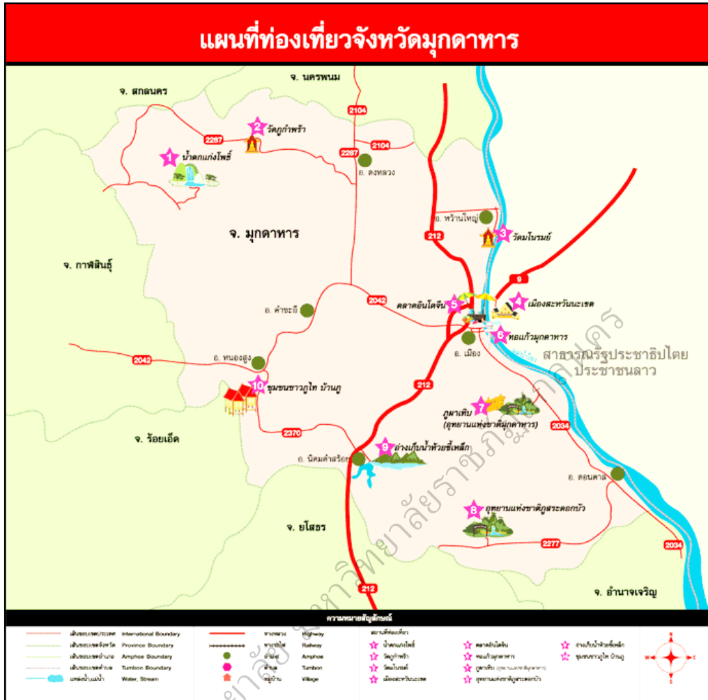
ภาพประกอบ 13 แสดงเส้นทางท่องเที่ยวจังหวัดมุกดาหาร-หมู่บ้านภู

ชุมชนชาวผู้ไทบ้านภู ตำบลบ้านเป้า อำเภอหนองสูง จังหวัดมุกดาหาร ได้ถูกคัดเลือกให้เป็นแหล่งท่องเที่ยวที่สำคัญของจังหวัด 1 ใน 10 ของสถานที่ที่นักท่องเที่ยวนิยมเดินทางไปพักผ่อนและศึกษาดูงานวิถีชีวิตกลุ่มชาติพันธุ์ รวมทั้งสัมผัสบรรยากาศอันเป็นธรรมชาติงดงาม นอกจากนี้ยังคงกลิ่นไอความเป็นชนบทหมู่บ้านในอดีตของประเทศไทย ยังคงดำรงอยู่ในท่ามกลางกระแสโลกาภิวัตน์นักท่องเที่ยวได้เดินทางมาแต่ละปี ตามรายละเอียดดังนี้