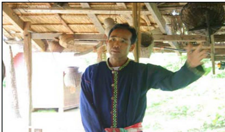
ภาพประกอบ 34 แสดงการบรรยายฐานอนุรักษ์ทรัพยากรธรรมชาติและสิ่งแวดล้อม