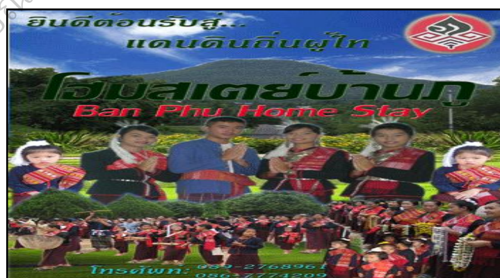
ภาพประกอบ 26 แสดงการประชาสัมพันธ์โฮมสเตย์บ้านภู