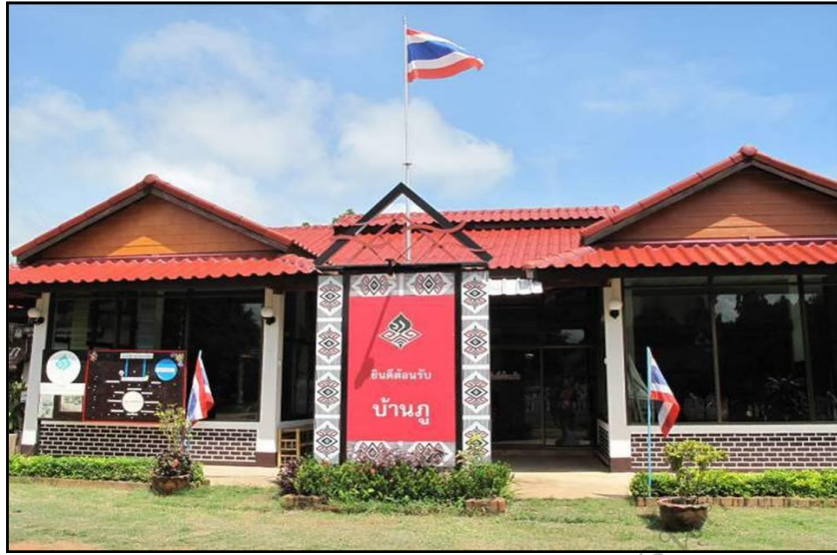
ภาพประกอบ 22 แสดงพื้นที่ศูนย์เรียนรู้ชุมชนบ้านญิว

ศูนย์เรียนรู้ชุมชนบ้านญิว มีการเรียนรู้ที่เกิดขึ้นจากวิถีชีวิตของชุมชนที่มีมาช้านานและได้ดำเนินการกันอย่างเป็นระบบเมื่อสำนักงานพัฒนาชุมชนอำเภอหนองสูงได้เข้ามาให้ความรู้โดยการจัดเวทีประชาคมหมู่บ้านหมู่ที่ 1 และหมู่ที่ 2 สนับสนุนให้กลุ่มองค์กรและประชาชนในหมู่บ้านดำเนินชีวิตตามแนวปรัชญาของเศรษฐกิจพอเพียงด้วยการที่ชุมชนบ้านญิวมีกลุ่มองค์กรและกิจกรรมมากมายที่เกิดขึ้นภายในหมู่บ้านและดำเนินการประสบผลสำเร็จอย่างดีเวทีประชาคมหมู่บ้านได้มีการวางแผนประยุกต์กิจกรรมที่มีอยู่ในหมู่บ้านเพื่อให้ชาวบ้านทุกคนได้เรียนรู้เรื่องเศรษฐกิจพอเพียงและสามารถดำรงชีวิตตามปรัชญาของเศรษฐกิจพอเพียงความรู้ที่คนในชุมชนถ่ายทอดจากรุ่นต่อรุ่นเรื่อยมาจนถึงปัจจุบัน เช่น การดำรงชีวิตของวิถีชุมชนขนบธรรมเนียมวัฒนธรรมประเพณีเป็นแหล่งรวบรวมองค์ความรู้เพื่อถ่ายทอดความรู้ให้กับคนในชุมชนอย่างเป็นระบบกลุ่มกิจกรรมต่าง ๆ เกิดการเรียนรู้ร่วมกันศูนย์เรียนรู้ชุมชนบ้านญิวจึงก่อเกิดและพัฒนาขึ้นตามลำดับ