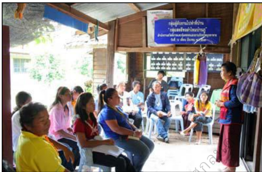
ภาพประกอบ 31 แสดงการบรรยายฐานการเรียนรู้เพิ่มรายได้

สินค้าขายดีในช่วงเทศกาลการทำงานของกลุ่มแบ่งงานเป็นฝ่ายชัดเจน ฝ่ายการตลาดดูแลการตลาดอย่างเดี่ยวฝ่ายผลิตผลผลิตอย่างเดี่ยวฝ่ายตลาดต้องไปดูสินค้าของภาคอื่น ๆ เพื่อมาปรับปรุงสินค้าบ้านเราสมาชิกกลุ่มต่างๆทุกสิ้นปีต้องสรุปว่าแต่ละกลุ่มมีรายได้เท่าไรการประสานงานต้องดีถ้าลูกค้าต้องการซื้อของต้องพร้อมที่ให้บริการทุกเมื่อตลอด 24 ชั่วโมงการประสานงานถ้าคนทำหน้าที่ไม่อยู่ต้องมีคนทำแทนทันทีอย่าให้ลูกค้าผิดหวังสำหรับเงินทุนของกลุ่มได้จากการระดมหุ้นของสมาชิกกลุ่มถ้าไม่พอไปยืมธนาคารหมู่บ้านโดยทั่วไปคนบ้านภูเข้าร่วมเป็นสมาชิกไม่กลุ่มใดก็กลุ่มหนึ่ง