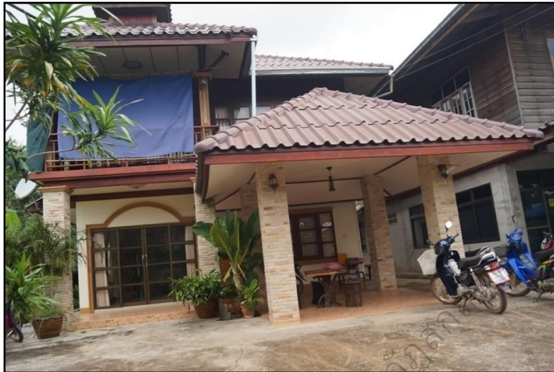
ภาพประกอบ 27 แสดงครัวเรือนบ้านพักโฮมสเตย์