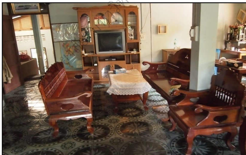
ภาพประกอบ 28 แสดงห้องรับแขกบ้านพักโฮมสเตย์