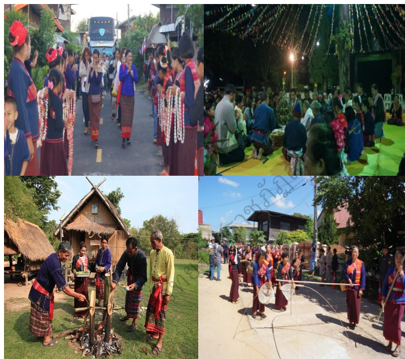
ภาพประกอบ 36 แสดงวิถีชุมชน

(ธวัชชัย อรัญญิก, เดลินิวส์ ฉบับที่ 23, 770 วันที่ 11 พฤศจิกายน พ.ศ. 2557)