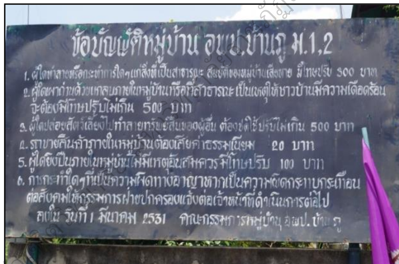
ภาพประกอบ 41 แสดงข้อบัญญัติหมู่บ้านภู

6) บ้านภูมิซ้อควรปฏิบัติร่วมกัน : กฎข้อบัญญัติหมู่บ้าน อพป.บ้านภู แต่หากเป็นความผิดทางอาญา กระทบกระเทือนภายในหมู่บ้าน ชาวบ้าน หรือ ผู้พบเห็น เหตุการณ์ ให้แจ้งกรรมการฝ่ายปกครอง ผู้นำชุมชน แจ้งเจ้าหน้าที่ตำรวจ ดำเนินการตามกฎหมายต่อไป