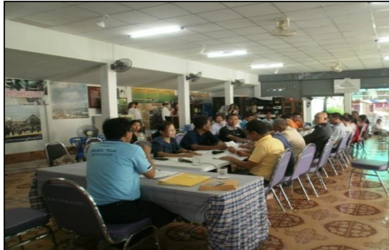
ภาพประกอบ 37 แสดงการประชุมเชิงปฏิบัติการการบริหารการพัฒนาหมู่บ้าน

การจัดการท่องเที่ยวเชิงวัฒนธรรมโดยชุมชนและภาคีเครือข่ายการพัฒนา อันได้แก่ คนในชุมชน นักท่องเที่ยว และตัวแทน