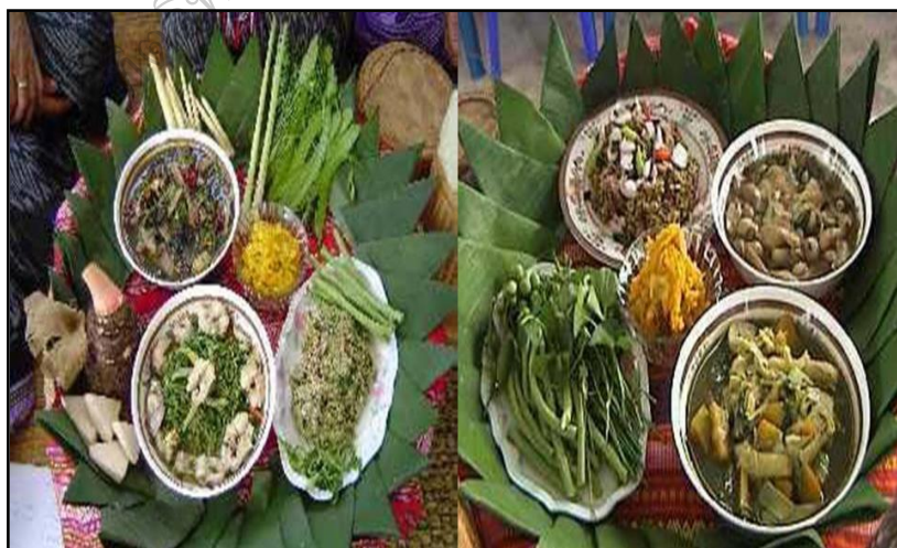
ภาพประกอบ 39 แสดงอาหารพื้นบ้านท้องถิ่นบ้านภู

นอกจากนี้ยังนิยมเลี้ยงสัตว์ไว้เพื่อบริโภค เช่น ไก่ เป็ด สุกร และปลา เป็นต้น เห็นว่าชาวผู้ไทบ้านภู มีถิ่นที่อยู่อาศัยใกล้ภูเขา สามารถหาอาหารจากป่าได้ ชาวผู้ไทบ้านภู ก็เช่นเดียวกันมีลักษณะภูมิประเทศคือ ตั้งบ้านเรือนอยู่บนเนินภูเขาล้อมรอบไปด้วยภูเขาใกล้แหล่งทรัพยากรธรรมชาติสัมพันธ์กับลักษณะของชนิดอาหารที่ชุมชนนิยมรับประทาน เช่น แกงหวาย แกงโค (แกงคร้ว) แกงหม้อเดี๋ยวมียหลายอย่างทั้งผักพื้นบ้าน หัวมันเทศ เนื้อสัตว์ แกงบวบยอดบวบ แกงหน่อไม้ใส่ผักสะแงะ (ผักชีล้อม) แกงผักหวาน และแผลงต่าง ๆ ผู้เฒ่า ผู้แก่บ้านภูมีวัฒนธรรมการกินอาหารที่ยังคงอัตลักษณ์ทางชาติพันธุ์ชนเผ่าผู้ไทดั้งเดิมที่บรรพบุรุษได้สั่งสมมา