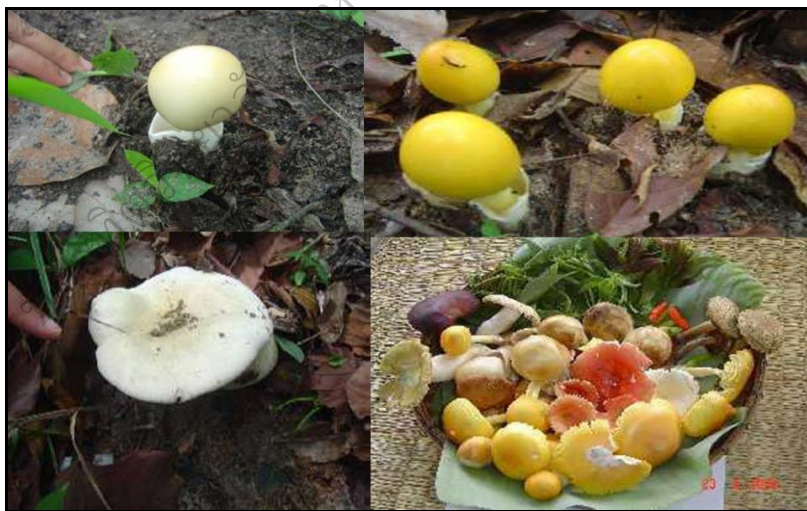
ภาพประกอบ 38 แสดงผลผลิตจากธรรมชาติอาหารพื้นบ้าน

1.2.1.3 ศักยภาพการแหล่งท่องเที่ยวทางธรรมชาติ ผู้วิจัยเห็นว่า ที่ตั้งของหมู่บ้านภูอยู่เทือกเขาภูพานพื้นที่ 'แอ่งสกลนคร' เพราะฉะนั้นจึงมีความอุดมสมบูรณ์ ความหลากหลายทางชีวภาพ ขณะเดียวกันก็ทำให้บ้านภูมีแหล่งท่องเที่ยวทางธรรมชาติที่สวยงามล้อมรอบหมู่บ้าน ชาวบ้านร่วมกันสร้างจุดชมวิวและแหล่งมรดกทางวัฒนธรรม นอกจากนี้ยังใช้เป็นที่ทำมาหากินเก็บของป่าไปใช้สอยบริโภคในครัวเรือน ปัจจุบันพื้นที่มีการเข้าไปใช้ประโยชน์มากยิ่งขึ้นไม่เพียงชาวบ้านภูเท่านั้น ชาวบ้านจากต่างอำเภอต่างตำบล ซึ่งบางส่วนนอกจากนำมาบริโภคในครัวเรือนแล้วยังนำไปขายด้วยการใช้ประโยชน์ทรัพยากรธรรมชาติ ตามวิถีชีวิตชาวบ้านแบ่งออกได้หลายรูปแบบ ได้แก่ หาไม้ ฟืนถ่าน สมุนไพร อาหารพื้นเมือง ได้แก่ เห็ด แมลง พืชท้องถิ่น เช่น บอน ผักหวาน หน่อไม้ หน่อหวาย ใบย่านาง และใช้เป็นทำเล็ยงสัตว์