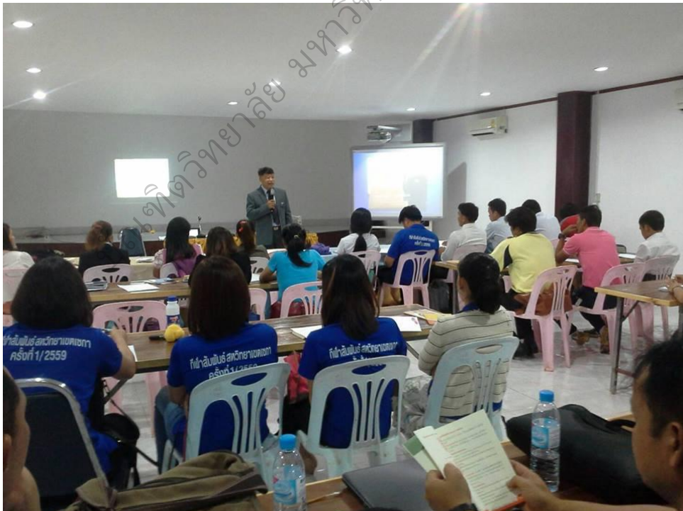
ภาพประกอบ 11 วิทยากรให้ความรู้เกี่ยวกับระบบดูแลช่วยเหลือนักเรียน