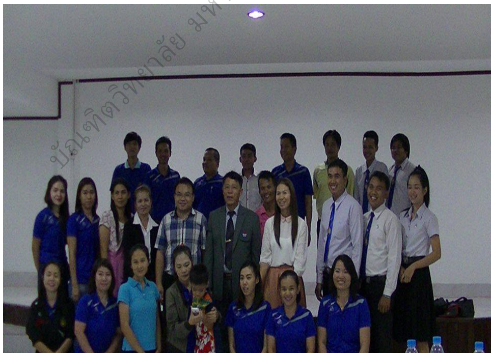
ภาพประกอบ 12 แลกเปลี่ยนเรียนรู้แนวทางการดำเนินงาน