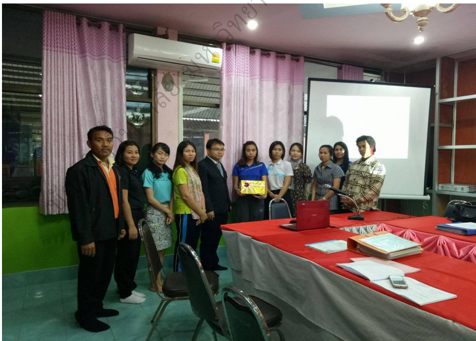
ภาพประกอบ 10 ครูโรงเรียนเซกานำเสนอแนวทางการดำเนินงานระบบดูแลของโรงเรียน