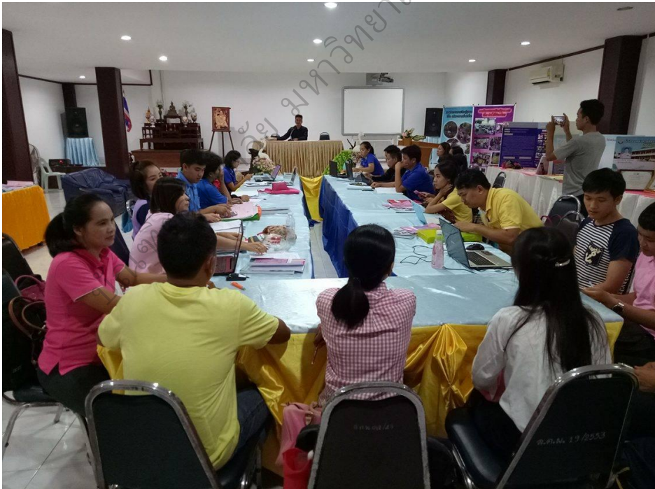
ภาพประกอบ 13 การนิเทศภายในและสรุปผลการดำเนินโครงการ