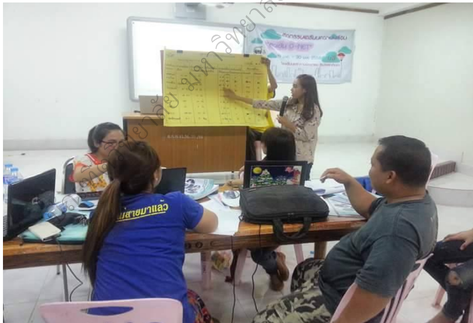
ภาพประกอบ 8 ประชุมวางแผนการดำเนินงาน