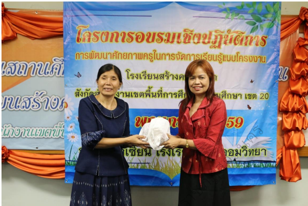
ภาพประกอบ 11

หัวหน้ากลุ่มบริหารวิชาการมอบของที่ระลึกแก่วิทยากร