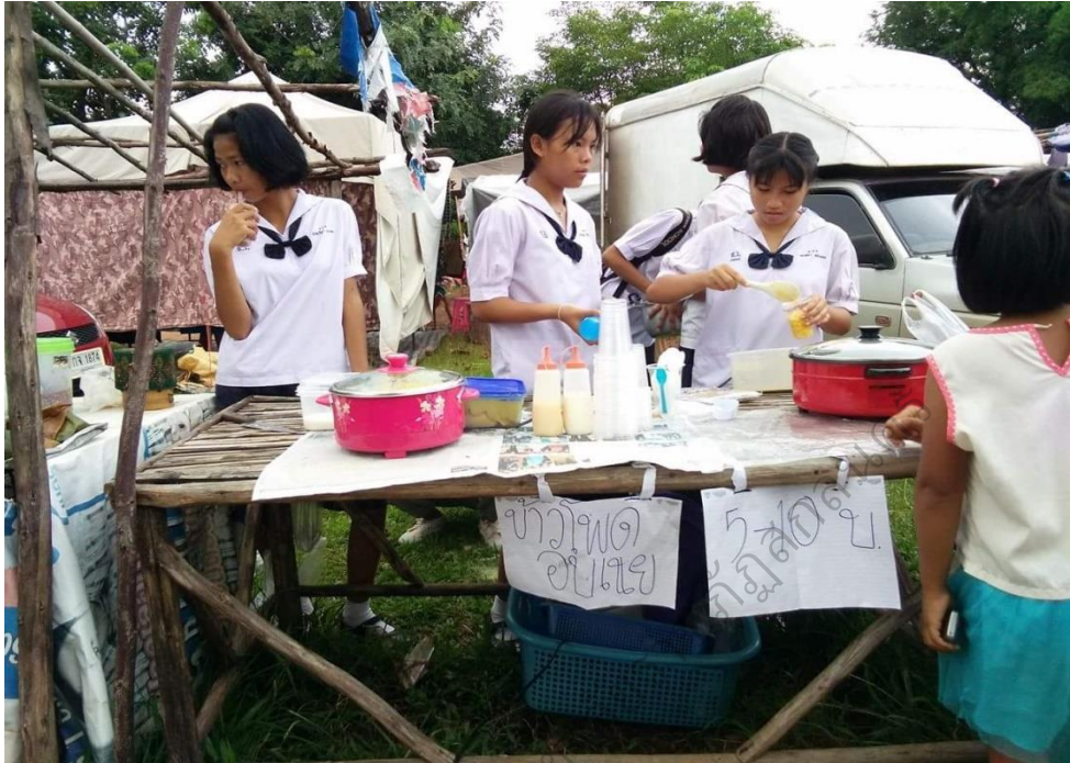
ภาพประกอบ 19 โครงการทดลอง ข้าวโพดคอกเนยสร้างรายได้