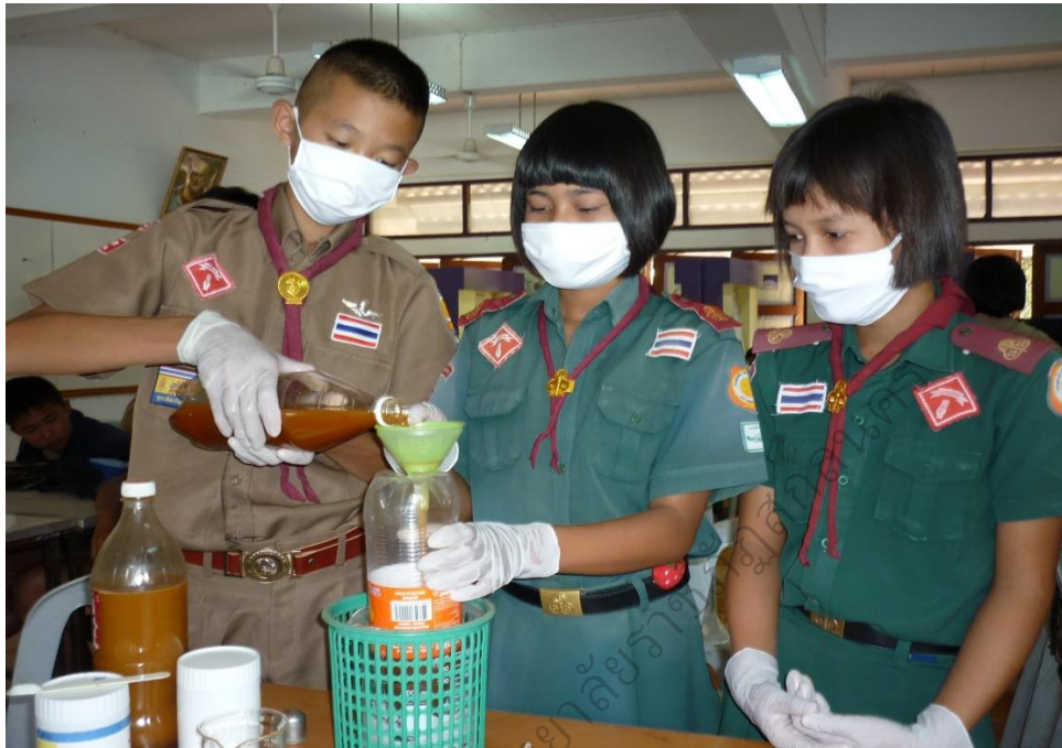
ภาพประกอบ 17 โครงการทดลอง ผลิตไบโอดีเซลจากน้ำมันพืชที่ใช้แล้ว