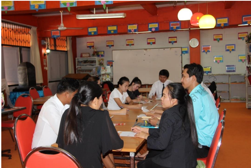
ภาพประกอบ 13