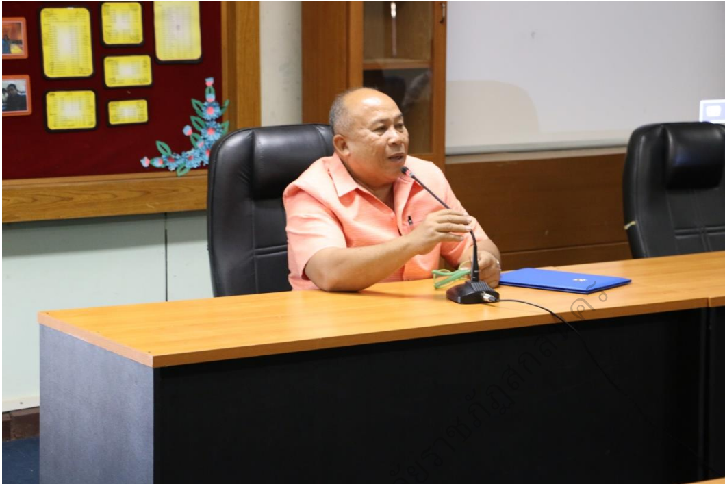
ภาพประกอบ 5

ประธานกล่าวเปิดการอบรมเชิงปฏิบัติการ และบรรยายพิเศษ