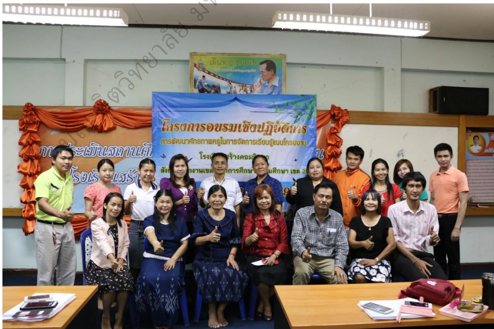
ภาพประกอบ 12

หัวหน้ากลุ่มบริหารวิชาการมอบของที่ระลึกแก่วิทยากร