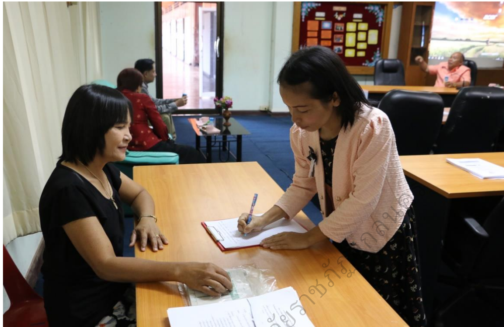
ภาพประกอบ 3