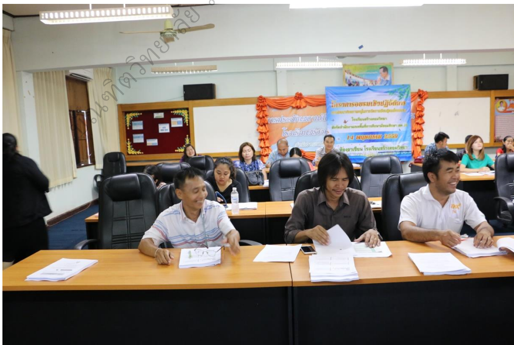
ภาพประกอบ 8