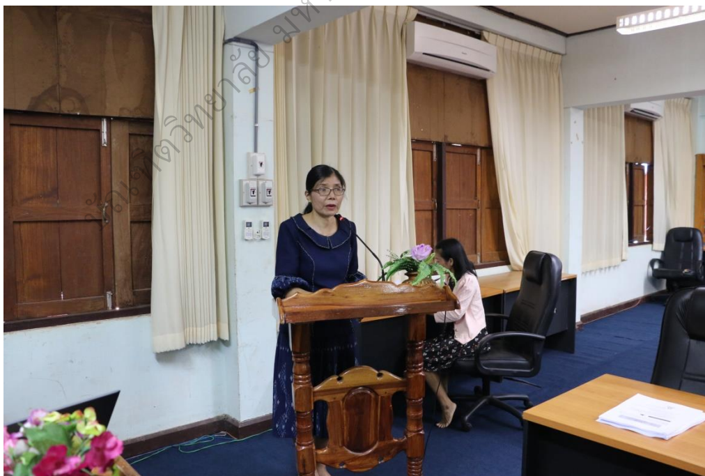
ภาพประกอบ 4