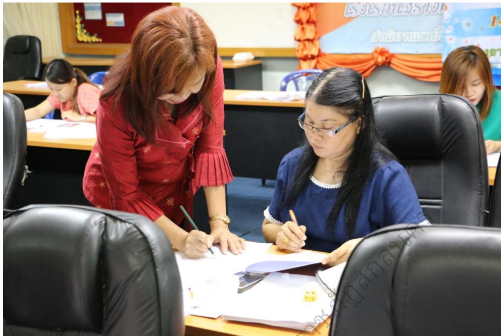
ภาพประกอบ 9

ผู้ร่วมวิจัยฝึกปฏิบัติเขียนแผนจัดการเรียนรู้แบบโครงงาน