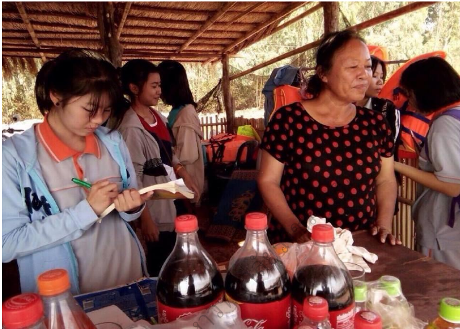
ภาพประกอบ 15 โครงการสำรวจ สำรวจเศรษฐกิจศาสตร์ครอบครัว