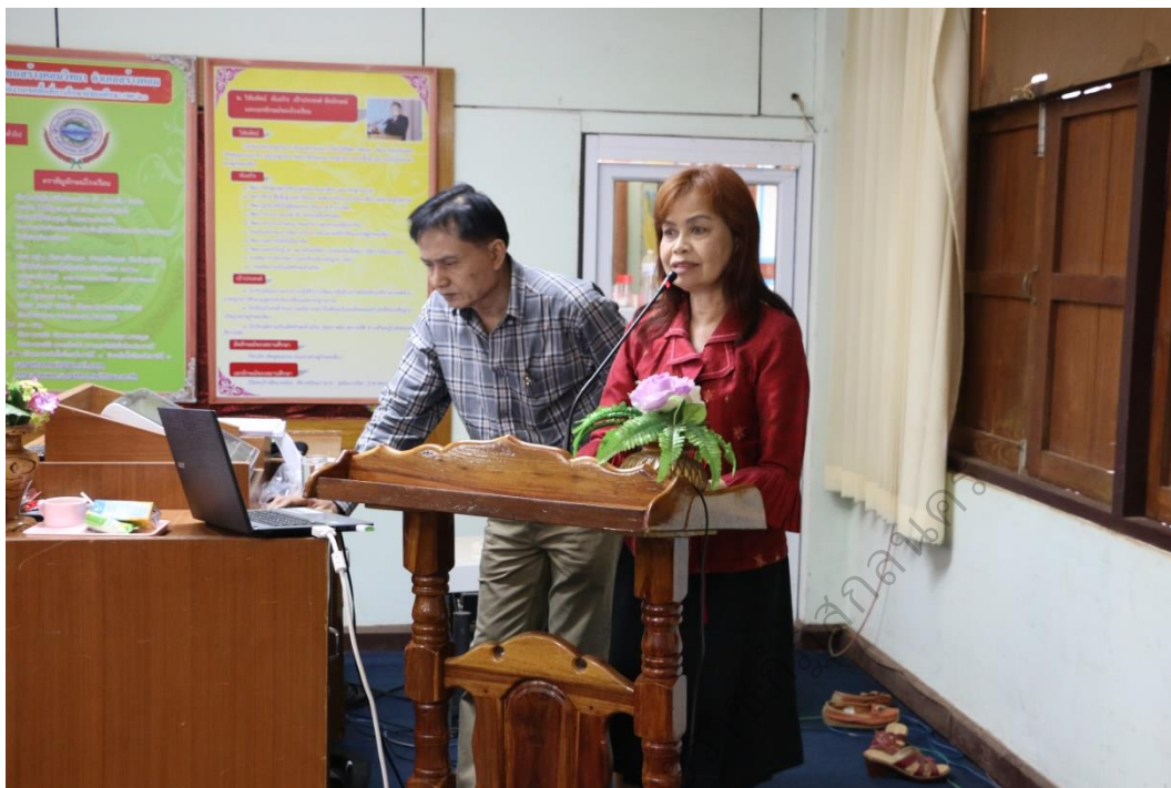
ภาพประกอบ 7