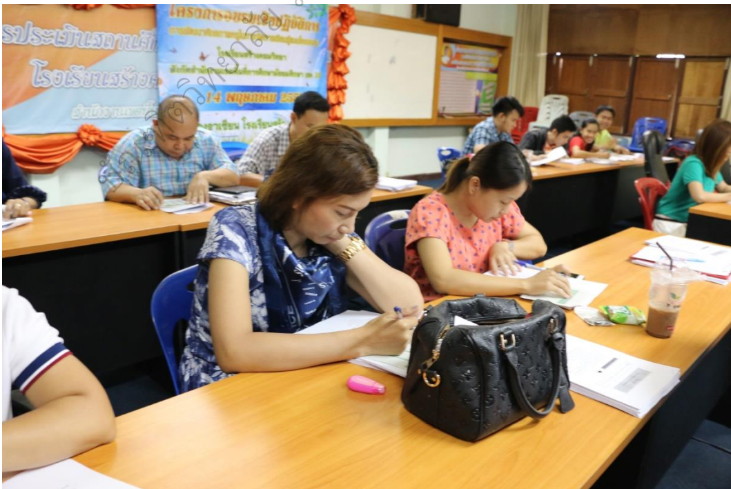
ภาพประกอบ 6

ประธานกล่าวเปิดการอบรมเชิงปฏิบัติการ และบรรยายพิเศษ