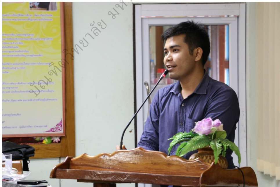
ภาพประกอบ 10

ผู้ร่วมวิจัยฝึกปฏิบัติเขียนแผนจัดการเรียนรู้แบบโครงงาน