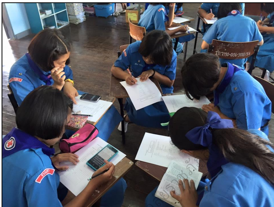
การจัดการเรียนรู้: ชั้นที่ 2 ทำความเข้าใจกับคำศัพท์