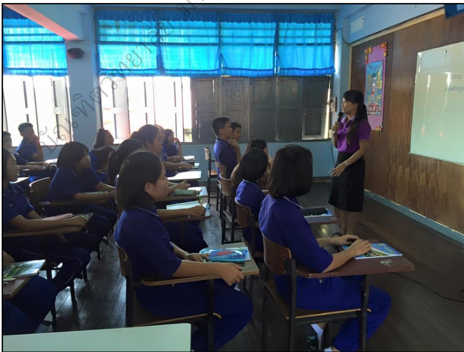
การจัดการเรียนรู้: ชั้นที่ 7 ประเมินผลและแก้ไข