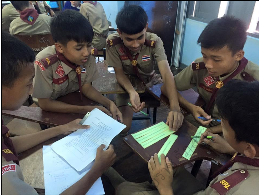
การจัดการเรียนรู้: ชั้นที่ 6 ทำแบบฝึกหัดต่อชิ้นส่วนประโยคและเรียงโครงสร้างอนุเจต