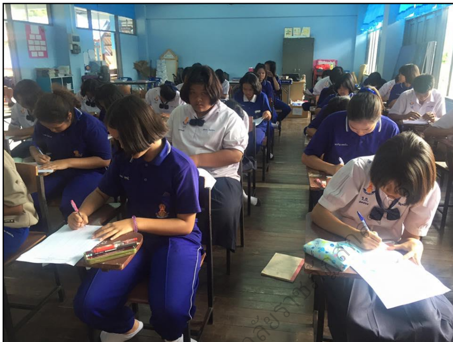
นักเรียนทำแบบวัดเจตคติก่อนการทดลอง