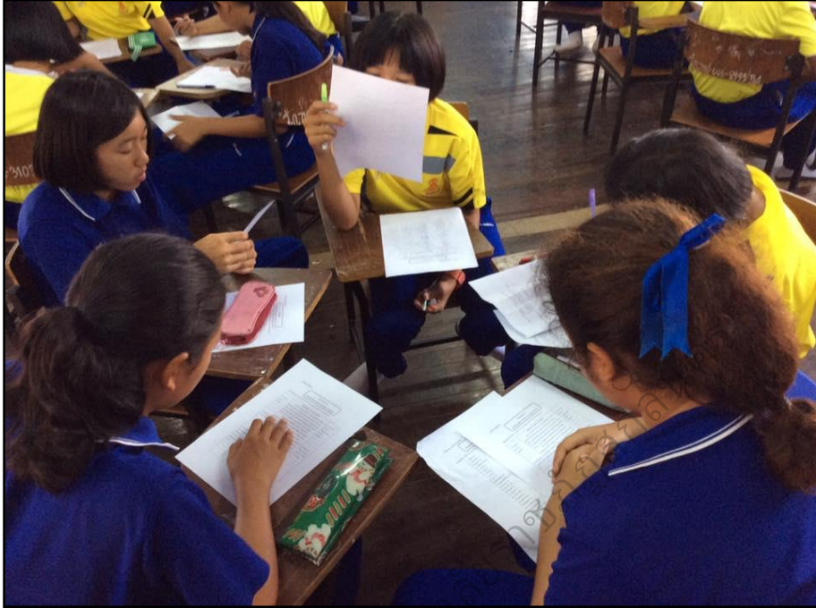
การจัดการเรียนรู้: ชั้นที่ 4 ทำความเข้าใจกับเนื้อเรื่อง