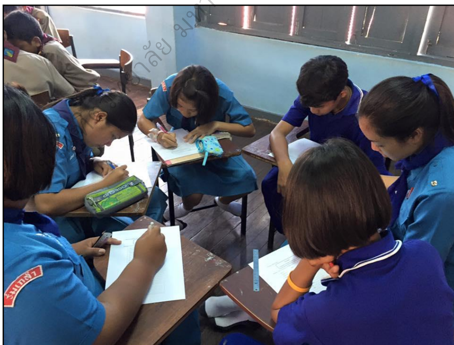
การจัดการเรียนรู้: ชั้นที่ 3 อ่านเนื้อเรื่อง