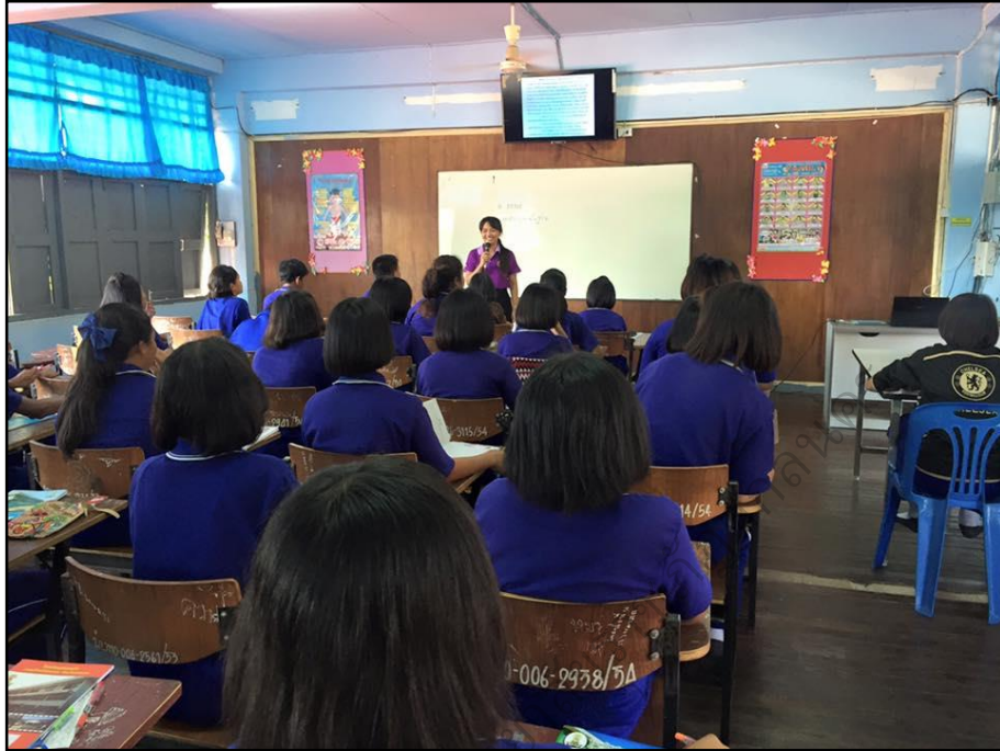
ประชุมนิเทศนักเรียน