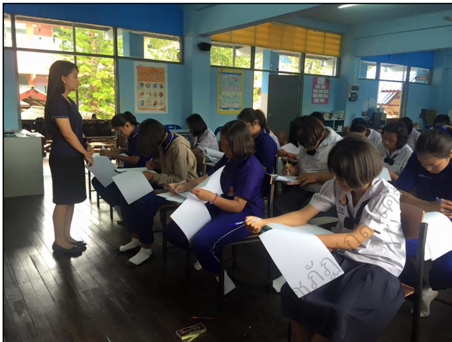
นักเรียนทำแบบทดสอบหลังเรียน