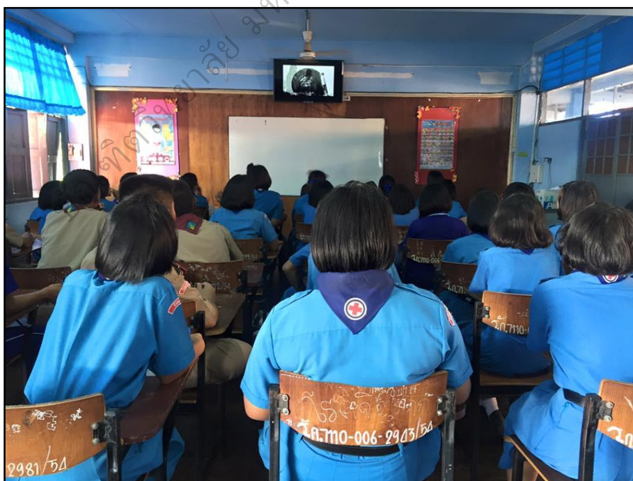
การจัดการเรียนรู้: ชั้นที่ 1 ตั้งคำถามนำก่อนการอ่าน