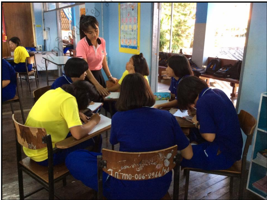
การจัดการเรียนรู้: ชั้นที่ 5 ถ่ายโอนข้อมูล