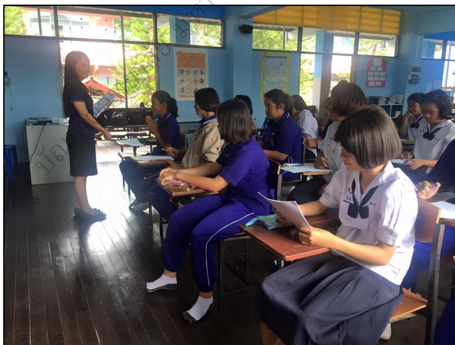
นักเรียนทำแบบวัดเจตคติหลังการทดลอง