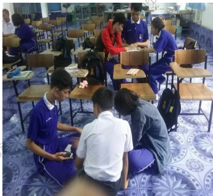
ภาพประกอบ 3 อ่านบทและฝึกซ้อมการแสดงเป็นกลุ่ม