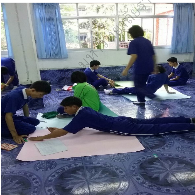
ภาพประกอบ 2 การเตรียมฉากสำหรับเล่นละครโดยใช้สถานการณ์ต่างๆ