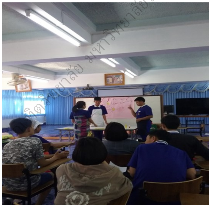
ภาพประกอบ 6 การแสดงโดยใช้ละครสด