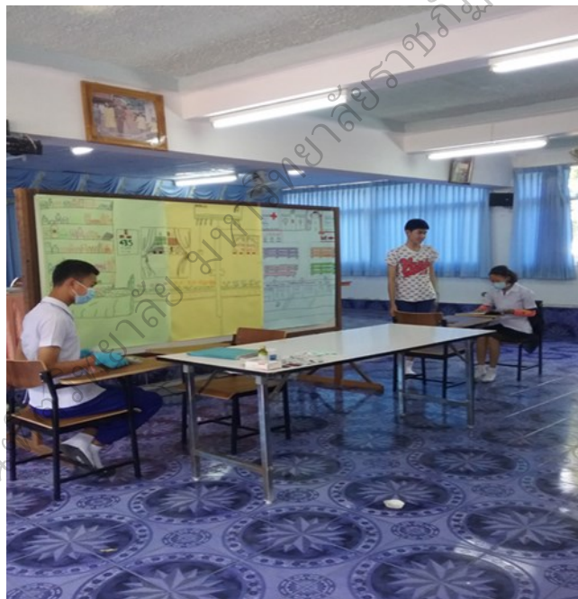
ภาพประกอบ 5 การแสดงโดยใช้บทบาทสมมติ