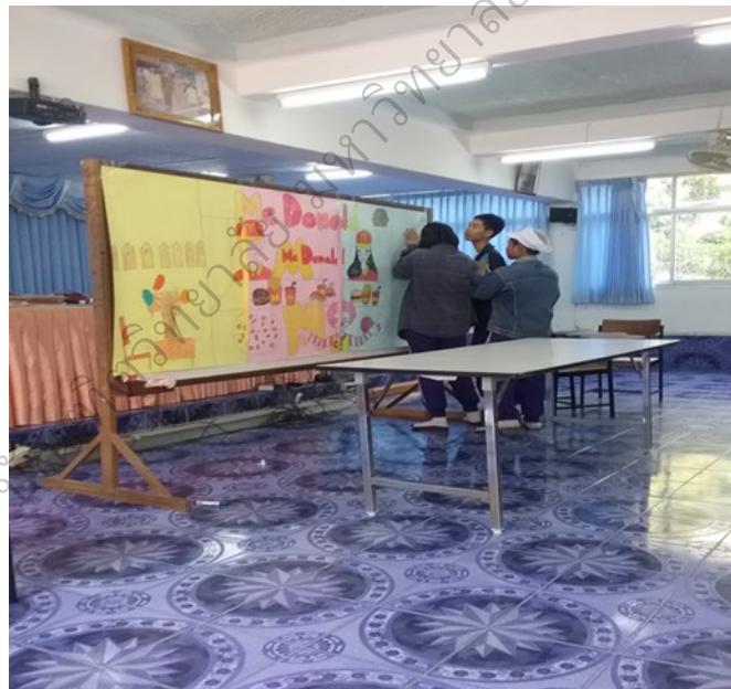
ภาพประกอบ 4 จัดเตรียมสถานที่ประกอบการแสดงบทบาทสมมติ