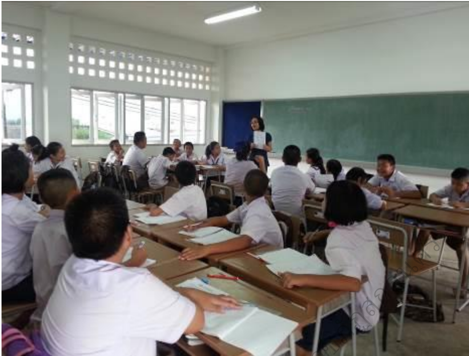
ครูอธิบาย แนะนำเกี่ยวกับวิธีการเรียนรู้ด้วยกิจกรรมส่งเสริมความคิดสร้างสรรค์