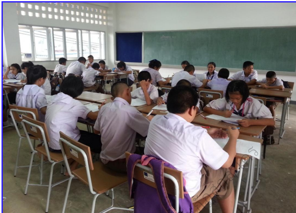
ภาพประกอบ 11 นักเรียนให้ความสนใจและตั้งใจเรียนรู้กิจกรรม

จากที่กล่าวมา สรุปได้ว่าการจัดการเรียนรู้ด้วยกิจกรรมส่งเสริมความคิดสร้างสรรค์ เพื่อเสริมสร้างความสามารถด้านการเขียนเชิงสร้างสรรค์ กลุ่มสาระการเรียนรู้ภาษาไทยของนักเรียนชั้นประถมศึกษาปีที่ 6 ช่วยให้นักเรียนมีความเข้าใจในกระบวนการทำงานกลุ่ม มีวินัยในตนเอง มีความสามัคคี มีการช่วยเหลือซึ่งกันและกัน แลกเปลี่ยนเรียนรู้ ยอมรับฟังความคิดเห็นของผู้อื่น และกล้าแสดงออก ทำให้นักเรียนมีการพัฒนาความสามารถในการทำงานกลุ่ม ซึ่งสามารถนำไปประยุกต์ใช้ในการดำเนินชีวิตได้