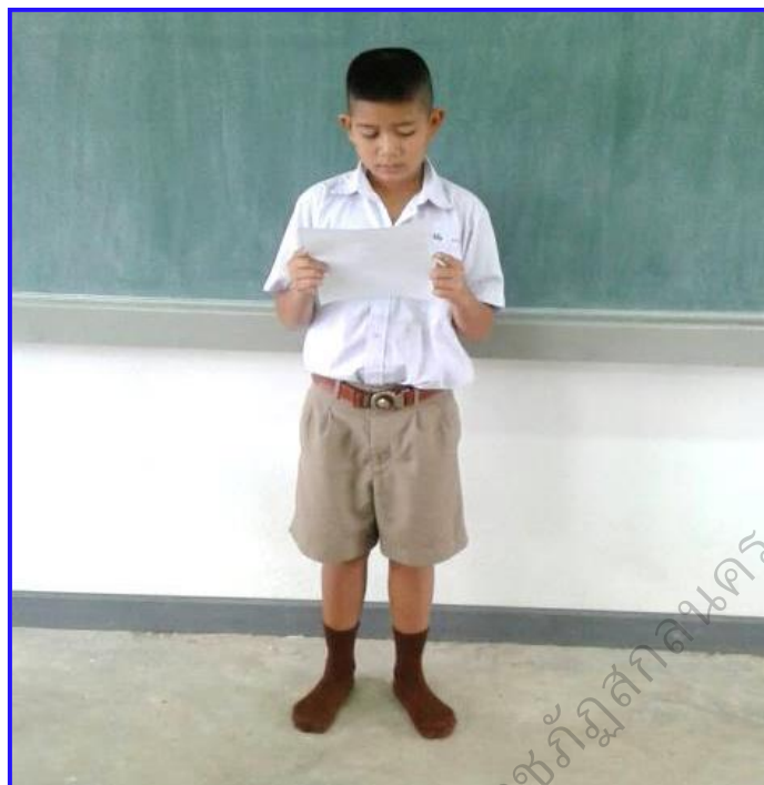
ภาพประกอบ 13 นักเรียนเสนองานเขียนที่หน้าชั้นเรียน