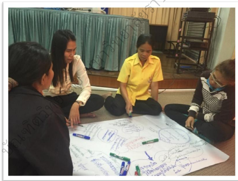
ภาพประกอบ 14 ระยะที่ 1 กิจกรรมการอบรมเชิงปฏิบัติการ เรื่อง รูปแบบการพัฒนา ภาวะผู้นำเชิงสร้างสรรค์ของครูในโรงเรียนประถมศึกษา สังกัดสำนักงานคณะกรรมการ การศึกษาขั้นพื้นฐาน ในภาคตะวันออกเฉียงเหนือตอนบน