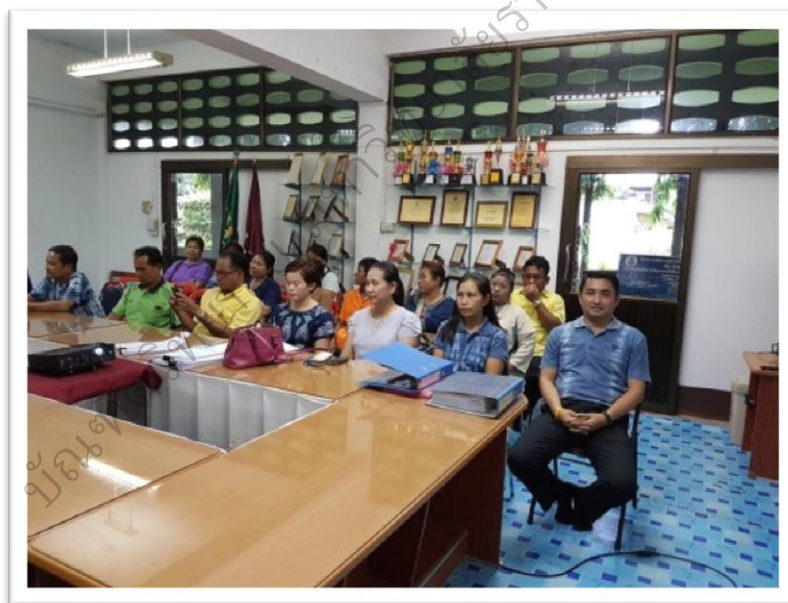
ภาพประกอบ 16 ระยะที่ 2 ครูผู้สอนในสถานศึกษานำไปฝึกปฏิบัติจริงที่โรงเรียน