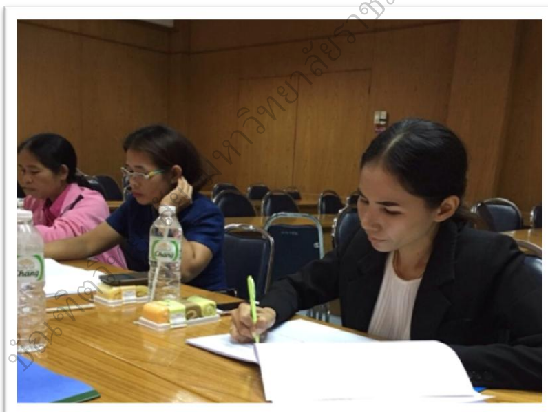
ภาพประกอบ 18 ระยะที่ 3 การประเมินผล สรุปผลการทดลองใช้ รูปแบบการพัฒนาภาวะผู้นำเชิงสร้างสรรค์ของครู