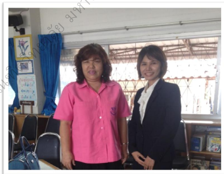
ภาพประกอบ 11 สัมภาษณ์เชิงลึกผู้ทรงคุณวุฒิ