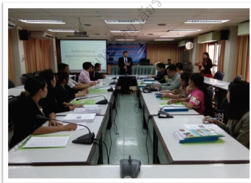
ภาพประกอบ 12 ครูผู้สอนในสถานศึกษาเข้ารับการอบรมเชิงปฏิบัติการ เรื่องรูปแบบการพัฒนาภาวะผู้นำเชิงสร้างสรรค์ของครูในโรงเรียนประถมศึกษา สังกัดสำนักงานคณะกรรมการการศึกษาขั้นพื้นฐานในภาคตะวันออกเฉียงเหนือตอนบน