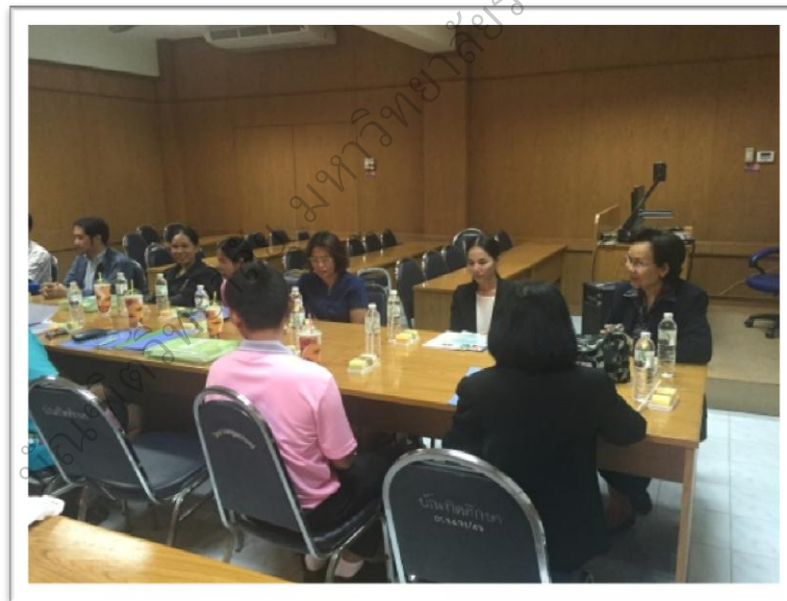
ภาพประกอบ 17 ระยะที่ 3 การประเมินผล สรุปผลการทดลองใช้ รูปแบบการพัฒนาภาวะผู้นำเชิงสร้างสรรค์ของครู