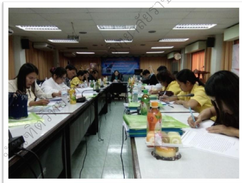
ภาพประกอบ 15 สรุปแนวทางในการนำไปฝึกปฏิบัติจริง