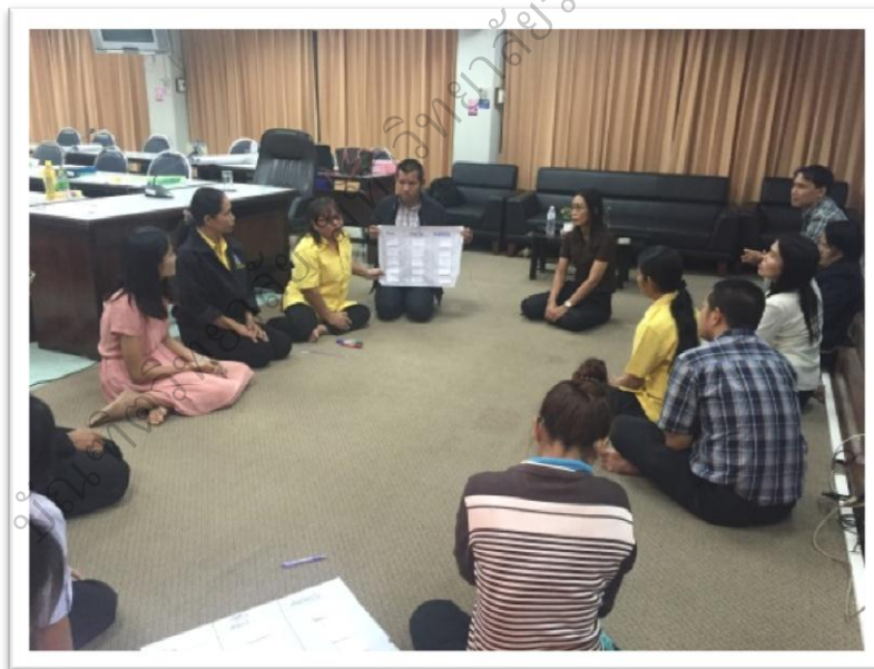
ภาพประกอบ 13 ระยะเวลาที่ 1 กิจกรรมการอบรมเชิงปฏิบัติการ เรื่อง รูปแบบการพัฒนา ภาวะผู้นำเชิงสร้างสรรค์ของครูในโรงเรียนประถมศึกษาสังกัดสำนักงานคณะกรรมการ การศึกษาขั้นพื้นฐาน ในภาคตะวันออกเฉียงเหนือตอนบน