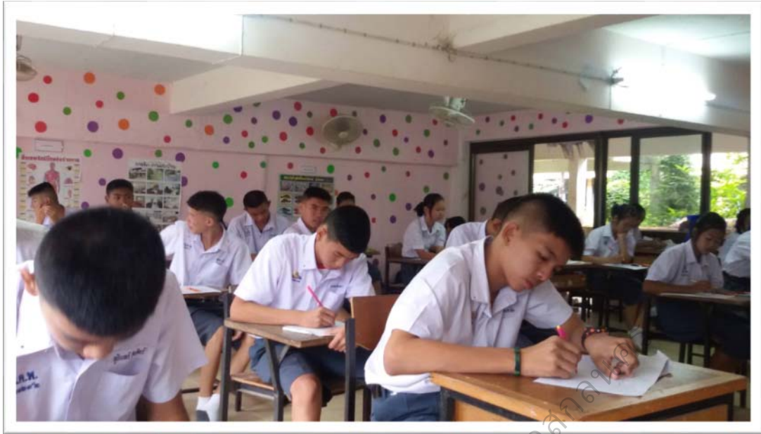
ภาพประกอบ 16 วัดและประเมินผลก่อนและหลังเรียน

บัณฑิตวิทยาลัย มหาวิทยาลัยราชภัฏวไลยอลงกรณ์