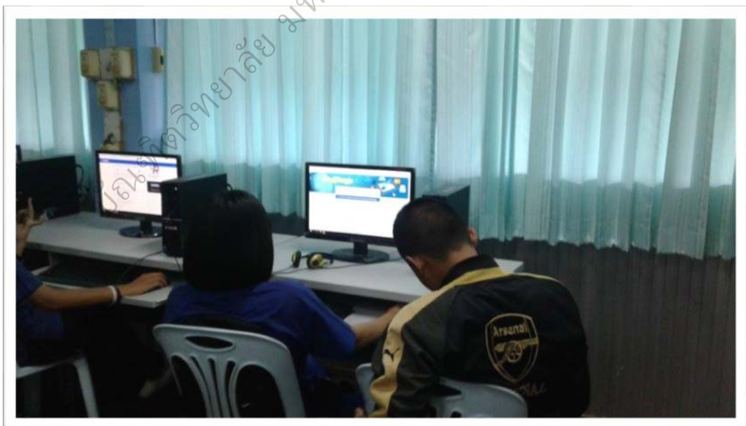
ภาพประกอบ 11 นักเรียนวางแผนการค้นข้อมูล