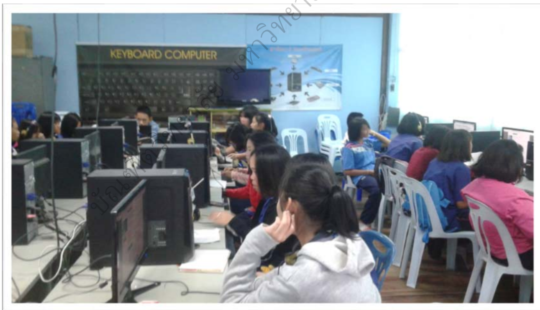
ภาพประกอบ 13 สมาชิกในกลุ่มร่วมกันแลกเปลี่ยนความคิดเห็นจากข้อมูลที่ได้ค้นคว้ามา