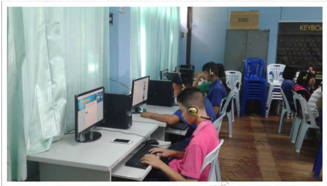
ภาพประกอบ 14 นักเรียนร่วมกันสร้างชิ้นงานผ่านโปรแกรม