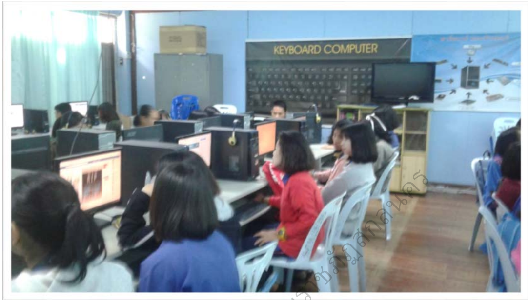
ภาพประกอบ 10 การอภิปรายร่วมกันของนักเรียนในชั้นเรียน