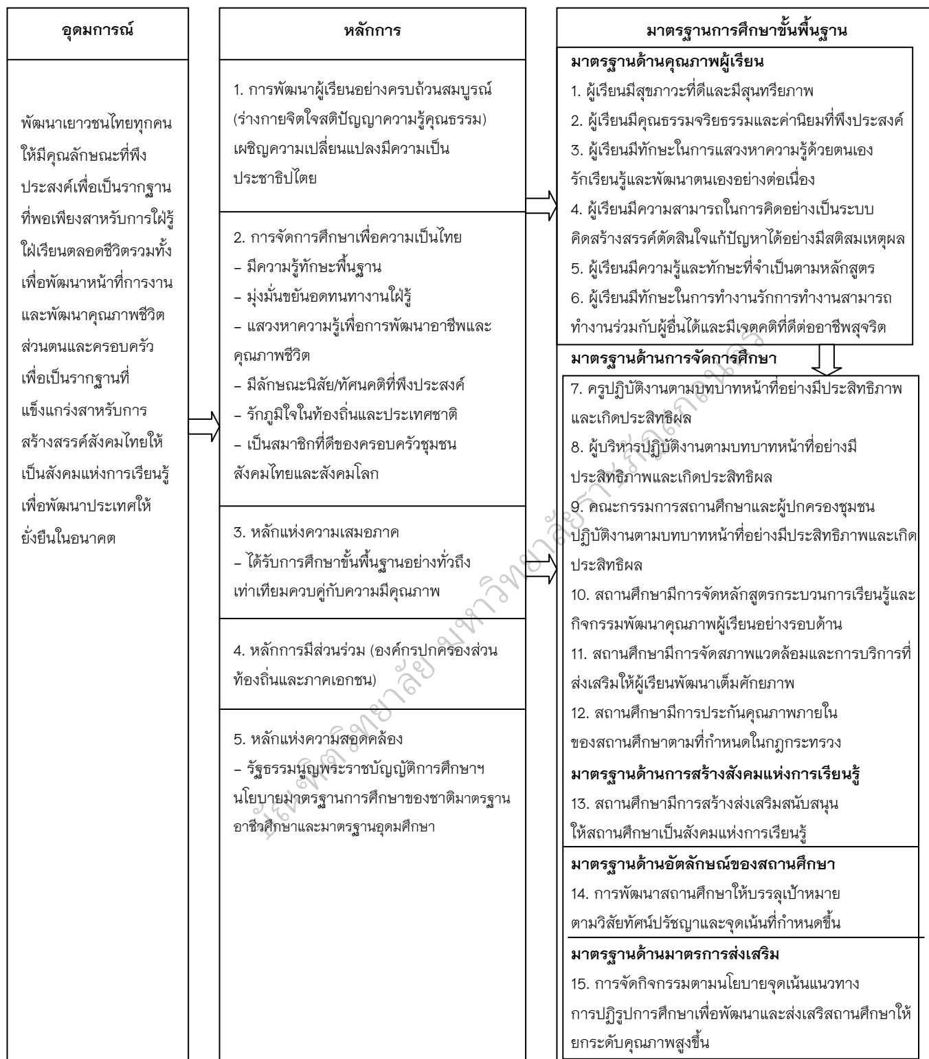
ภาพประกอบ 3 ความเชื่อมโยงระหว่างอุดมการณ์หลักการและมาตรฐานการศึกษาขั้นพื้นฐาน (สำนักงานคณะกรรมการการศึกษาขั้นพื้นฐาน, 2553, หน้า 13)