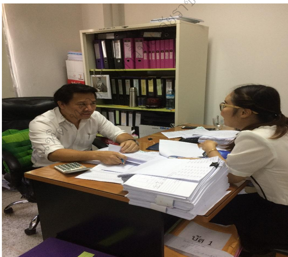
ภาพประกอบ 7 การสัมภาษณ์เพื่อหาแนวทางการพัฒนาประสิทธิภาพการปฏิบัติตาม สมรรถนะหลักของข้าราชการองค์การบริหารส่วนจังหวัดสกลนคร