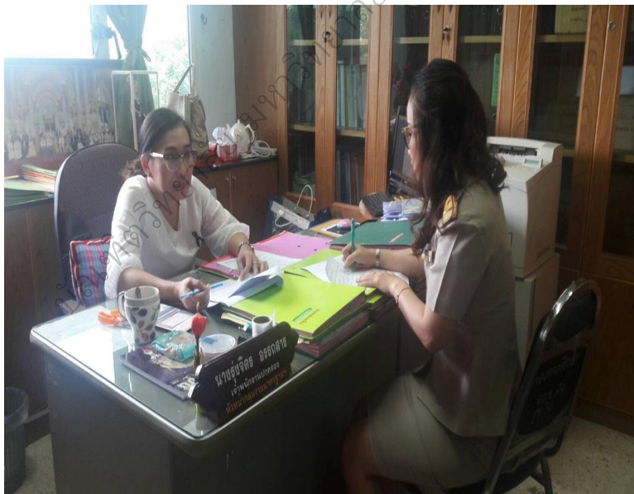
ภาพประกอบ 9 การสัมภาษณ์เพื่อหาแนวทางการพัฒนาประสิทธิภาพการปฏิบัติตาม สมรรถนะหลักของข้าราชการองค์การบริหารส่วนจังหวัดสกลนคร