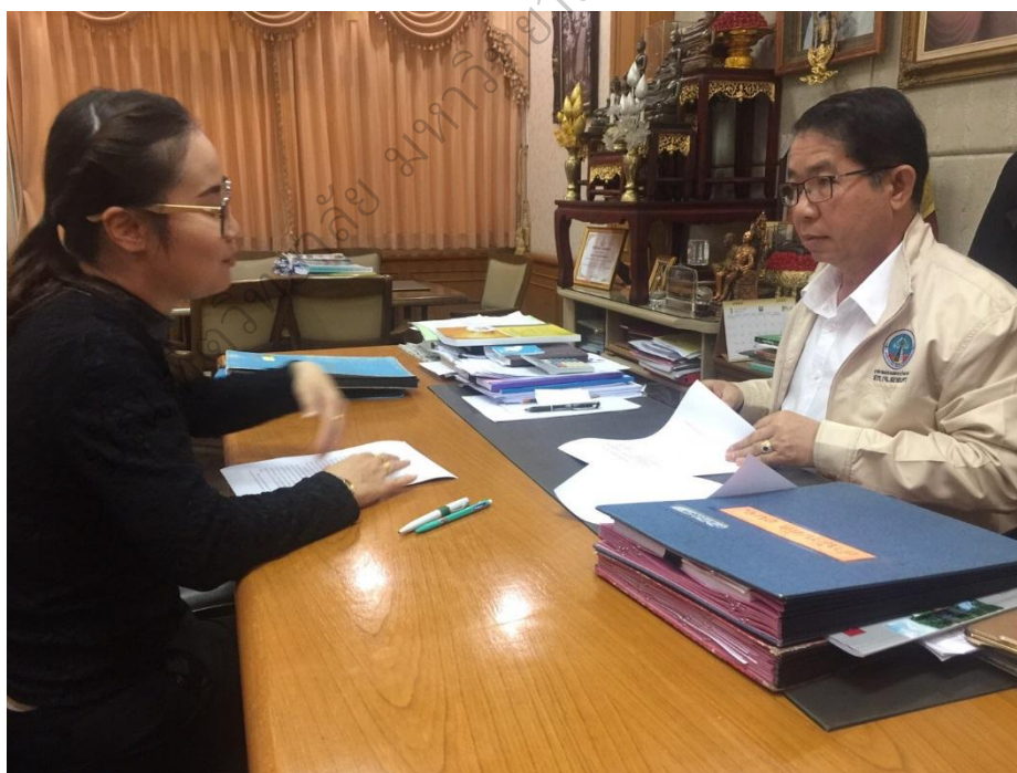
ภาพประกอบ 6 การสัมภาษณ์เพื่อหาแนวทางการพัฒนาประสิทธิผลการปฏิบัติตาม สมรรถนะหลักของข้าราชการองค์การบริหารส่วนจังหวัดสกลนคร