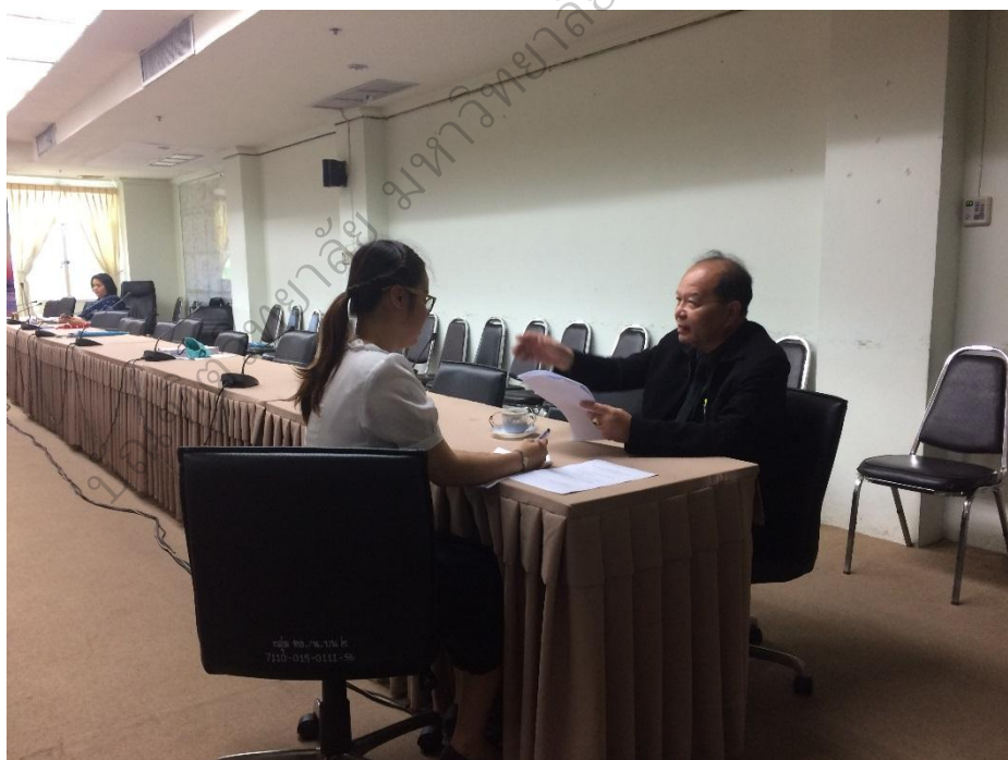
ภาพประกอบ 8 การสัมภาษณ์เพื่อหาแนวทางการพัฒนาประสิทธิภาพการปฏิบัติงาน สมรรถนะหลักของข้าราชการองค์การบริหารส่วนจังหวัดสกลนคร