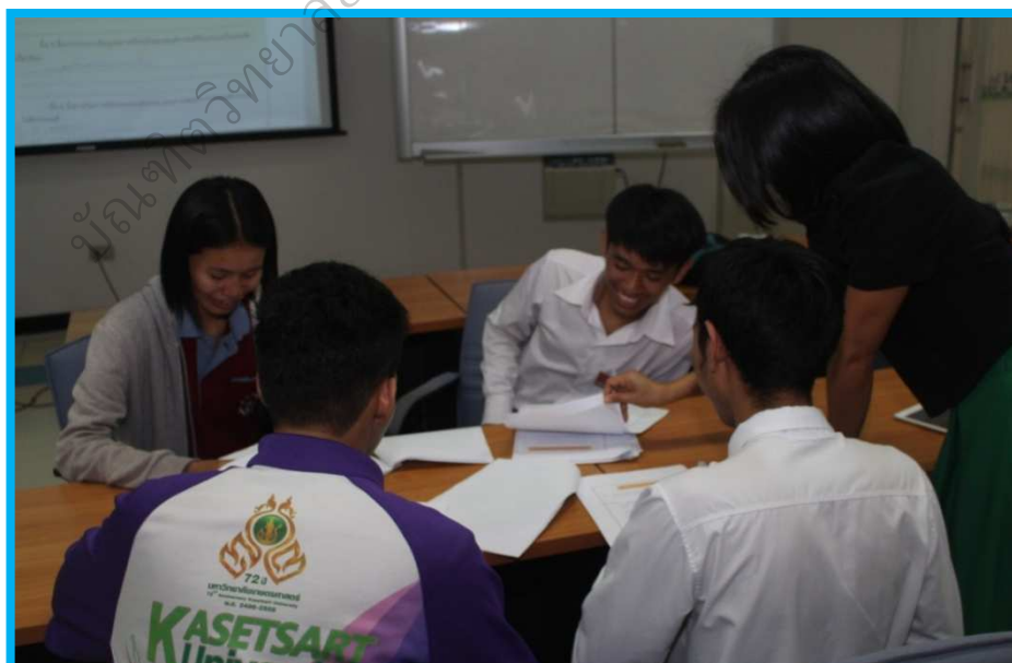
ภาพประกอบ 13 นิสิตเข้าร่วมกิจกรรมการแลกเปลี่ยนการเรียนรู้

“...ข้าพเจ้ามีความภูมิใจที่ได้พยายามที่จะช่วยเพื่อนๆ ในกลุ่มทำให้ ข้าเจ้าเกิดการเรียนรู้อย่างมากที่สุดเท่าที่ทำมา คิดอยู่ตลอดเวลาว่า ถ้าหากว่าเราไม่รู้จัก วางแผนที่จะช่วยกันให้ได้มาซึ่งข้อมูลใดข้อมูลหนึ่ง ดังนั้นจึงเป็นหน้าที่ของพวกเราที่จะต้อง คอยกระตุ้น ชี้นำ แนะนำเพื่อให้ได้แนวทางแก้ปัญหาหรือได้การค้นหาคำความรู้ ซึ่งเป็นหน้าที่ ของพวกเราที่จะช่วยกันให้เกิดการเรียนรู้มากขึ้น และเป็นประโยชน์ต่อเพื่อนและตัวเราเอง มากที่สุด.....”