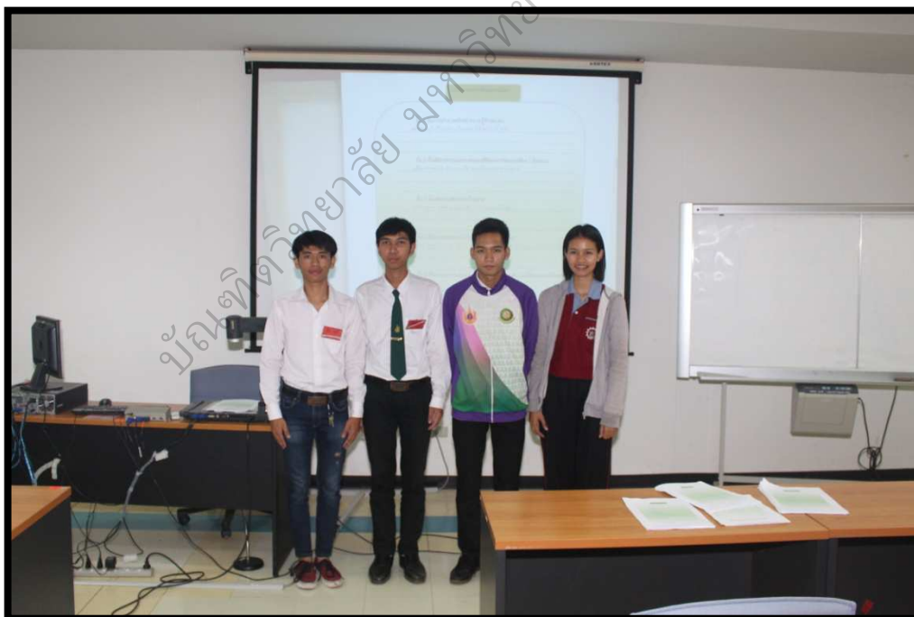
ภาพประกอบ 11 ตัวแทนกลุ่มเตรียมความพร้อม นำเสนอผลงาน