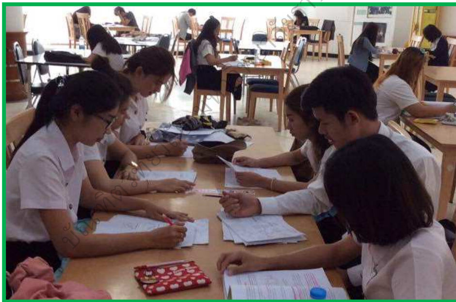
ภาพประกอบ 6 นิสิตศึกษาใบความรู้เกี่ยวกับทักษะการเรียนรู้ แล้วช่วยกันทำใบกิจกรรม

“...จากการเข้าร่วมการพัฒนาโปรแกรมเสริมสร้างทักษะการเรียนรู้ โดยผ่านกิจกรรมในแต่ละกิจกรรม ทำให้เกิดความรู้ความเข้าใจได้ชัดเจนยิ่งขึ้นเพราะขณะดำเนินกิจกรรมนั้น เราได้คิด ได้วิเคราะห์อย่างเต็มที่ นิสิตได้ค้นคว้าข้อมูลเพิ่มเติมเพื่อนำข้อมูลที่ถูกต้องมาทำลงในใบกิจกรรม มีการให้ความรู้ร่วมกับกลุ่ม ด้วยการชี้แนะซึ่งกัน และกัน จึงทำให้เกิดความรู้ ความเข้าใจในทักษะการเรียนรู้ มีความมั่นใจ ในตนเองมากยิ่งขึ้น...”