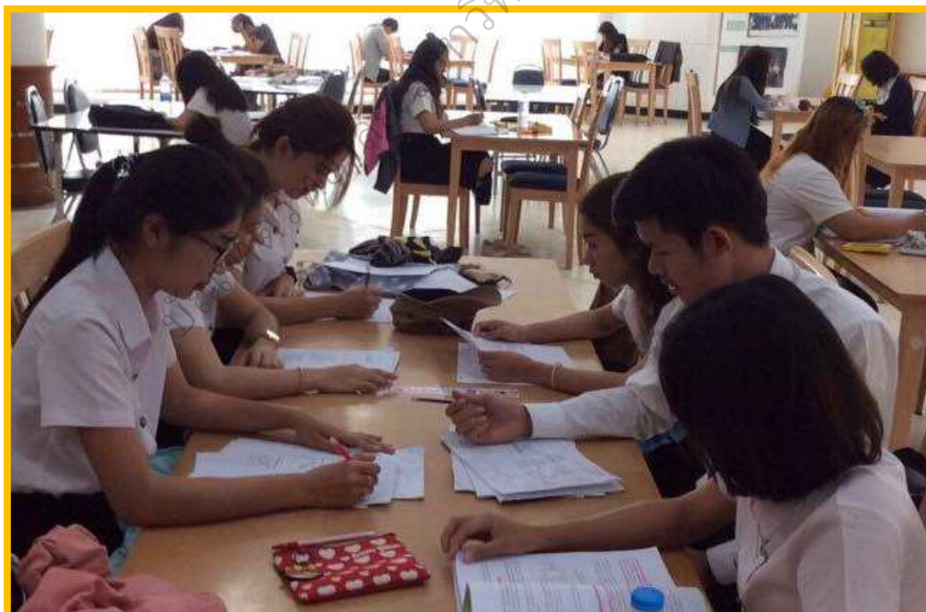
ภาพประกอบ 8 นิสิตได้ฝึกทักษะการอ่านและจดบันทึกข้อมูล