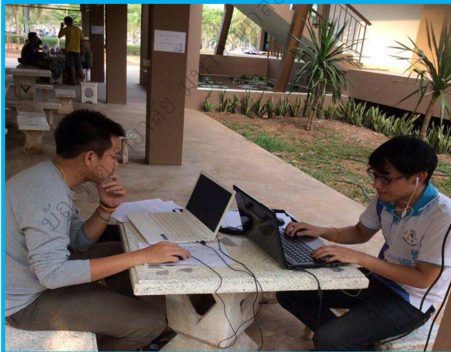
ภาพประกอบ 7 นิสิตกำลังสืบค้นข้อมูลสารสนเทศในห้องสมุดและนอกห้องเรียน