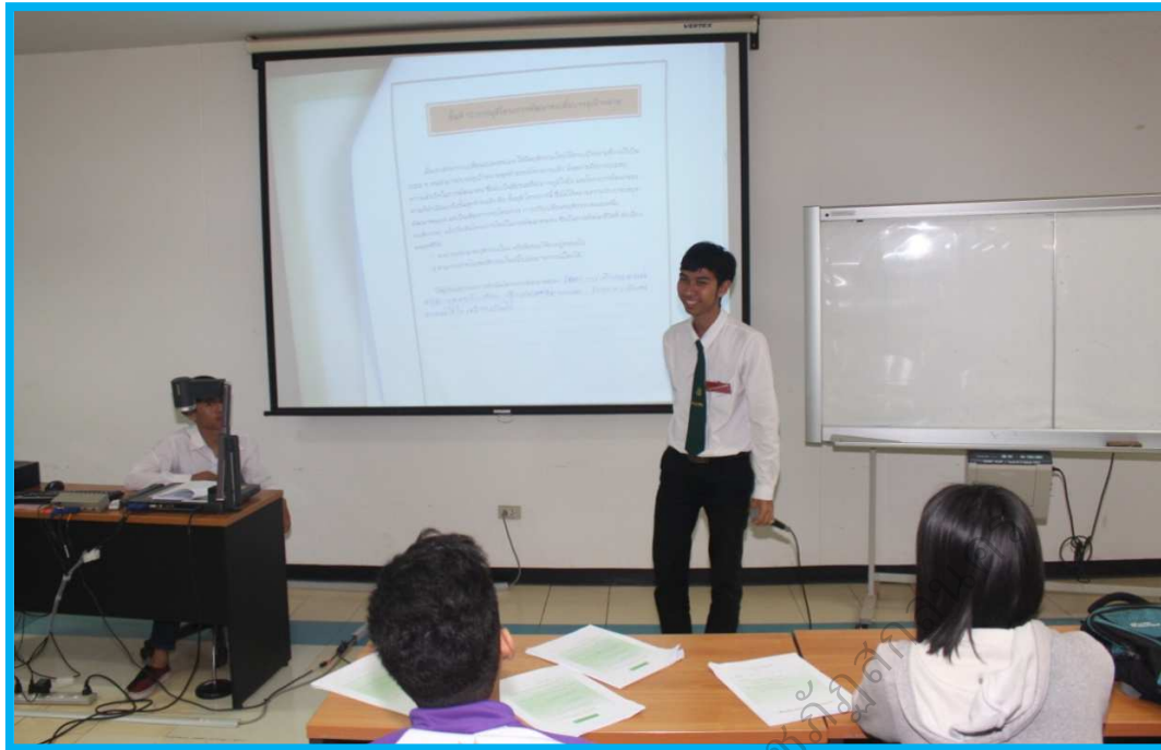
ภาพประกอบ 14 ตัวแทนนิสิตนำเสนอผลงานกลุ่มจากการสืบค้นข้อมูล และการอ่าน และการจัดบันทึก

จากข้อความในบันทึกความคิดเห็นของนิสิตตัวอย่างข้างต้น จะเห็นได้ว่านิสิตได้เกิดความเชื่อ เกิดความรู้สึกรักคิดที่ดี ตลอดจนมีความตระหนักในบทบาทของตนเอง ว่าทำอย่างไรจึงเกิดการเรียนรู้ได้อย่างประสิทธิผล และการที่เกิดจากการพัฒนา นิสิตตามกระบวนการของโปรแกรมที่พัฒนาขึ้นนั้น ได้สนับสนุน ส่งเสริมให้นิสิตปรับเปลี่ยน พฤติกรรมการการเรียนรู้ เกิดความรู้ความเข้าใจมีความเชื่อมั่นในตนเอง มีทักษะการ เรียนรู้เพิ่มขึ้นช่วยให้นิสิตเกิดการเรียนรู้ได้อย่างมีประสิทธิภาพ