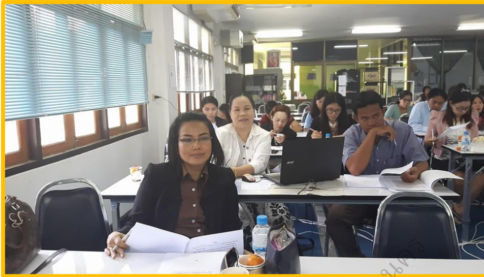
บรรยากาศของการอบรม