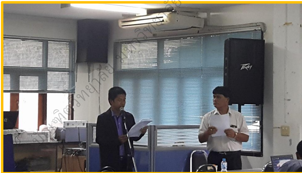
ผู้เข้ารับการฝึกอบรมมีส่วนร่วมในการฝึกอบรม