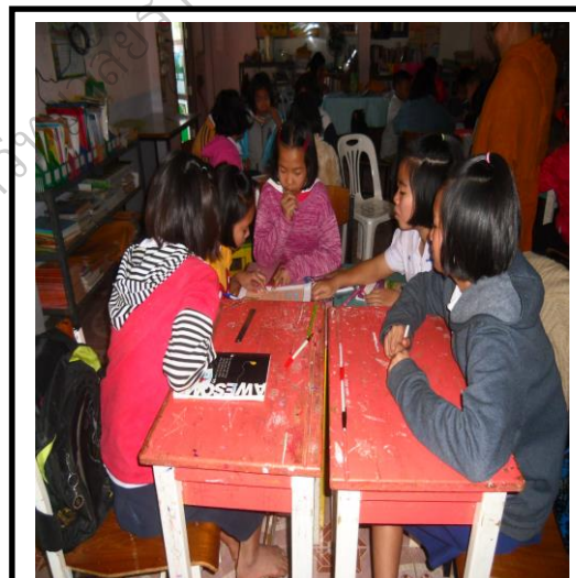
ภาพประกอบ 23 นักเรียนมีความสามัคคีกันในการทำงานกลุ่ม