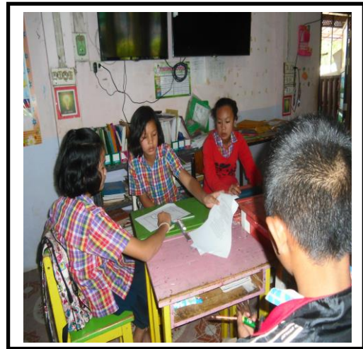
ภาพประกอบ 21 นักเรียนรู้จักแบ่งงาน แบ่งหน้าที่ในการทำงานกลุ่ม