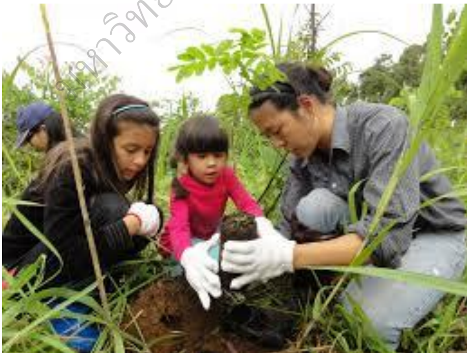
การมีส่วนร่วมของเยาวชนในการอนุรักษ์ป่าชุมชน

7. นอกจากชนิดไม้ และกิจกรรมอื่น ๆ ที่รัฐส่งเสริมปลูกนอกจากนี้ยังไม่มีให้นำแนวความคิด วนเกษตรอื่น ๆ มาใช้ จำเป็นที่จะต้องศึกษาหาความต้องการชนิดไม้หรือประโยชน์อื่น ๆ จากป่าไม้ให้ ชัดเจนยิ่งขึ้นตลอดจนการใช้หรือปฏิบัติการในป่าชุมชนเพื่อให้ประโยชน์สูงสุด และยั่งยืน เช่น แนวความคิดวนเกษตรในรูปแบบที่เหมาะสมกับแต่พื้นที่