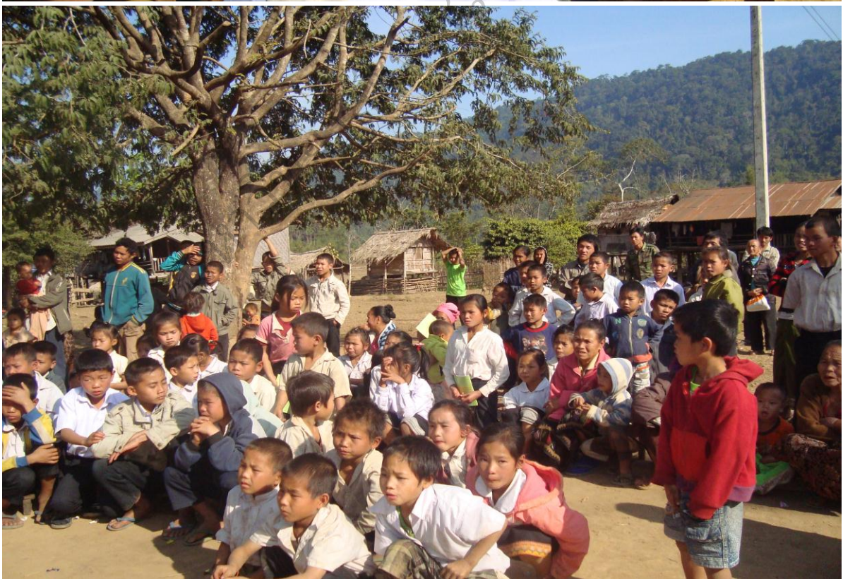
ภาพประกอบ 3 ภาพกิจกรรมอบรมเสริมสร้างความรู้ และความตระหนัก ในการอนุรักษ์ป่าชุมชนให้แก่เยาวชน