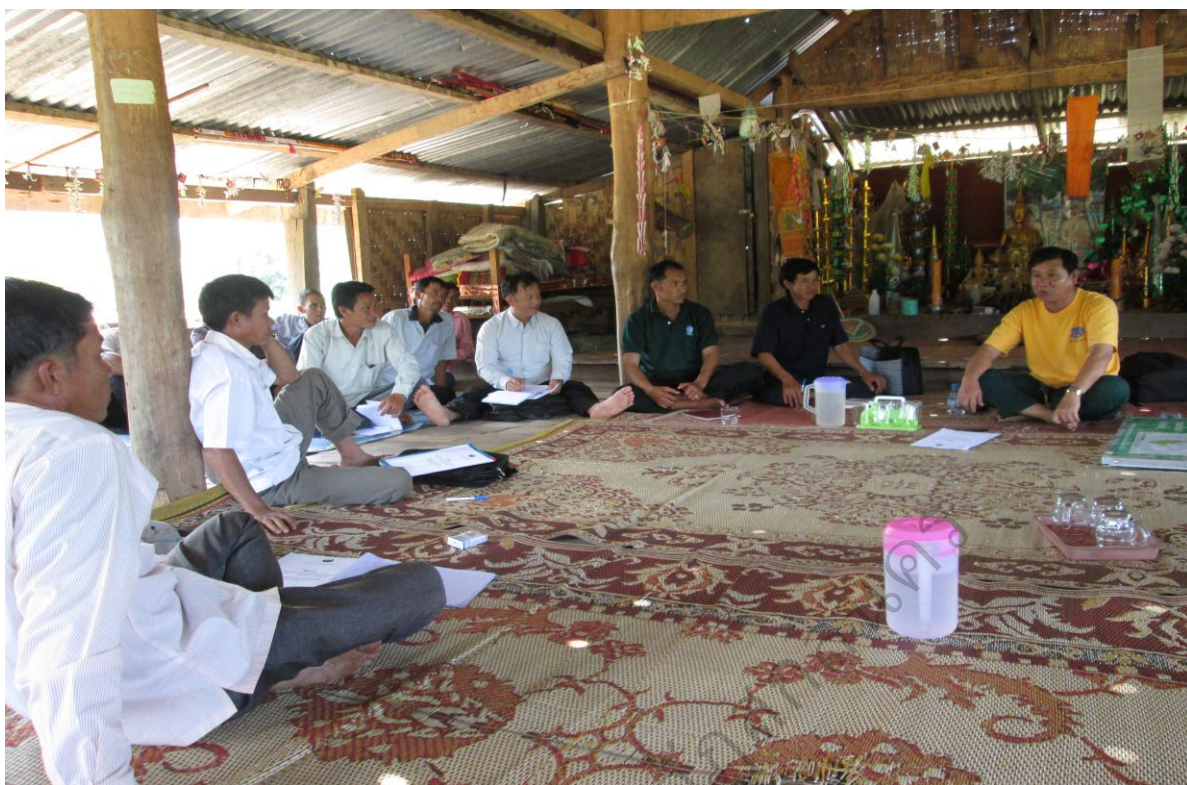
ภาพประกอบ 1 ภาพกิจกรรมการศึกษาสภาพปัญหาในการอนุรักษ์ป่าชุมชนบ้านโนนสมบูรณ์