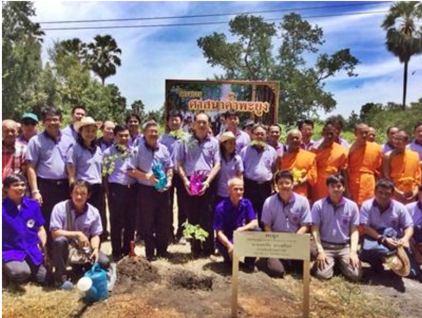
สนับสนุนกล้าไม้ในการปลูกเสริมป่าชุมชน

7. นอกจากชนิดไม้ และกิจกรรมอื่น ๆ ที่รัฐส่งเสริมปลูกนอกจากนี้ยังไม่มีให้นำแนวความคิด วนเกษตรอื่น ๆ มาใช้ จำเป็นที่จะต้องศึกษาหาความต้องการชนิดไม้หรือประโยชน์อื่น ๆ จากป่าไม้ให้ ชัดเจนยิ่งขึ้นตลอดจนการใช้หรือปฏิบัติการในป่าชุมชนเพื่อให้ประโยชน์สูงสุด และยั่งยืน เช่น แนวความคิดวนเกษตรในรูปแบบที่เหมาะสมกับแต่พื้นที่