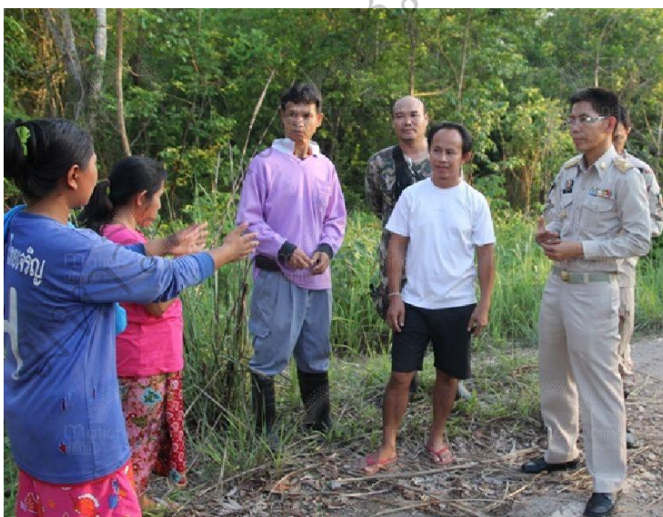
การให้คำปรึกษา และแนะนำในการคุ้มครองป่าชุมชน

1. เจ้าหน้าที่ป่าไม้ ยังขาดข้อมูลพื้นฐานด้านวัฒนธรรม สังคม ประเพณี ความเชื่อที่ เกี่ยวกับป่าไม้ของชาวบ้านในแต่ละพื้นที่ซึ่งแตกต่างกัน ทำให้การดำเนินงาน และการรณรงค์ไม่ได้ผลเท่าที่ควร จึงมีความจำเป็นต้องทำความเข้าใจความสัมพันธ์ของชาวบ้านกับป่าชุมชน เพื่อนำมาปรับปรุงป่าชุมชนทั้งในพื้นที่เดิม และที่จะจัดตั้งต่อไปได้สัมฤทธิ์ผลมากขึ้น