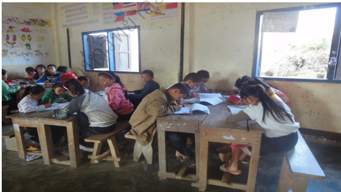
ภาพประกอบ 2 ภาพกิจกรรมการทดสอบความรู้ และความตระหนักในการอนุรักษ์ป่าชุมชนของเยาวชนโรงเรียนชั้นประถมศึกษาปีที่ 5 โรงเรียนบ้านโนนสมบูรณ์ก่อนการอบรม