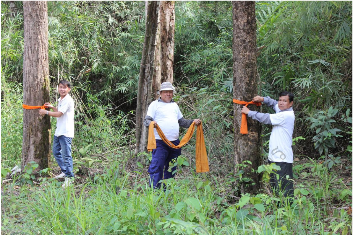
ภาพประกอบ 4 ภาพกิจกรรมบวชต้นไม้ในป่าชุมชนบ้านโนนสมบูรณ์