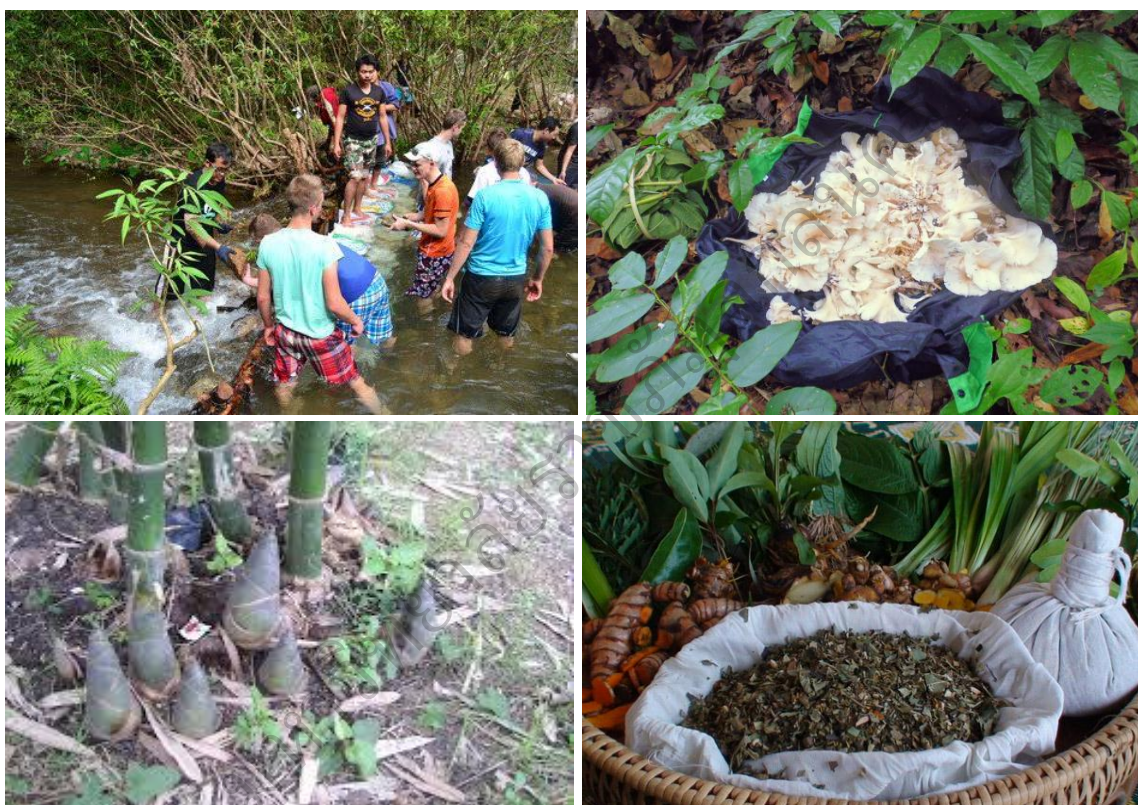
ประโยชน์ที่ได้จากป่าชุมชน

โดยพื้นฐานสังคมชนบทชาวบ้านล้วนอาศัยพึ่งพาป่าเพื่อปัจจัย 4 ซึ่งได้แก่ แหล่งอาหาร ที่อยู่อาศัย ยารักษาโรค และเครื่องนุ่งห่ม ที่มีความสำคัญต่อชีวิตมาเป็นเวลานานแล้ว นอกจากนี้ชาวบ้านยังได้พึ่งพาน้ำที่มีต้นธารจากป่าเพื่อการเกษตร อาศัยผลผลิตจากป่าเป็นรายได้เสริมนอกเหนือจากการทำเกษตรกรรม อีกทั้งป่ายังเป็นแหล่งที่มาของความเชื่อ ประเพณี ซึ่งเป็นรากฐานความสัมพันธ์ของชุมชน บทบาทของป่าต่อความอยู่รอดของชุมชนจึงมีมาเนิ่นนาน และไม่สามารถแยกจากกันได้