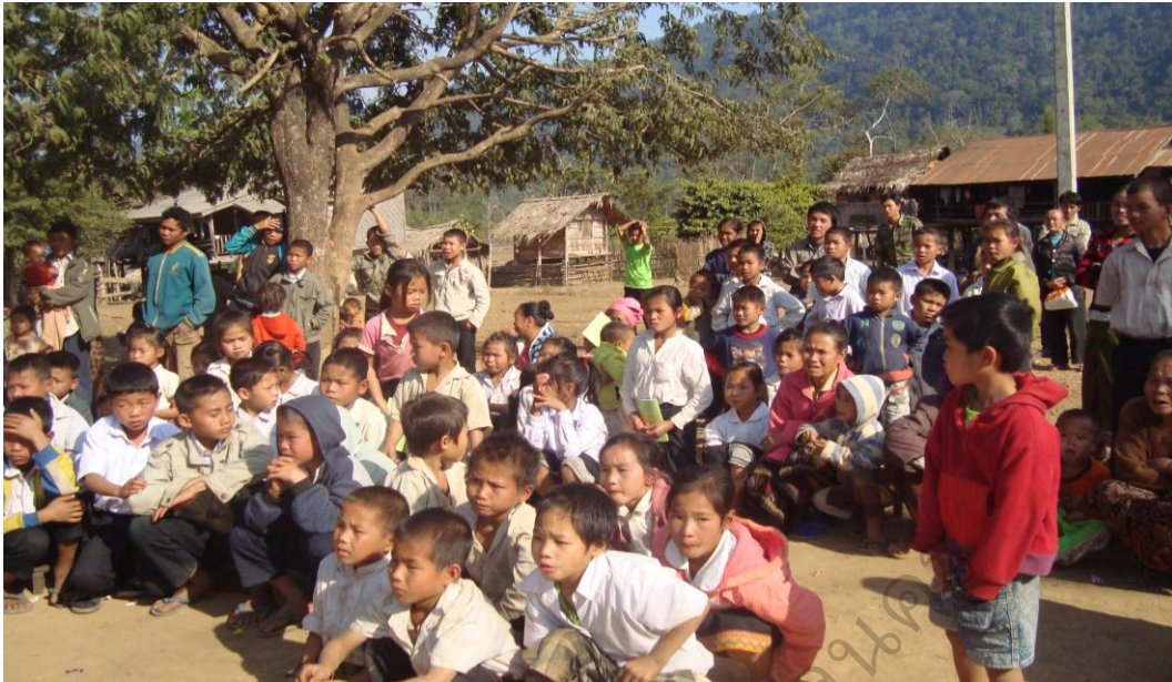
ภาพประกอบ 4 ภาพกิจกรรมอบรมเสริมสร้างความรู้ และความตระหนัก ในการอนุรักษ์ป่าชุมชนให้แก่เยาวชน