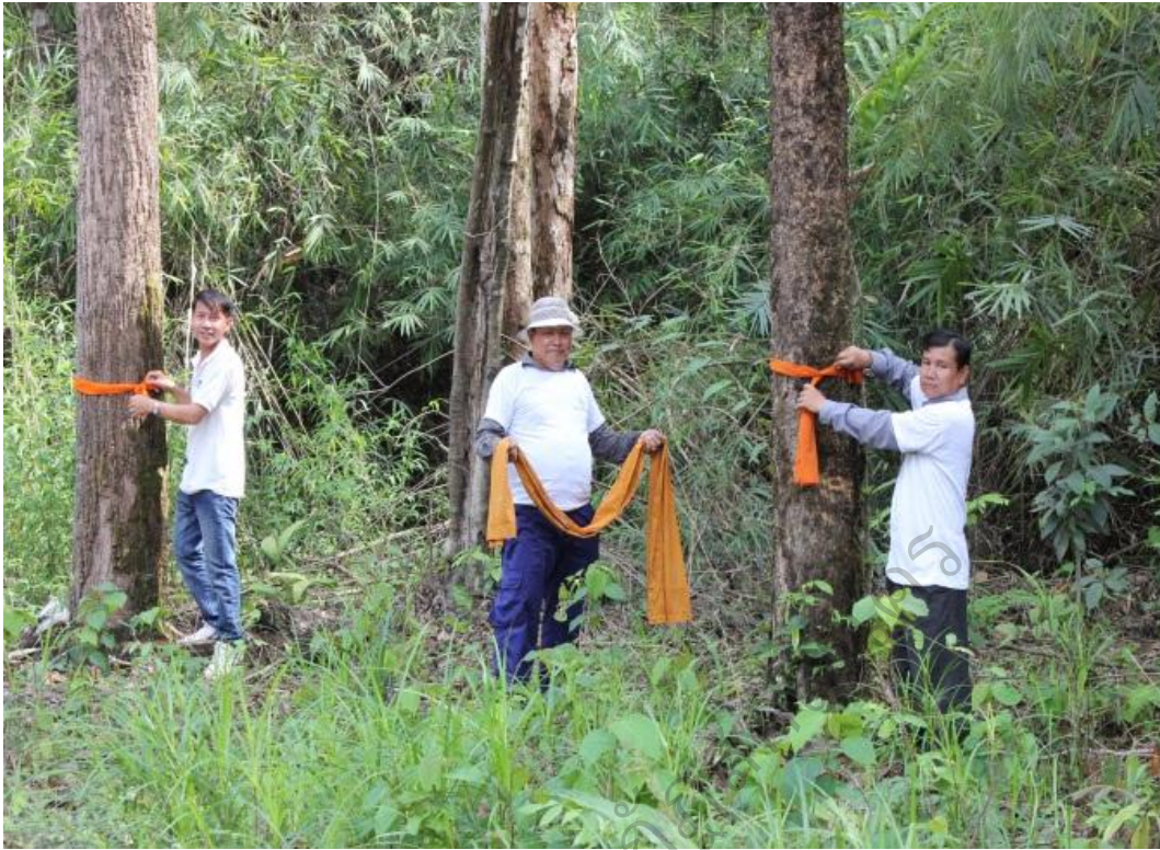
ภาพประกอบ 7 ภาพกิจกรรมบวชต้นไม้ในป่าชุมชนบ้านโนนสมบูรณ์ ที่มา : โรงเรียนประถมบ้านโนนสมบูรณ์ (2558)