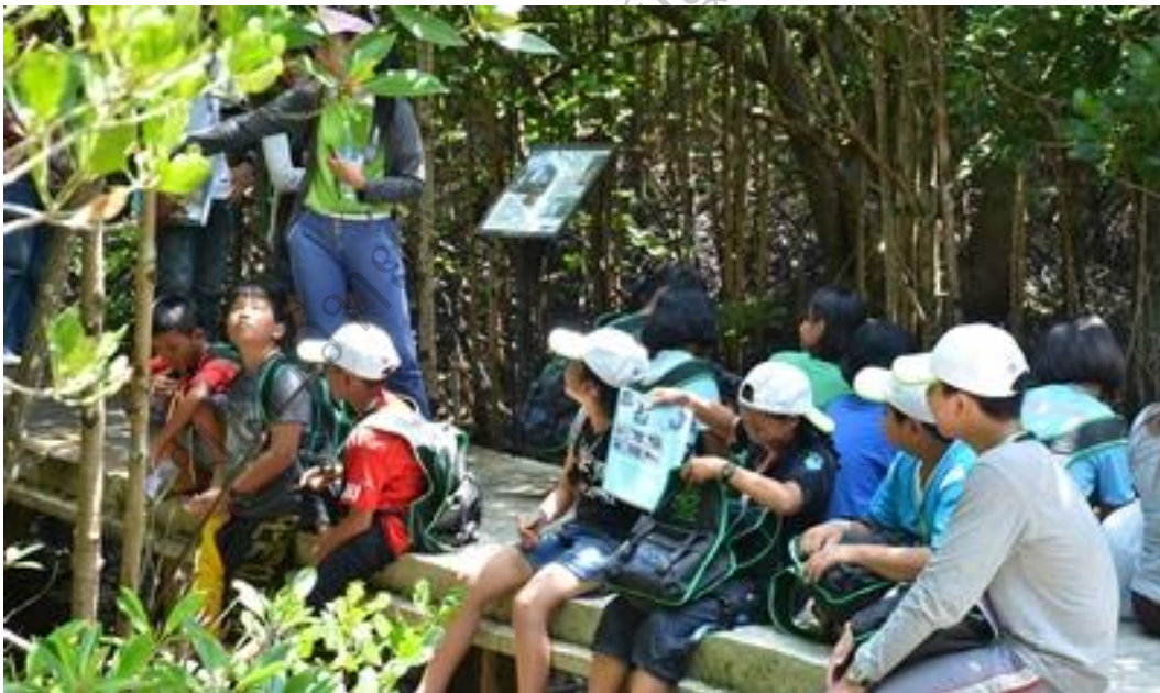
ภาพประกอบ 5 ภาพกิจกรรมค่ายเยาวชนเดินป่าชุมชนบ้านโนนสมบูรณ์