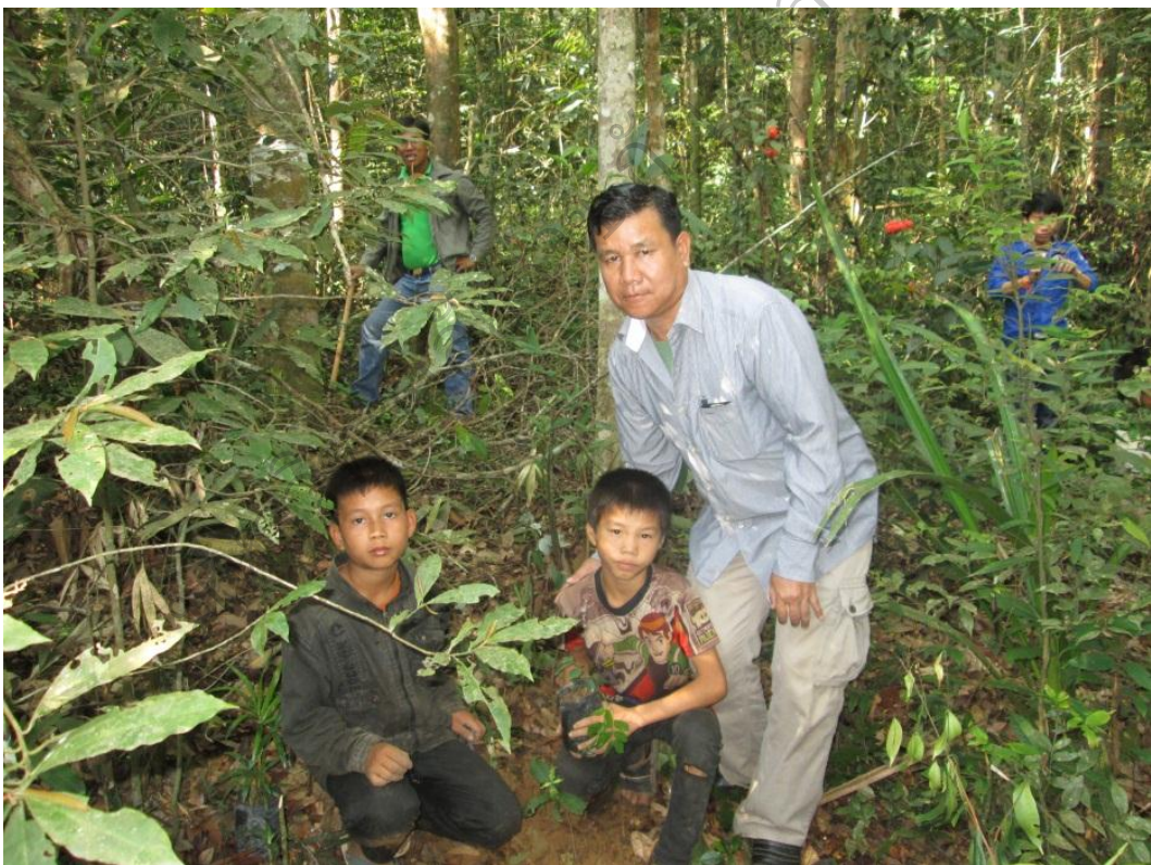
ภาพประกอบ 6 ภาพกิจกรรมปลูกต้นไม้เสริมป่าชุมชนบ้านโนนสมบูรณ์