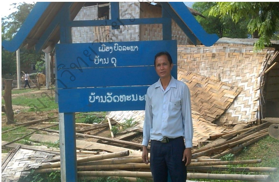
ภาพประกอบ 5 ผู้วิจัยลงพื้นที่บ้านดู่ เมืองบัวละพา สาธารณรัฐประชาธิปไตยประชาชนลาว

ที่มา : ภาพถ่าย เมื่อวันที่ 25 สิงหาคม 2558