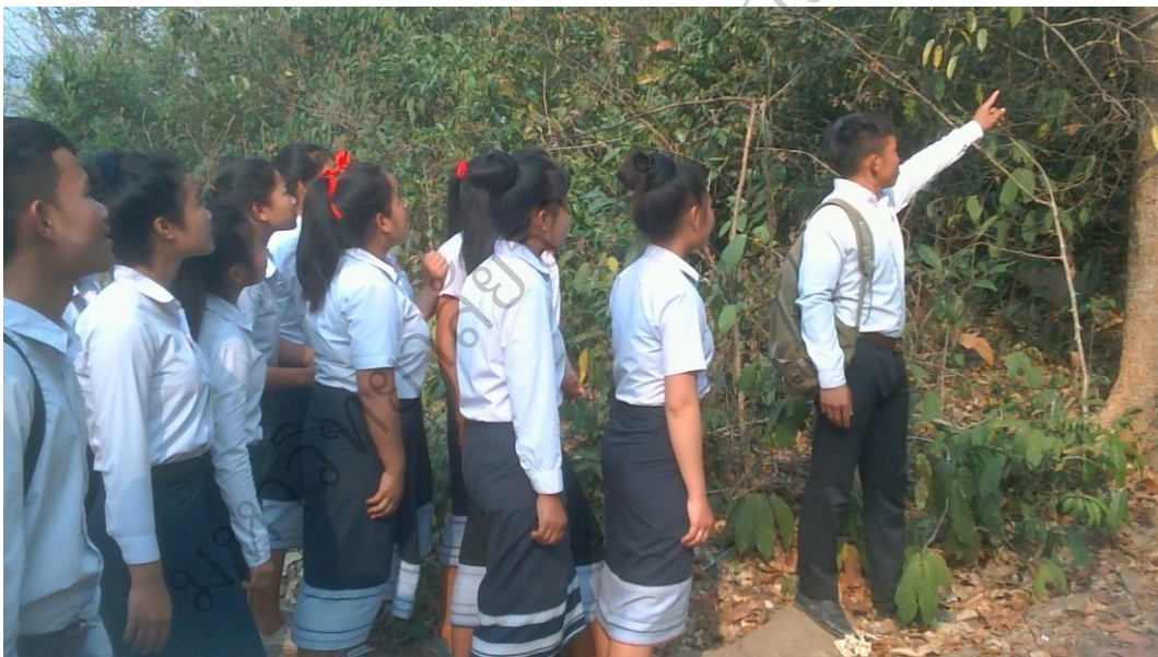
ภาพประกอบ 9 การเข้าร่วมกิจกรรมเดินป่าสงวนแห่งชาติ หินหนามหน่อ ของเยาวชน ชั้นมัธยมปีที่ 1-4 โรงเรียนบ้านดู่ เมืองบัวละพา แขวงคำม่วน เพื่อ การอนุรักษ์ป่าสงวนแห่งชาติ หินหนามหน่อ