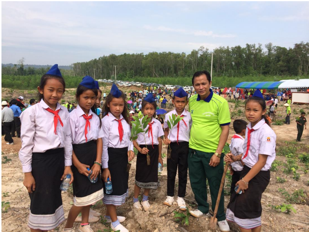
ภาพประกอบ 8 การเข้าร่วมกิจกรรมปลูกป่าของเยาวชน ชั้นมัธยมปีที่ 1-4 โรงเรียนบ้านดู่ เมืองบัวละพา แขวงคำม่วน เพื่อการอนุรักษ์ป่าสงวน แห่งชาติ หินหนามหน่อ ที่มา : โรงเรียนมัธยมบ้านดู่ ปี พ.ศ. 2558

ตาราง 7 ผลการศึกษาความพึงพอใจของเยาวชนต่อการเข้าร่วมกิจกรรมเดินป่าเชิงอนุรักษ์ ของเยาวชนชั้นมัธยม ปีที่ 1-4 โรงเรียนมัธยมบ้านดู่ เมืองบัวละพา แขวงคำม่วน สาธารณรัฐประชาธิปไตยประชาชนลาว