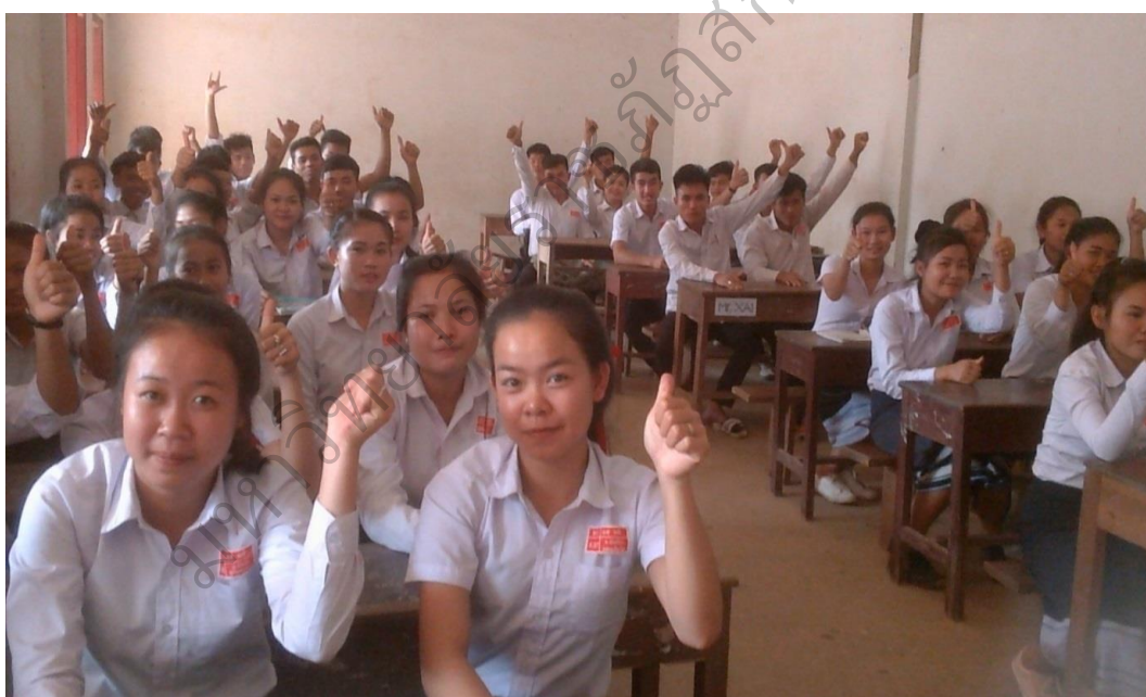
ภาพประกอบ 10 การเข้าร่วมกิจกรรมการอบรมให้ความรู้ด้านกฎหมาย ระเบียบ ข้อบังคับ ของป่าสงวนแห่งชาติ หินหนามหน่อ ของเยาวชน ชั้นมัธยมศึกษาปีที่ 1-4 โรงเรียนบ้านดู่ เมืองบัวสะพา แขวงคำม่วน เพื่อการอนุรักษ์ป่าสงวน แห่งชาติ หินหนามหน่อ ที่มา : โรงเรียนมัธยมบ้านดู่ ปี พ.ศ. 2558