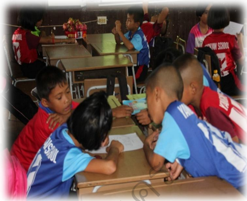
นักเรียนช่วยกันระดมความคิดหาเหตุผลในการตัดสินใจ