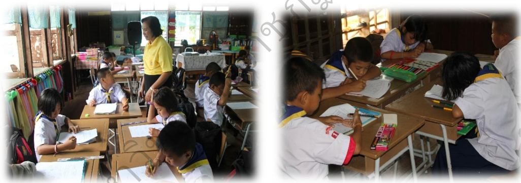
นำเสนอผลงาน