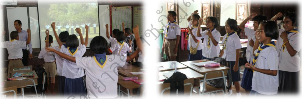
แสดงความคิดเห็นจากกิจกรรมที่ได้ปฏิบัติ