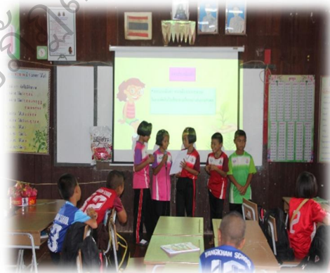
ประเมินผลหลังฝึกอบรม