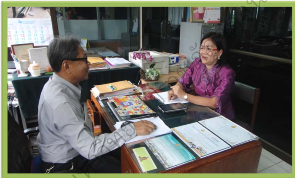
ภาพประกอบที่ 75 สัมภาษณ์ ผู้บริหารและคณะกรรมการสถานศึกษาขั้นพื้นฐาน โรงเรียนมัธยมไย่ยวิทยาาคม