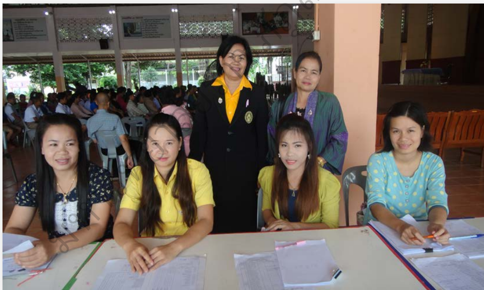
ภาพประกอบที่ 76 สัมภาษณ์ผู้ประกอบการ/สัมภาษณ์คณะครู และสังเกตการณ์ ร่วมกิจกรรมปฐมนิเทศผู้ประกอบการ โรงเรียนมัธยมไย้อยวิทยาาคม