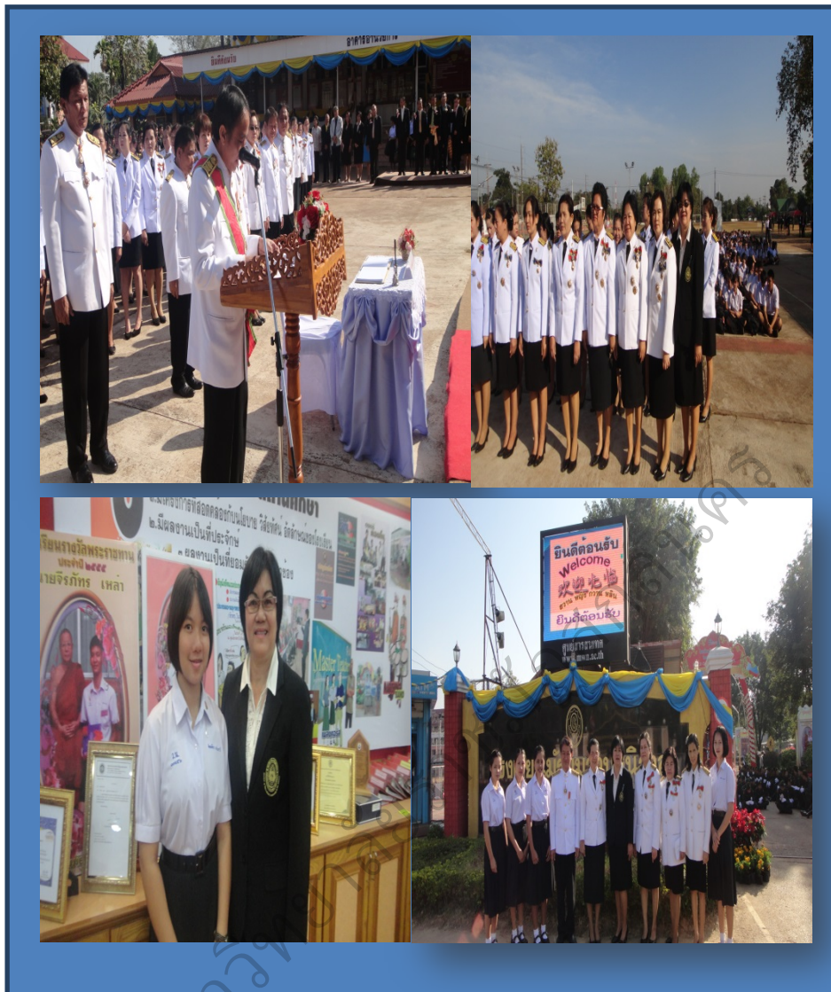
ภาพประกอบที่ 77 ร่วมสังเกตการณ์ ร่วมกิจกรรมการประเมินโรงเรียนพระราชทาน โรงเรียนมัธยมไย้อยวิทยาาคม