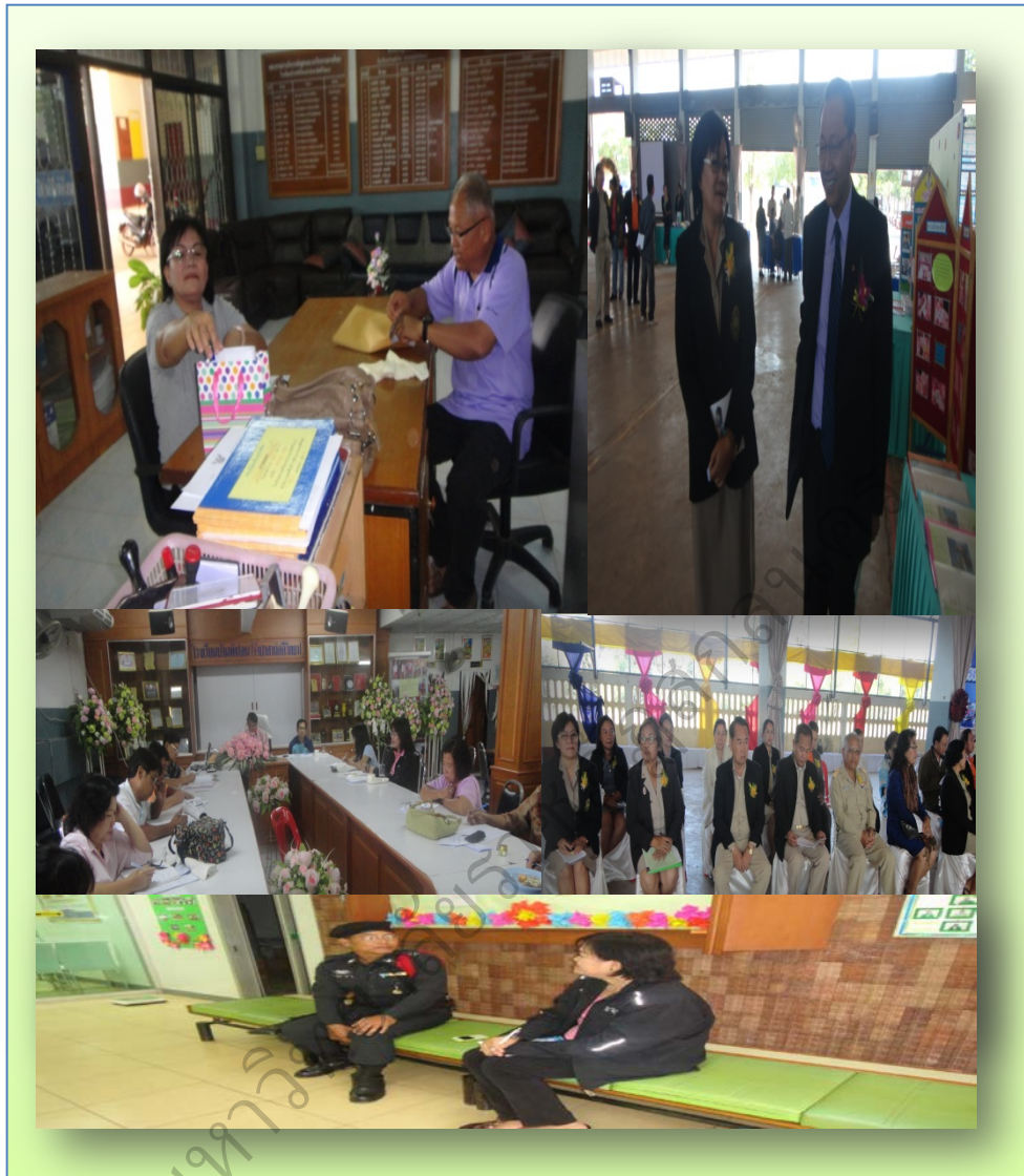
ภาพประกอบที่ 79 เก็บข้อมูลภาคสนาม โรงเรียนบ้านสีลาวดีวิทยา