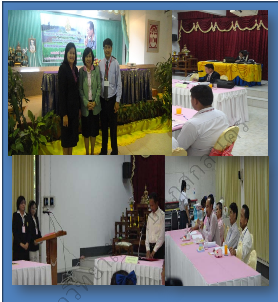
ภาพประกอบที่ 78 สัมภาษณ์ ผู้บริหารและจัดกิจกรรมสนทนากลุ่ม (Focus Group) ร่วมกับโรงเรียนมัธยมภูไทวิทยาคม