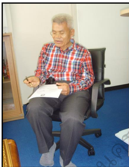
สัมภาษณ์ รศ.ดร.สมาน อัครภูมิ