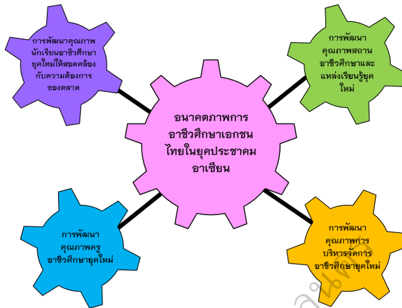
ภาพประกอบ 16 วงล้ออนาคตการอาชีวศึกษาเอกชนไทยในยุคประชาคมอาเซียนระหว่าง พ.ศ. 2558-2567