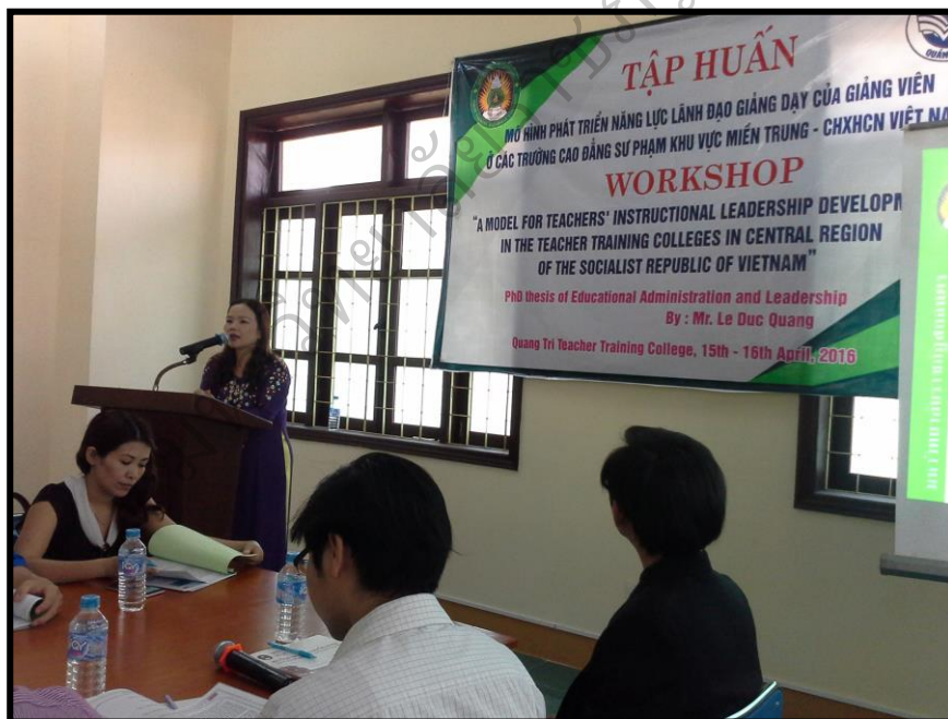
ภาพประกอบ 25 การฝึกอบรมเชิงปฏิบัติการแบบเข้ม ระหว่างวันที่ 15-16 เมษายน 2559 ณ วิทยาลัยครู กวางตรี