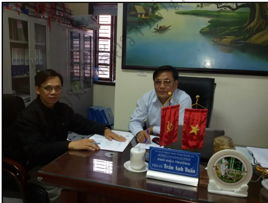
ภาพประกอบ 24 (ต่อ) สัมภาษณ์ผู้เชี่ยวชาญเพื่อตรวจสอบ และยืนยันองค์ประกอบภาวะผู้นำทางวิชาการของครู