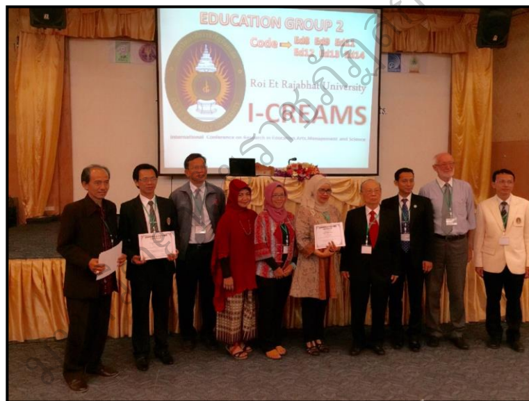
ภาพประกอบ 22 (ต่อ) ผู้วิจัยนำเสนอผลงานวิจัยที่ I-CREAMS, 24 th -25 th November 2015, Roi Et Rajabhat University.