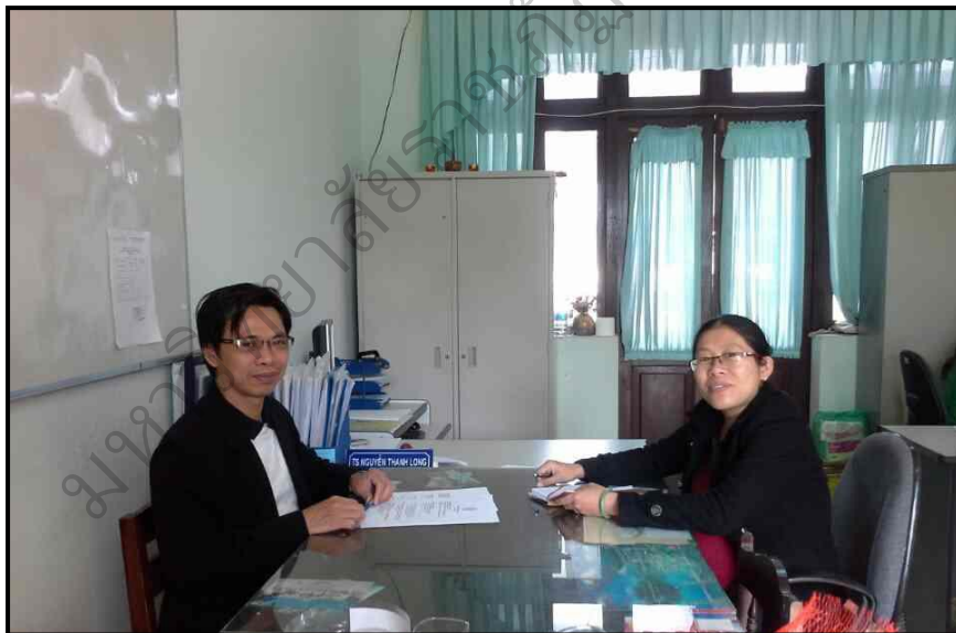
ภาพประกอบ 24 (ต่อ) สัมภาษณ์ผู้เชี่ยวชาญเพื่อตรวจสอบ และยืนยันองค์ประกอบภาวะผู้นำทางวิชาการของครู