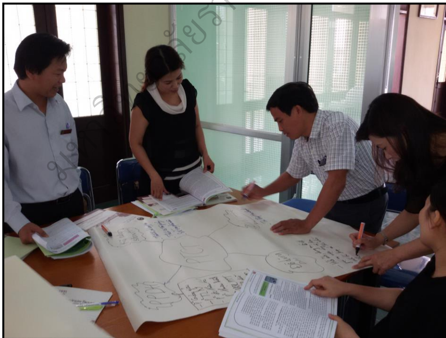
ภาพประกอบ 25 (ต่อ) การฝึกอบรมเชิงปฏิบัติการแบบเข้ม ระหว่างวันที่ 15-16 เมษายน 2559 ณ วิทยาลัยครู กวางตรี