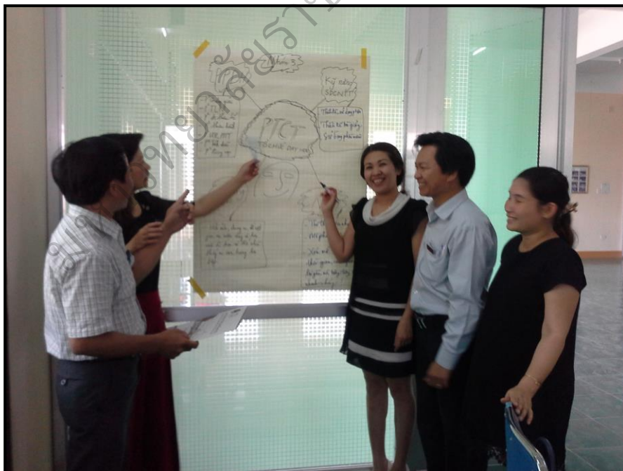
ภาพประกอบ 25 (ต่อ) การฝึกอบรมเชิงปฏิบัติการแบบเข้ม ระหว่างวันที่ 15-16 เมษายน 2559 ณ วิทยาลัยครู กวางตรี