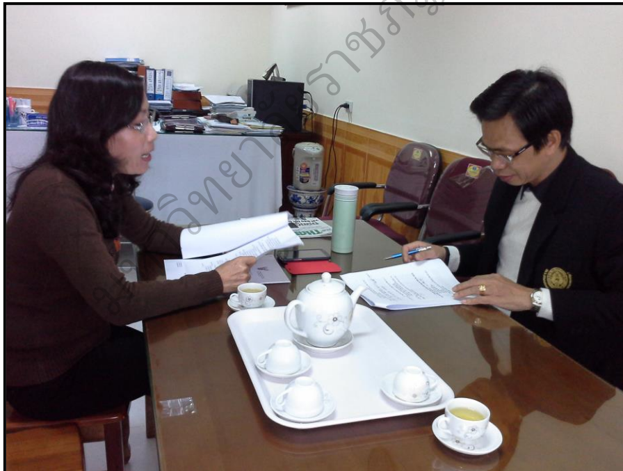
ภาพประกอบ 24 (ต่อ) สัมภาษณ์ผู้เชี่ยวชาญเพื่อตรวจสอบ และยืนยันองค์ประกอบภาวะผู้นำทางวิชาการของครู