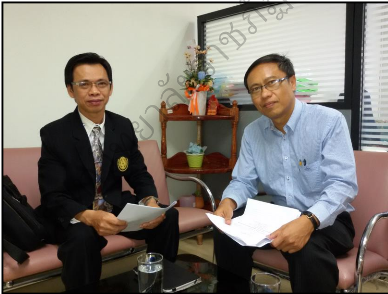
ภาพประกอบ 24 สัมภาษณ์ผู้เชี่ยวชาญเพื่อตรวจสอบ และยืนยันองค์ประกอบภาวะผู้นำทางวิชาการของครู