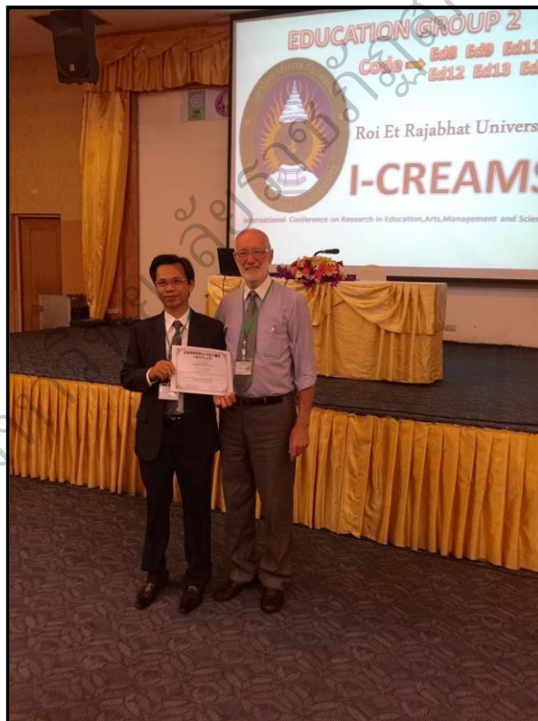
ภาพประกอบ 22 ผู้วิจัยนำเสนองานวิจัยที่ I-CREAMS, 24 th -25 th November 2015, Roi Et Rajabhat University.