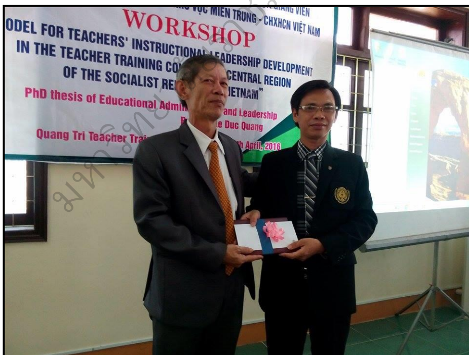
ภาพประกอบ 25 (ต่อ) การฝึกอบรมเชิงปฏิบัติการแบบเข้ม ระหว่างวันที่ 15-16 เมษายน 2559 ณ วิทยาลัยครู กวางตรี