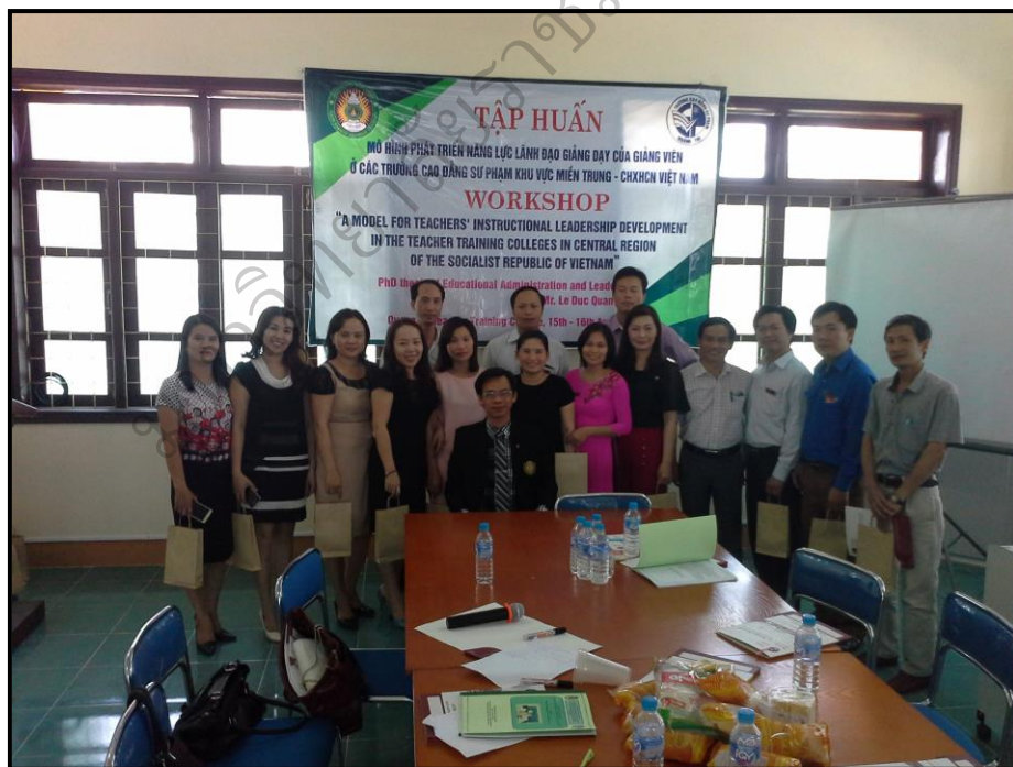
ภาพประกอบ 25 (ต่อ) การฝึกอบรมเชิงปฏิบัติการแบบเข้ม ระหว่างวันที่ 15-16 เมษายน 2559 ณ วิทยาลัยครู กวางตรี