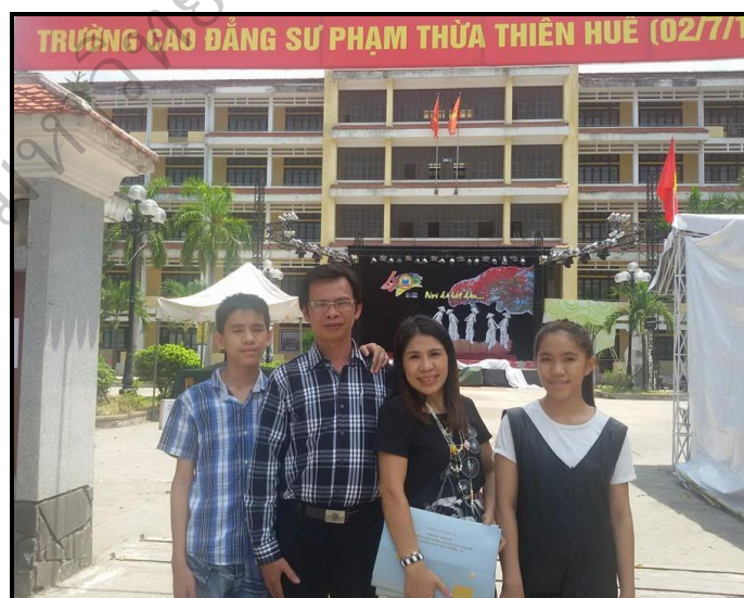
ภาพประกอบ 23 ผู้วิจัยนำเสนอผลงานวิจัย ที่ Thua Thien Hue College of Education-24 th June 2016