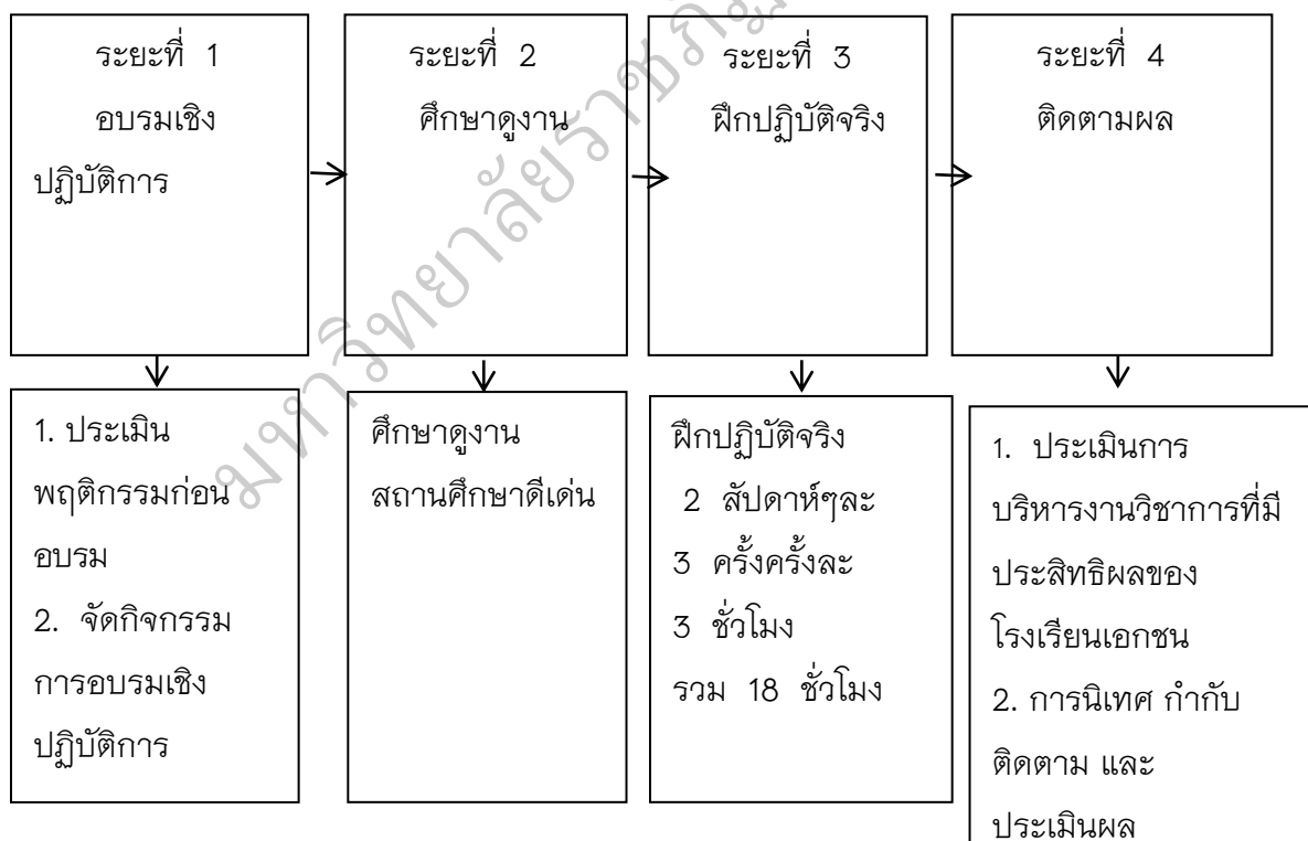
ภาพประกอบ 4 รูปแบบการบริหารงานวิชาการที่มีประสิทธิผลของโรงเรียน

กระบวนการพัฒนารูปแบบการบริหารงานวิชาการที่มีประสิทธิผลของโรงเรียนเอกชนประเภทสามัญศึกษา ดังแสดงได้ในภาพประกอบ 4