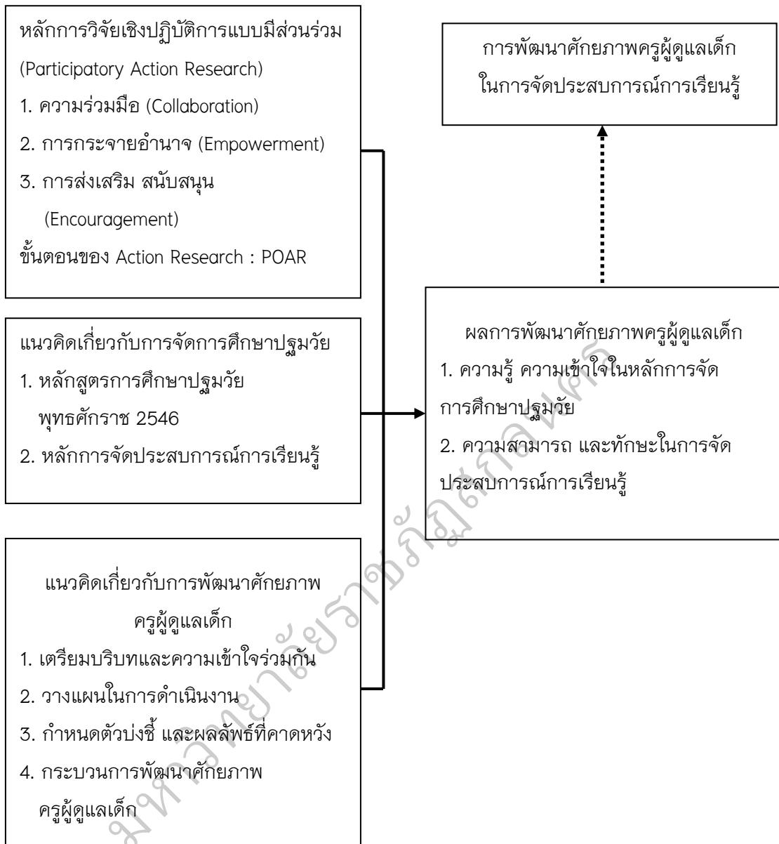
ภาพประกอบ 5 กรอบแนวคิดการวิจัย