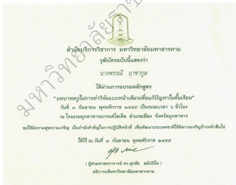
ภาพประกอบ 8 เกียรติบัตรผ่านการอบรมหลักสูตร “บทบาทครูในการทำวิจัยแบบหน้าเดียวเพื่อแก้ปัญหาในชั้นเรียน”