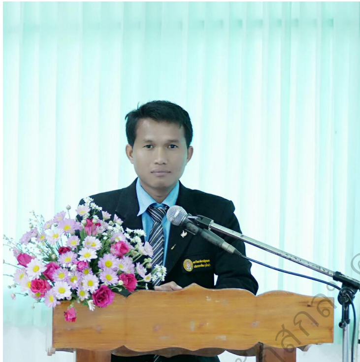
ภาพประกอบ 11 กล่าวรายงานการประชุมเชิงปฏิบัติการการพัฒนาศักยภาพครู ในการทำวิจัยในชั้นเรียน