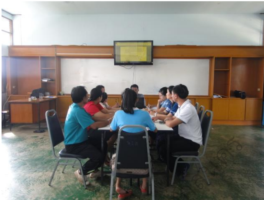
ภาพประกอบ 9 กลุ่มผู้วิจัยประชุมวางแผนการพัฒนาศักยภาพครูในการทำวิจัยในชั้นเรียน