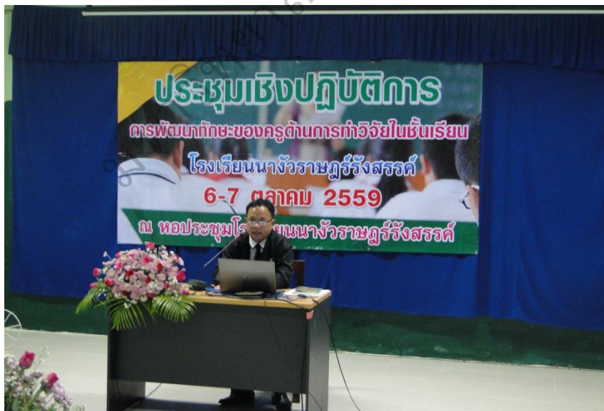
ภาพประกอบ 12 ประธานกล่าวเปิดการประชุมเชิงปฏิบัติการการพัฒนาศักยภาพครู ในการทำวิจัยในชั้นเรียน