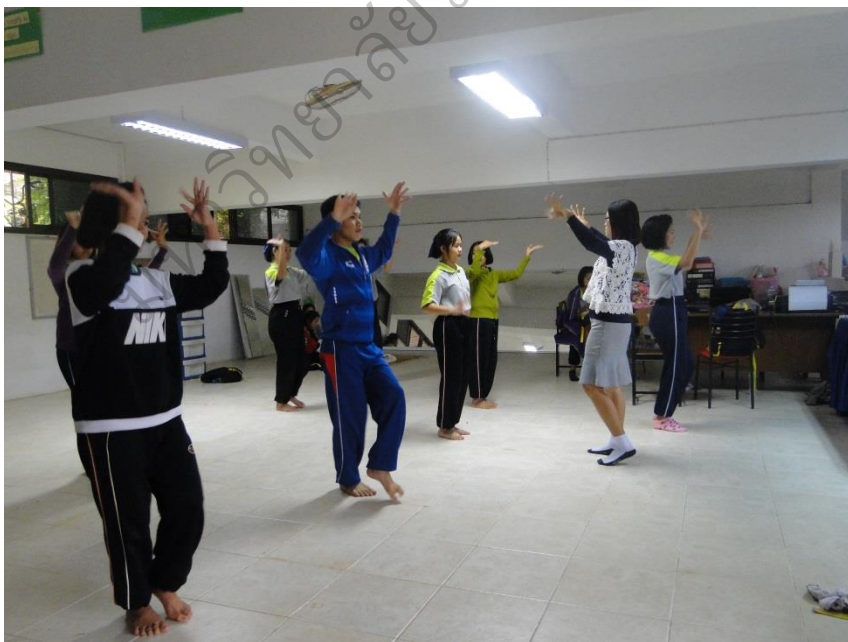
ภาพประกอบ 18 การดำเนินกิจกรรมการจัดการเรียนการสอนรายวิชานาฏศิลป์ ระดับชั้นมัธยมศึกษาปีที่ 2 โรงเรียนนางวราภรณ์รังสรรค์