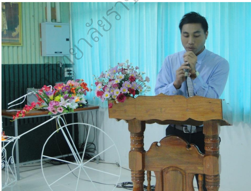
ภาพประกอบ 14 ผู้ร่วมวิจัยซักถามเกี่ยวกับการทำวิจัยในชั้นเรียน