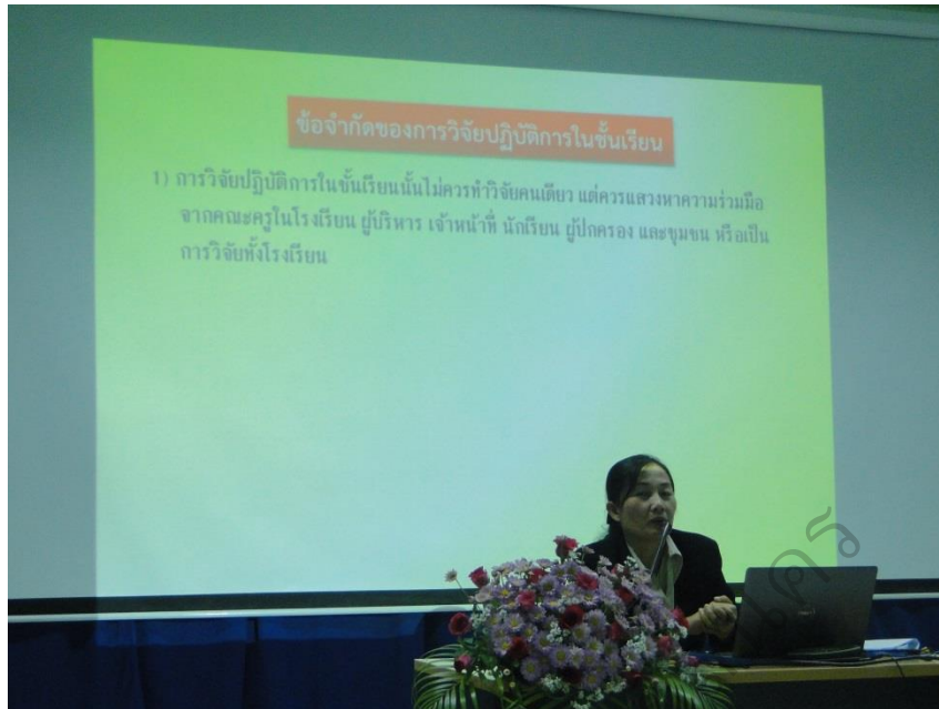
ภาพประกอบ 13 วิชยากรบรรยายเกี่ยวกับการทำวิจัยในชั้นเรียน