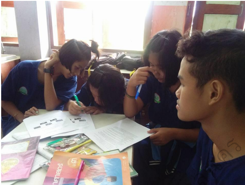
ภาพประกอบ 17 การดำเนินกิจกรรมการจัดการเรียนการสอนรายวิชาวิทยาศาสตร์ ระดับชั้นมัธยมศึกษาปีที่ 3 โรงเรียนนางวราภรณ์รังสรรค์