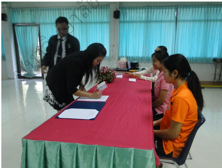
ภาพประกอบ 10 กลุ่มผู้วิจัยลงทะเบียนเข้าร่วมการประชุมเชิงปฏิบัติการ