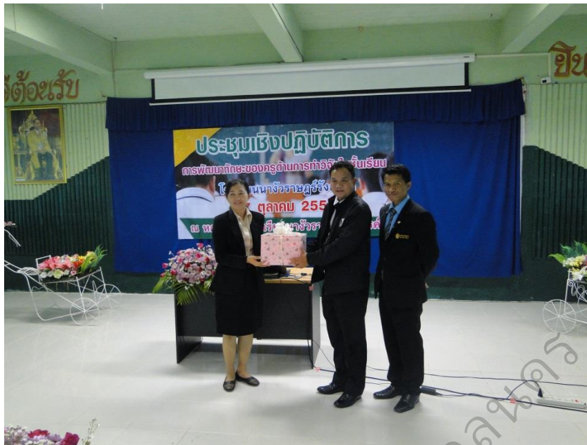
ภาพประกอบ 15 ประธานในพิธีมอบของที่ระลึกแก่วิทยากร