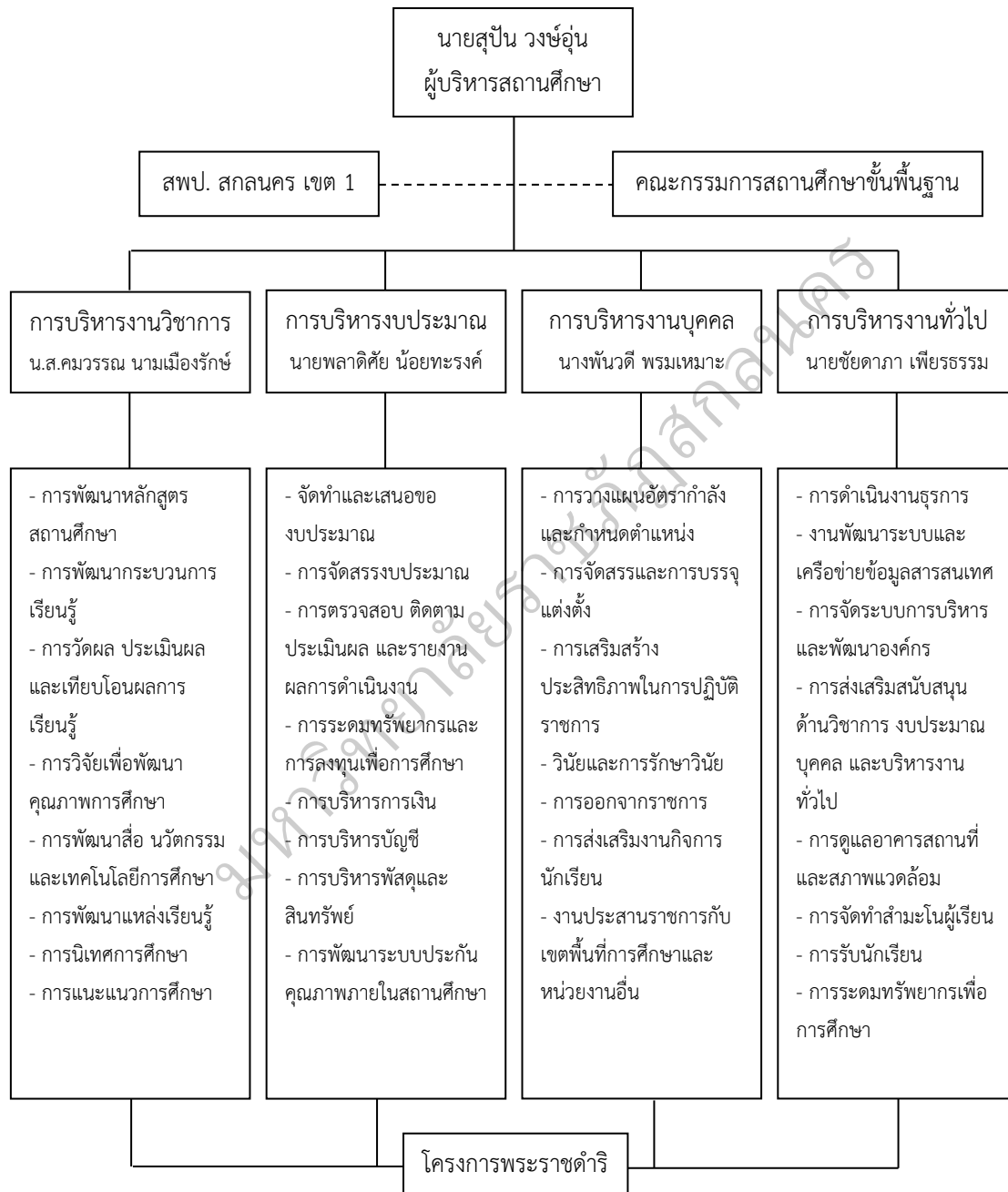
ภาพประกอบ 3 ระบบบริหาร โรงเรียนบ้านจิวศิริราษฎร์บำรุง

โรงเรียนบ้านจิวศิริราษฎร์บำรุง สังกัดสำนักงานเขตพื้นที่การศึกษาประถมศึกษา สกลนคร เขต 1 ปีการศึกษา 2557 กำหนดระบบบริหาร ดังภาพประกอบ 3