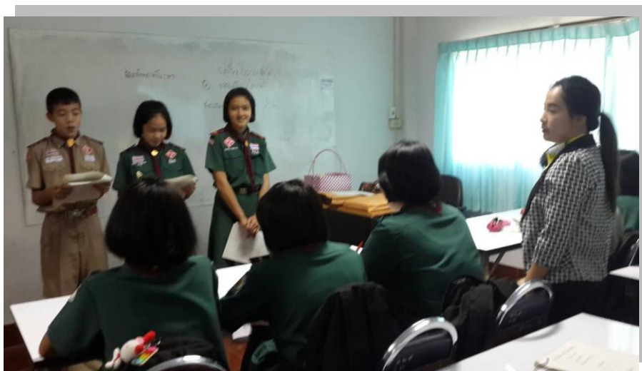
ภาพประกอบ 5 ครูเปิดโอกาสให้เพื่อนตั้งคำถามเพื่อแสดงความคิดเห็นเปรียบเทียบ เหตุผลในแง่มุมต่าง ๆ ที่ใช้ในการอ่านเชิงวิเคราะห์