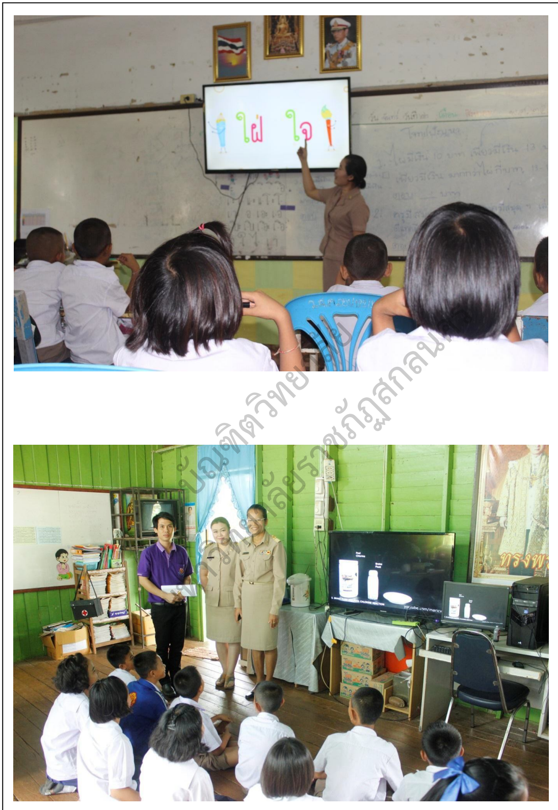
ภาพประกอบ 7 การนำหนังสืออิเล็กทรอนิกส์ไปใช้และการนิเทศภายใน