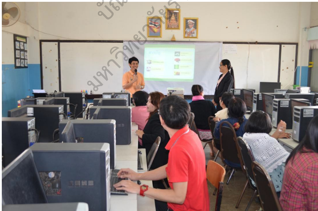
ภาพประกอบ 5 การนำเสนอหนังสืออิเล็กทรอนิกส์