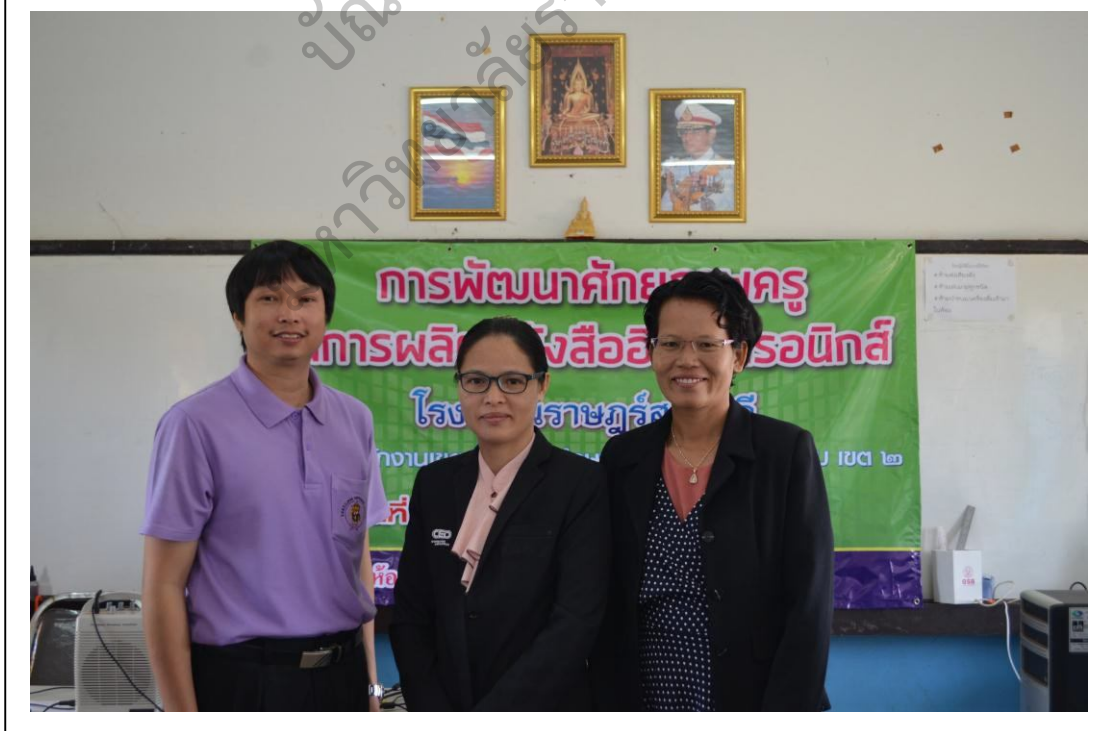
ภาพประกอบ 6 ผู้วิจัย วิทยากร ผู้นิเทศและผู้ร่วมวิจัยถ่ายภาพร่วมกัน