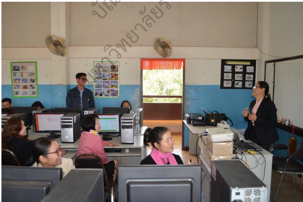
ภาพประกอบ 3 บรรยายการประชุมเชิงปฏิบัติการ