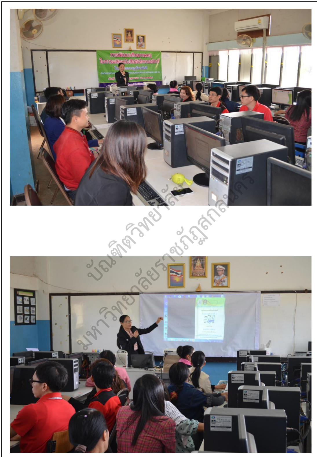
ภาพประกอบ 2 การให้ความรู้ในการใช้โปรแกรมผลิตหนังสืออิเล็กทรอนิกส์