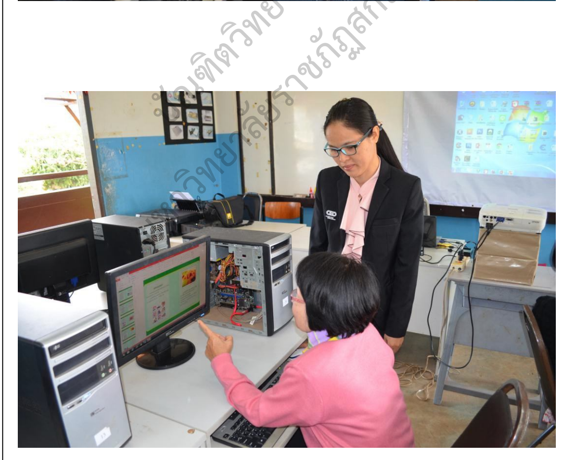
ภาพประกอบ 4 การให้คำแนะนำของวิทยากร