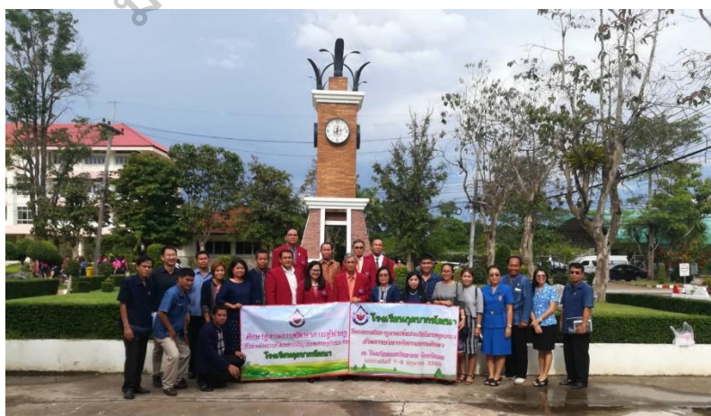
ภาพประกอบ 13 ศึกษาดูงานเพื่อพัฒนาภาวะผู้นำครู เพื่อดำเนินการตามหลักปรัชญาของเศรษฐกิจพอเพียง โรงเรียนเลยพิทยาคม สังกัดสำนักงานเขตพื้นที่การศึกษามัธยมศึกษา เขต 19