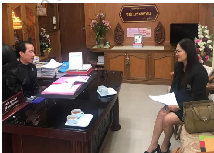
ภาพประกอบ 12 สัมภาษณ์ผู้ทรงคุณวุฒิและผู้เชี่ยวชาญ เพื่อตรวจสอบรูปแบบการพัฒนาภาวะผู้นำครูเพื่อดำเนินการตามหลักปรัชญาของ เศรษฐกิจพอเพียง โรงเรียนมัธยมศึกษา สังกัดสำนักงานศึกษาธิการ ภาค 11