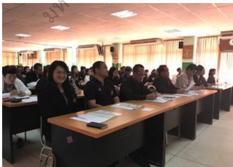
ภาพประกอบ 14 อบรมเชิงปฏิบัติการการพัฒนาภาวะผู้นำครู เพื่อดำเนินการตามหลักปรัชญาของเศรษฐกิจพอเพียง โรงเรียนกุดบากพัฒนาศึกษา สังกัดสำนักงานเขตพื้นที่การศึกษามัธยมศึกษา เขต 23