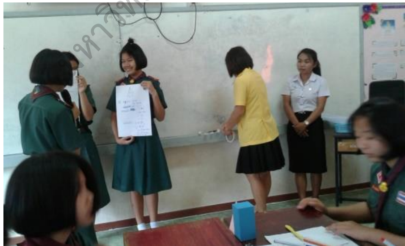
ภาพประกอบ 15 ฝึกปฏิบัติหลังการอบรมเชิงปฏิบัติการ เพื่อดำเนินการ ตามหลักปรัชญาของเศรษฐกิจพอเพียง โรงเรียนนุกุลบาทพัฒนาศึกษา สังกัดสำนักงานเขตพื้นที่การศึกษามัธยมศึกษา เขต 23