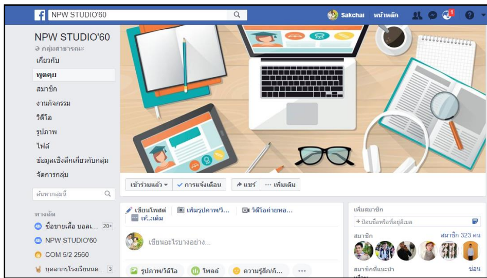
ภาพประกอบ 6 ส่วนของการติดต่อสื่อสารระหว่างครูผู้สอนกับนักเรียนผ่าน Facebook