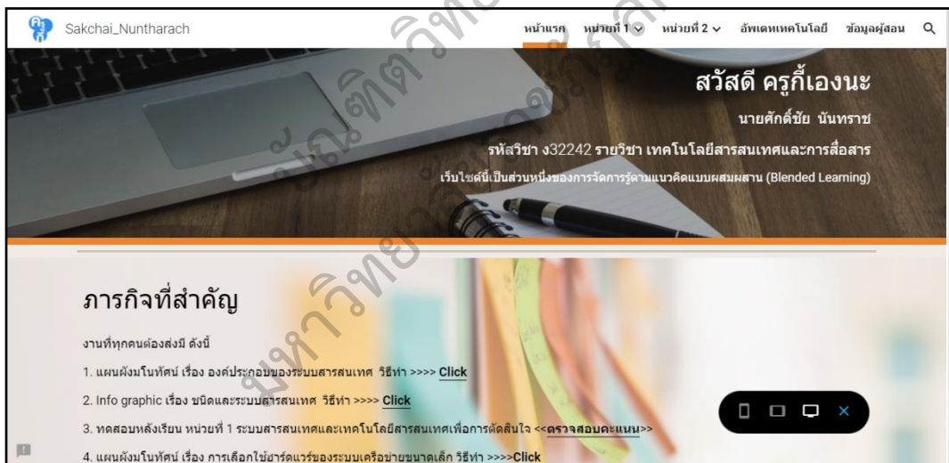
ภาพประกอบ 3 ส่วนของหน้าแรกของเว็บไซต์