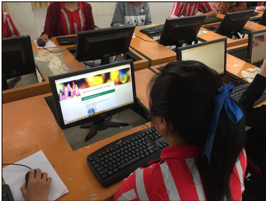
ภาพประกอบ 8 นักเรียนทำแบบทดสอบออนไลน์ผ่านคอมพิวเตอร์