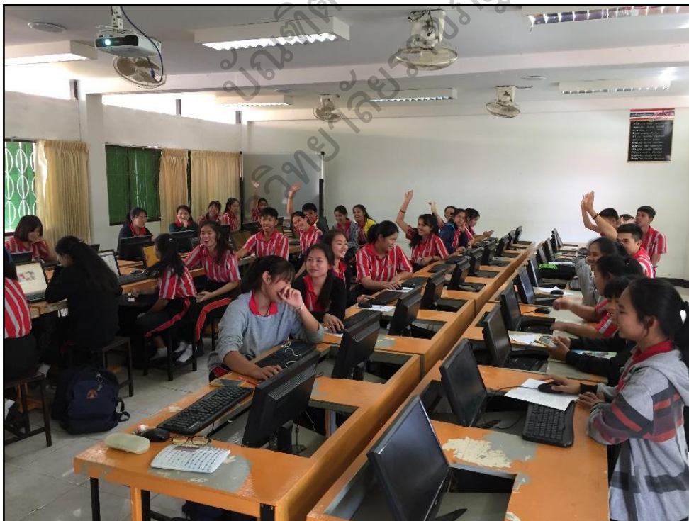
ภาพประกอบ 11 ผู้เรียนมีความกระตือรือร้นในการเรียนมากขึ้น