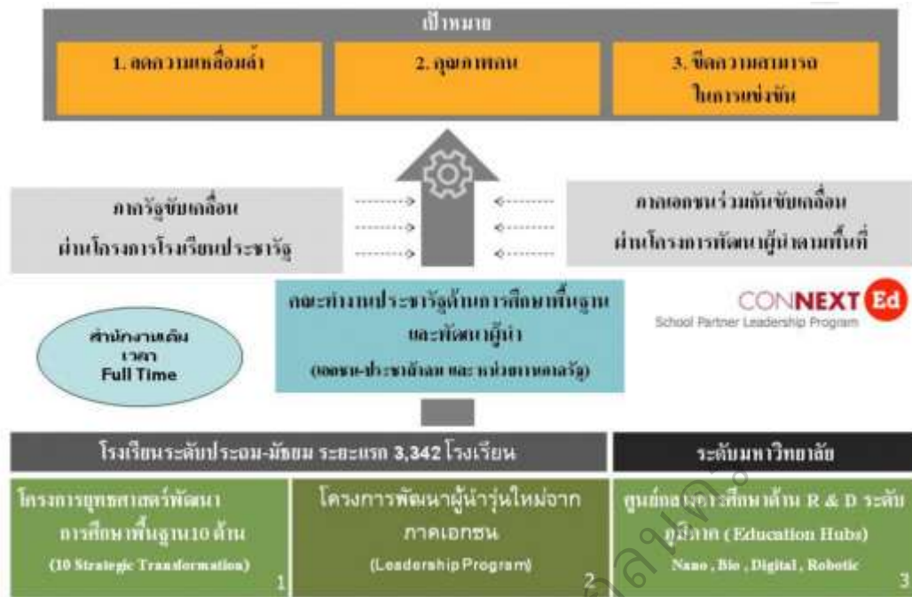
ภาพประกอบ 2 เป้าหมายของโรงเรียนประชารัฐ (สพฐ,2559: หน้า 3)