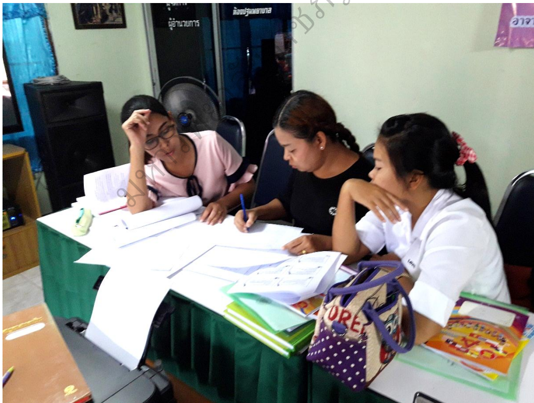
ภาพประกอบ 6 คณะครูร่วมประชุมเชิงปฏิบัติการการพัฒนาศักยภาพครู ในการจัดประสบการณ์เรียนรู้แบบบูรณาการของเด็กปฐมวัย