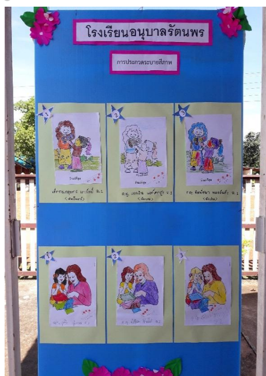
ภาพประกอบ 11 ผลสำเร็จของการจัดประสบการณ์เรียนรู้แบบบูรณาการ