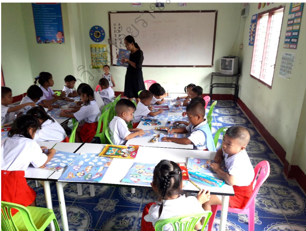
ภาพประกอบ 10 การจัดประสบการณ์เรียนรู้แบบบูรณาการของครู