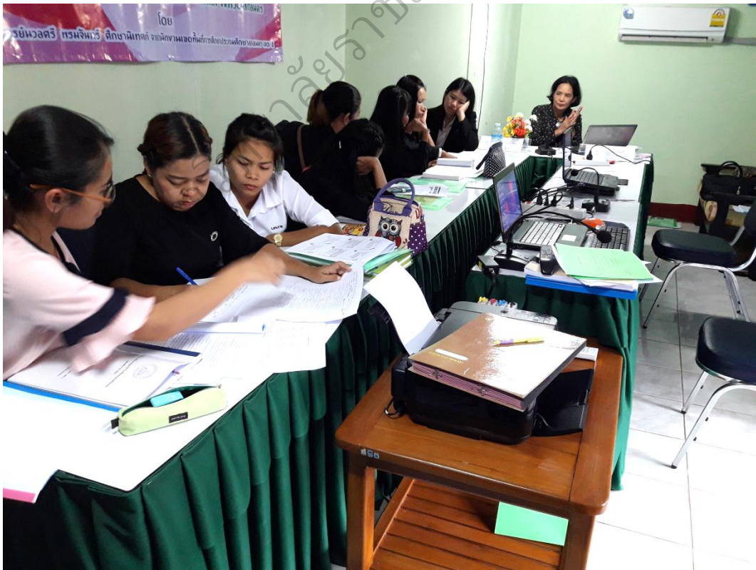
ภาพประกอบ 7 การฝึกปฏิบัติการเขียนแผนจัดประสบการณ์เรียนรู้แบบบูรณาการ