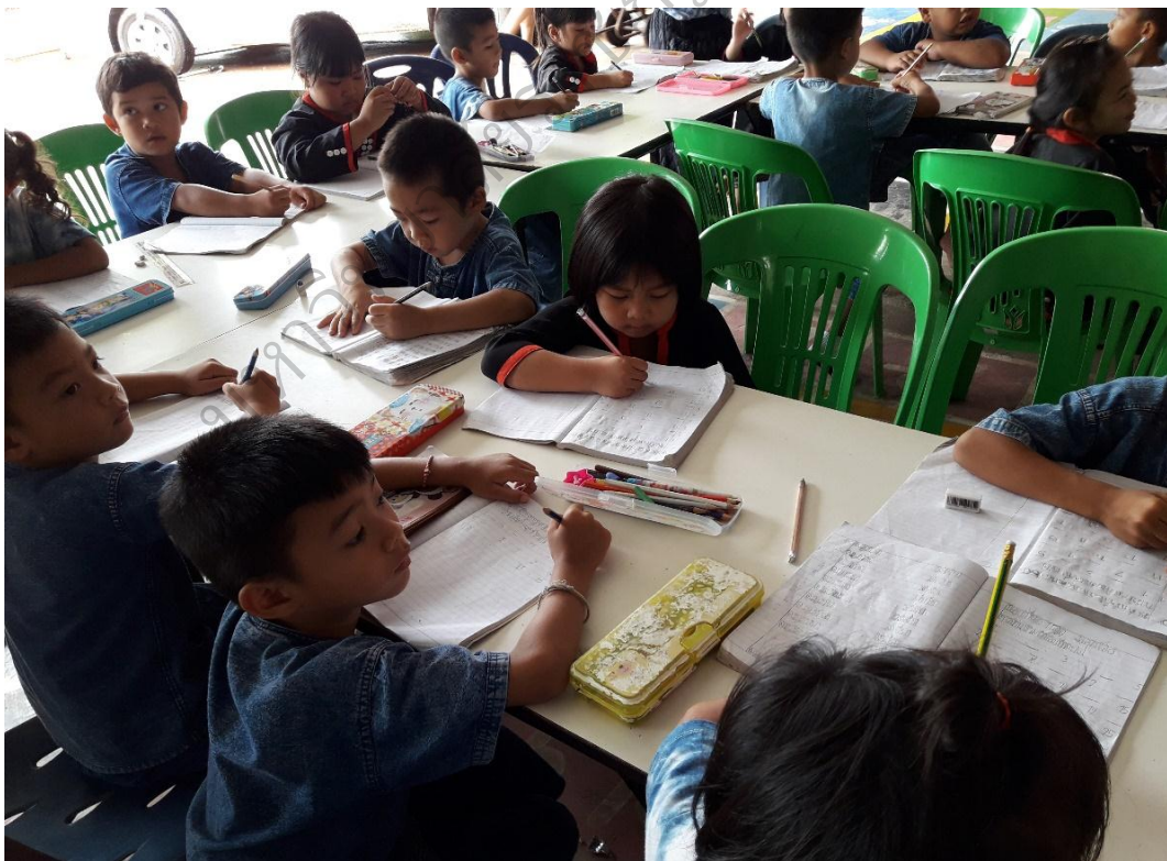
ภาพประกอบ 8 การศึกษาดูงานโรงเรียนอนุบาลจรูญลักษณ์ อำเภอเต่างอย จังหวัดสกลนคร