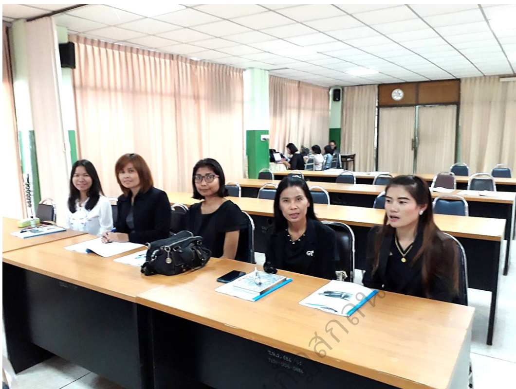
ภาพประกอบ 3 หัวหน้ากลุ่มสาระการเรียนรู้เข้าร่วมศึกษาดูงานที่โรงเรียนธาตุนารายณ์วิทยา