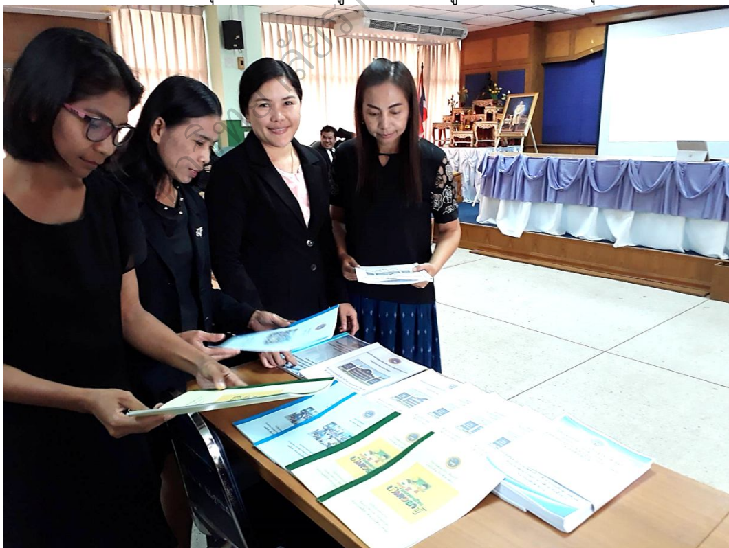
ภาพประกอบ 4 หัวหน้ากลุ่มสาระฯศึกษาเอกสารที่เกี่ยวข้องกับการจัดการเรียนรู้แบบบูรณาการ