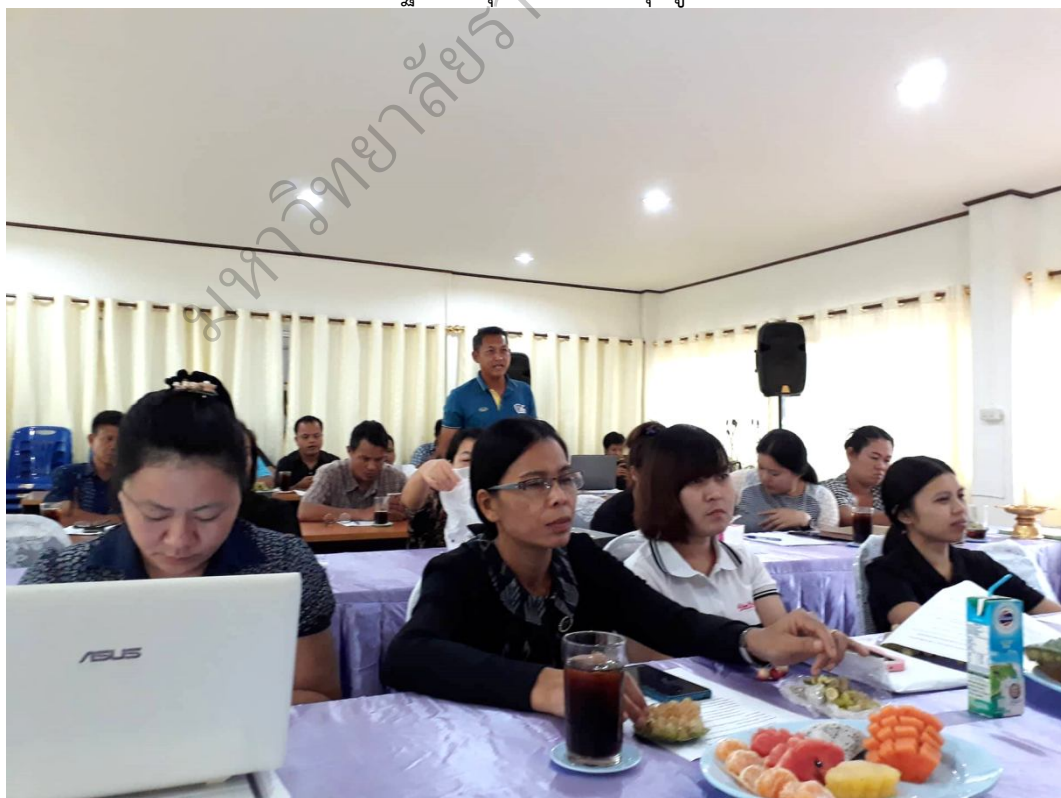
ภาพประกอบ 8 ผู้ร่วมวิจัยซักถามข้อสงสัยการจัดการเรียนรู้แบบบูรณาการ