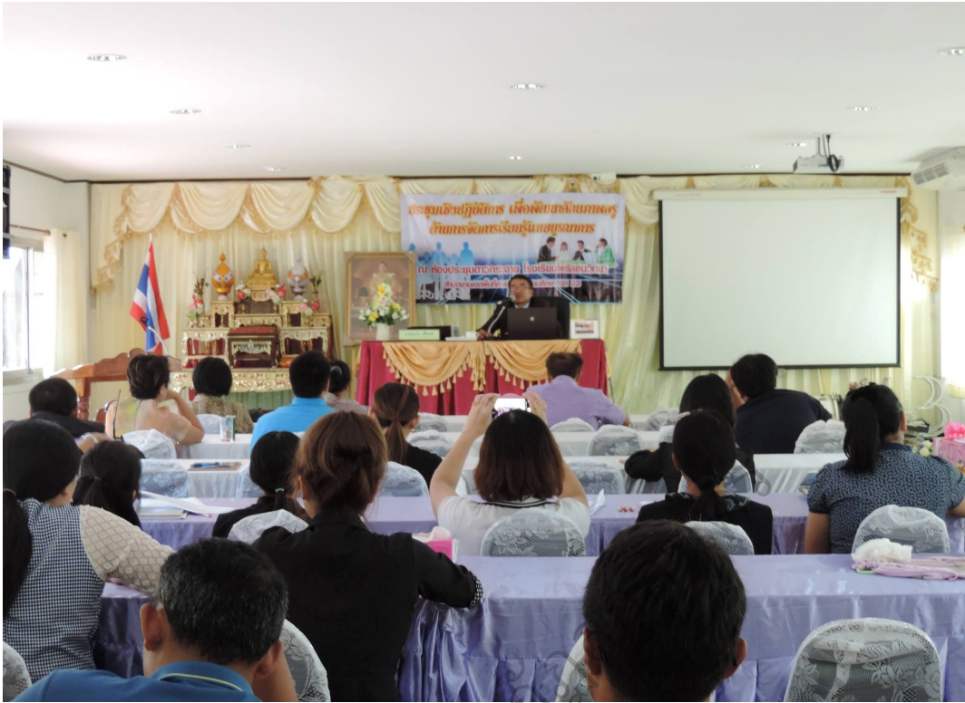
ภาพประกอบ 5 พิธีเปิดการประชุมเชิงปฏิบัติการ ระหว่าง 5 มิ.ย. 2560 – 6 มิ.ย. 2560