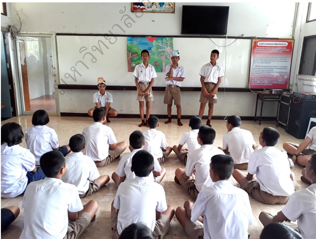
ภาพประกอบ 12 บรรยายภาคห้องเรียนขณะที่จัดการเรียนการสอนแบบบูรณาการ