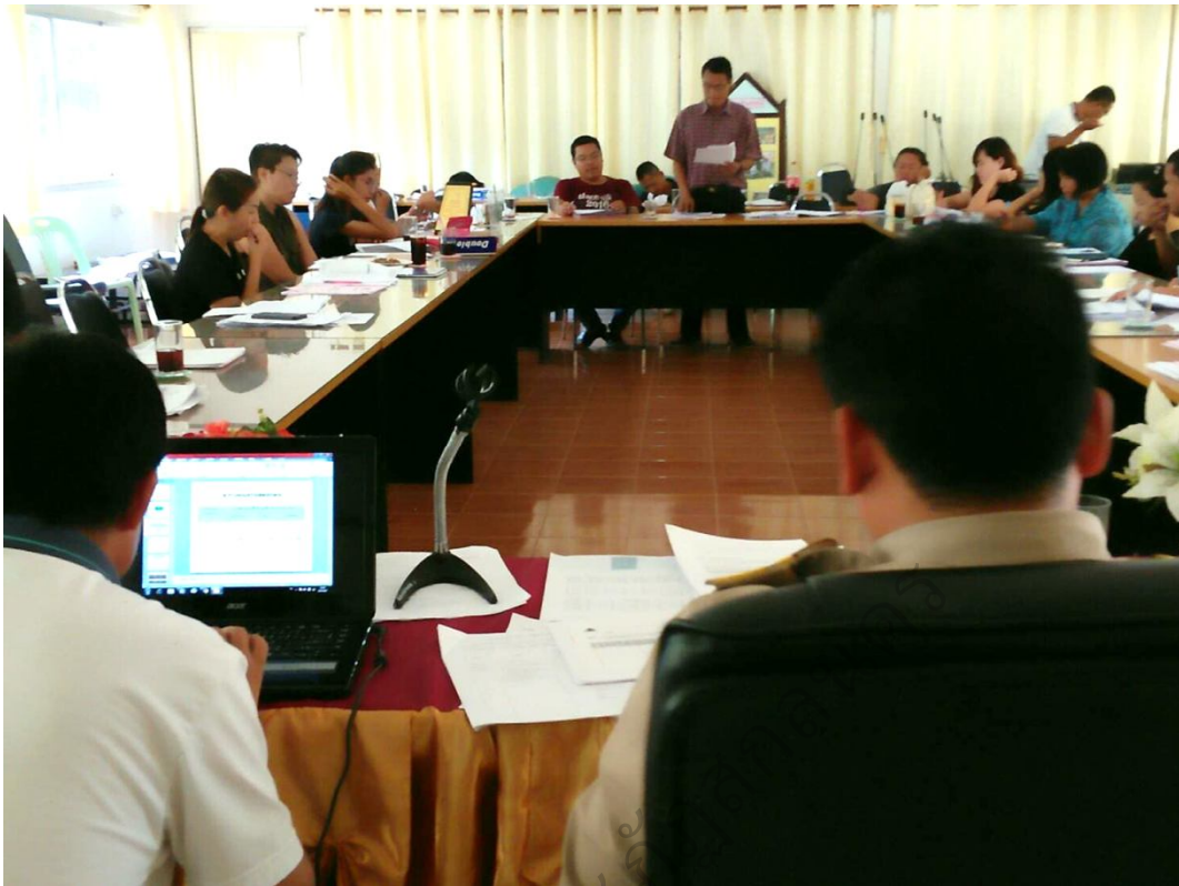
ภาพประกอบ 11 สรุปผลและปิดการประชุมเชิงปฏิบัติการ