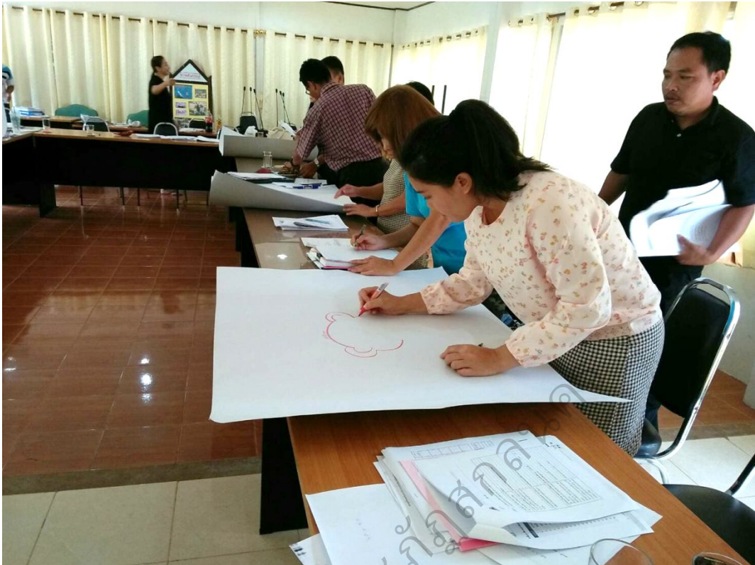
ภาพประกอบ 9 กลุ่มผู้ร่วมวิจัยฝึกปฏิบัติการจัดการเรียนรู้แบบบูรณาการ