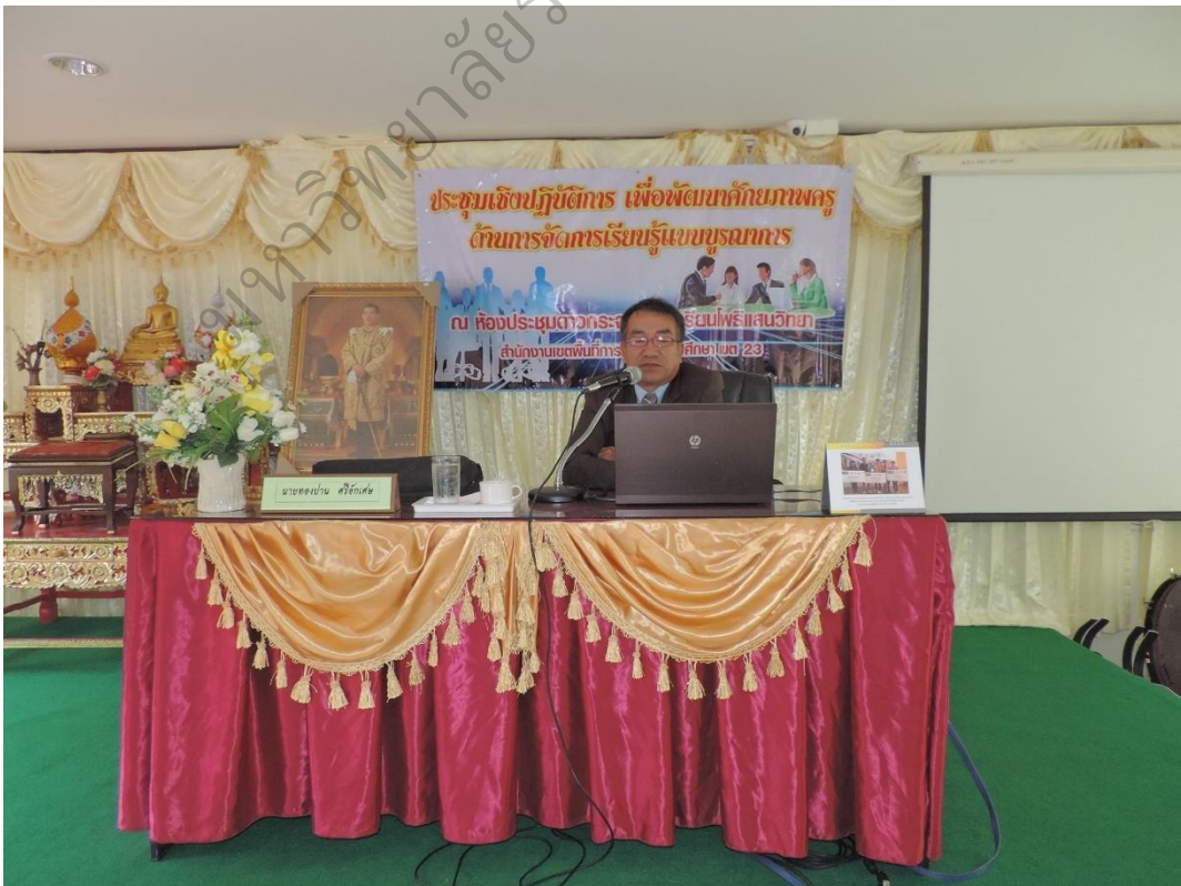
ภาพประกอบ 6 วิทยากรให้ความรู้เกี่ยวกับการจัดการเรียนรู้แบบบูรณาการ