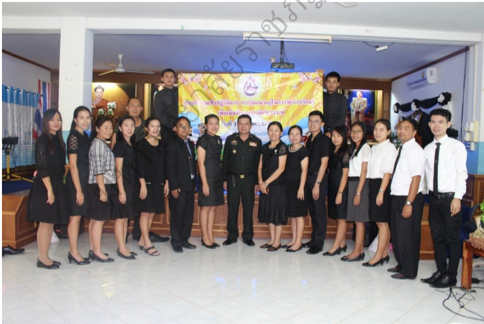
ภาพประกอบ 11 พิธีปิดการประชุมเชิงปฏิบัติการการพัฒนาครูในการจัดการเรียนรู้ ที่เน้นทักษะการคิดวิเคราะห์