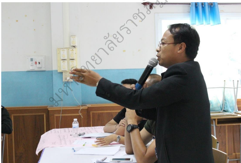
ภาพประกอบ 10 ผู้เข้าร่วมประชุมซักถามข้อสงสัยและวิทยากรให้คำชี้แนะ