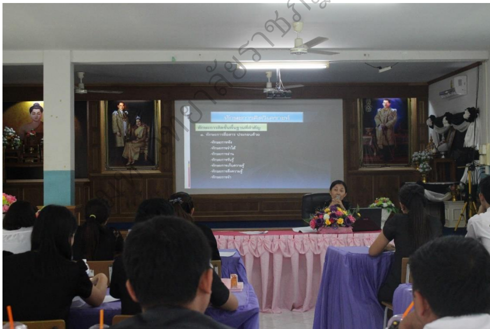
ภาพประกอบ 5 วิทยากร บรรยายเพื่อสร้างความรู้ความเข้าใจเกี่ยวกับการจัดการเรียนรู้ ที่เน้นทักษะการคิดวิเคราะห์