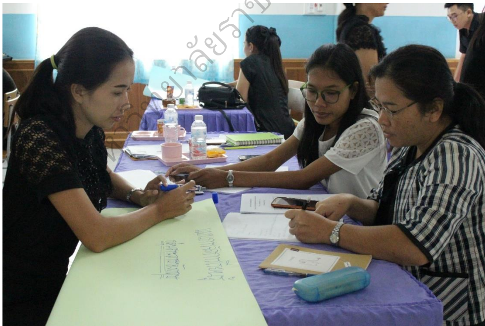
ภาพประกอบ 6 ผู้เข้าร่วมประชุมร่วมกันเขียนแผนการจัดการเรียนรู้ ตามกลุ่มสาระการเรียนรู้