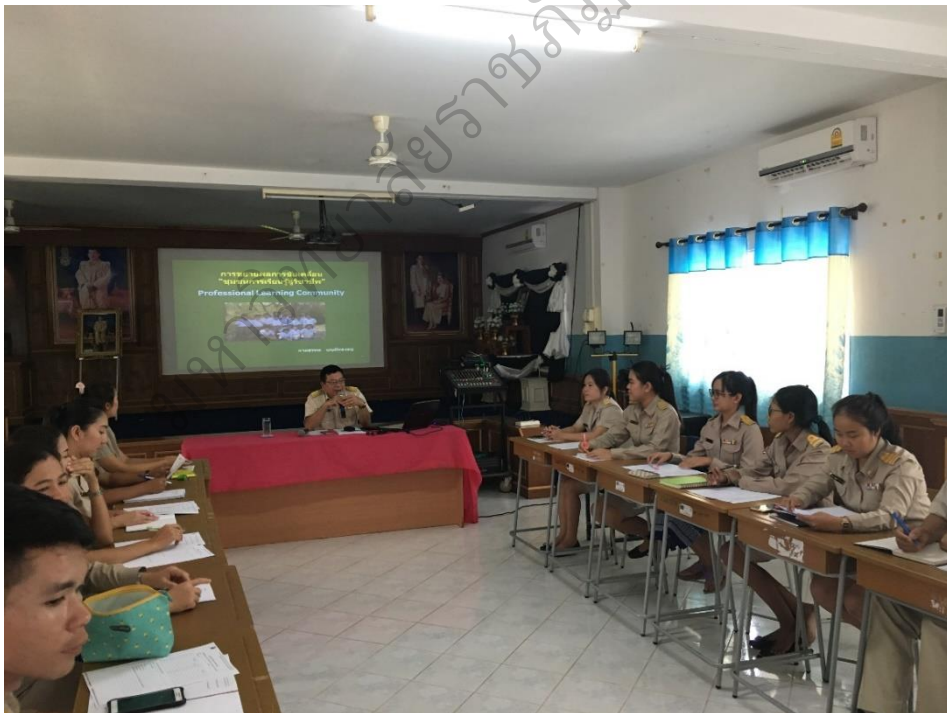
ภาพประกอบ 2 การประชุมครูเพื่อปรึกษาปัญหาเกี่ยวกับการจัดการเรียนรู้ และหาแนวทางพัฒนา