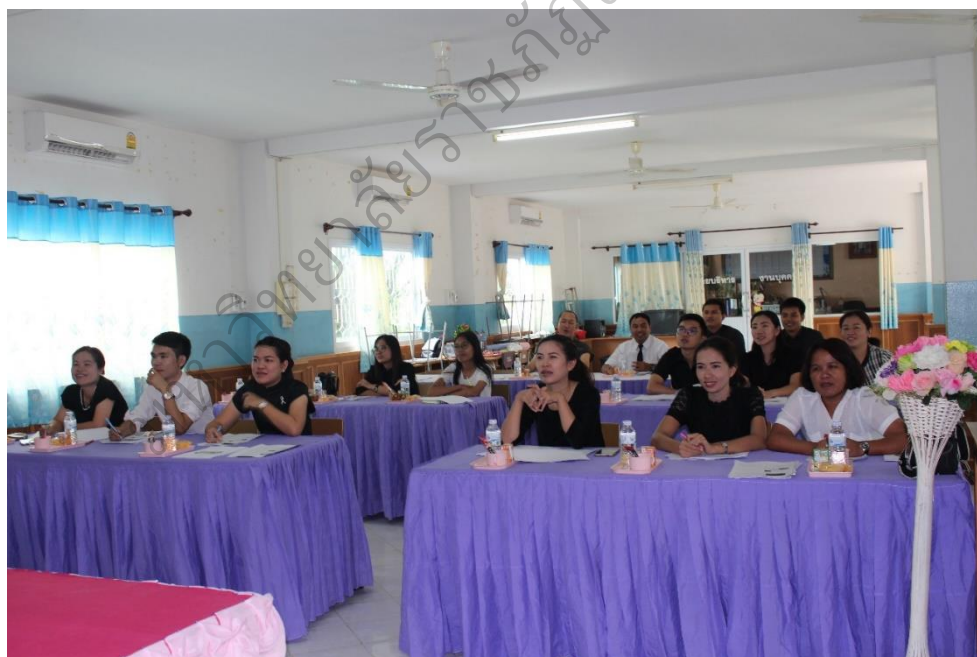
ภาพประกอบ 4 การประชุมเชิงปฏิบัติการการพัฒนาครูในการจัดการเรียนรู้ ที่เน้นทักษะการคิดวิเคราะห์