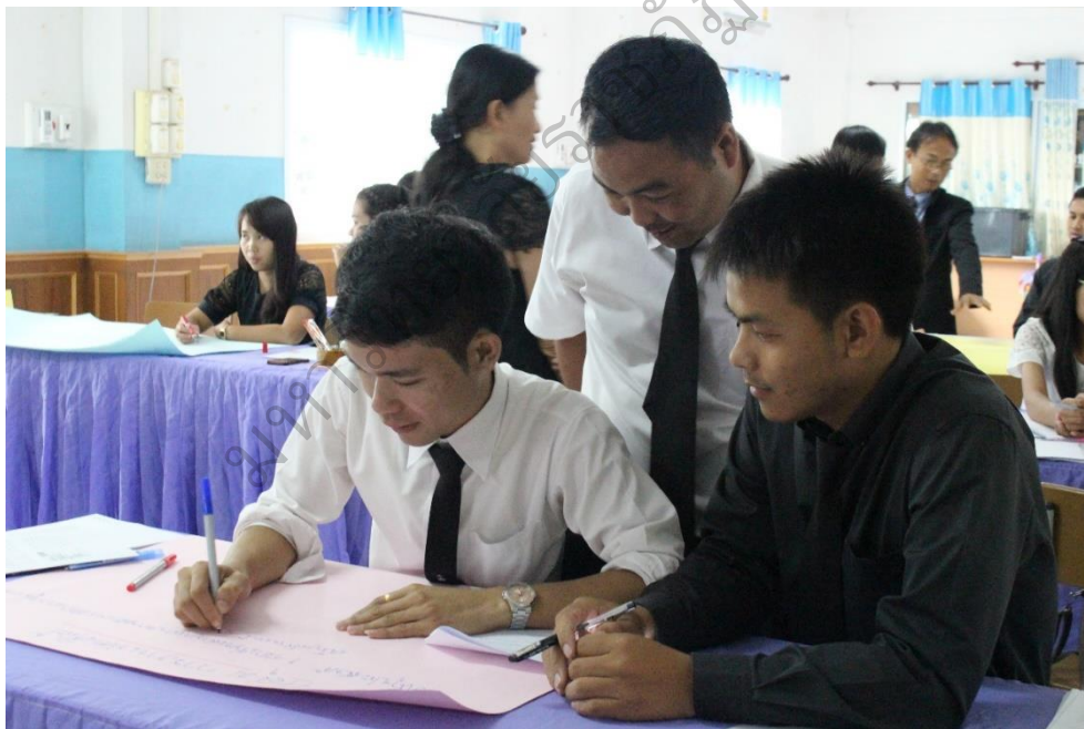
ภาพประกอบ 7 ผู้เข้าร่วมประชุมร่วมกันเขียนแผนการจัดการเรียนรู้ ตามกลุ่มสาระการเรียนรู้