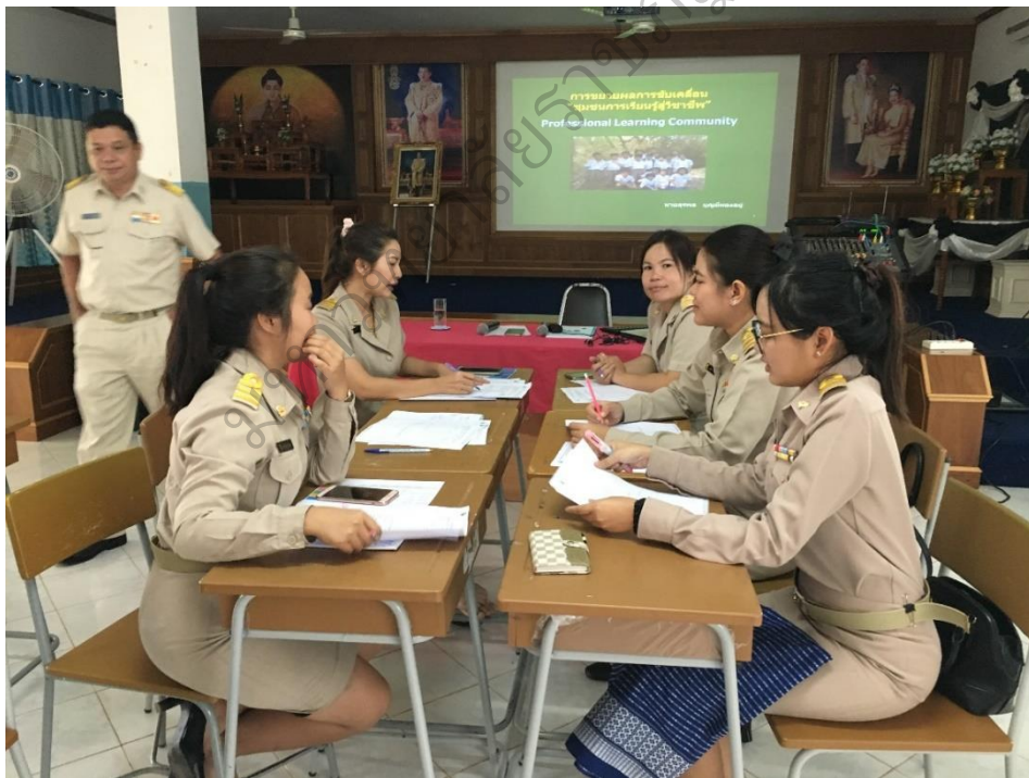
ภาพประกอบ 3 การปรึกษาเพื่อหาแนวทางการแก้ปัญหาการจัดการเรียนรู้