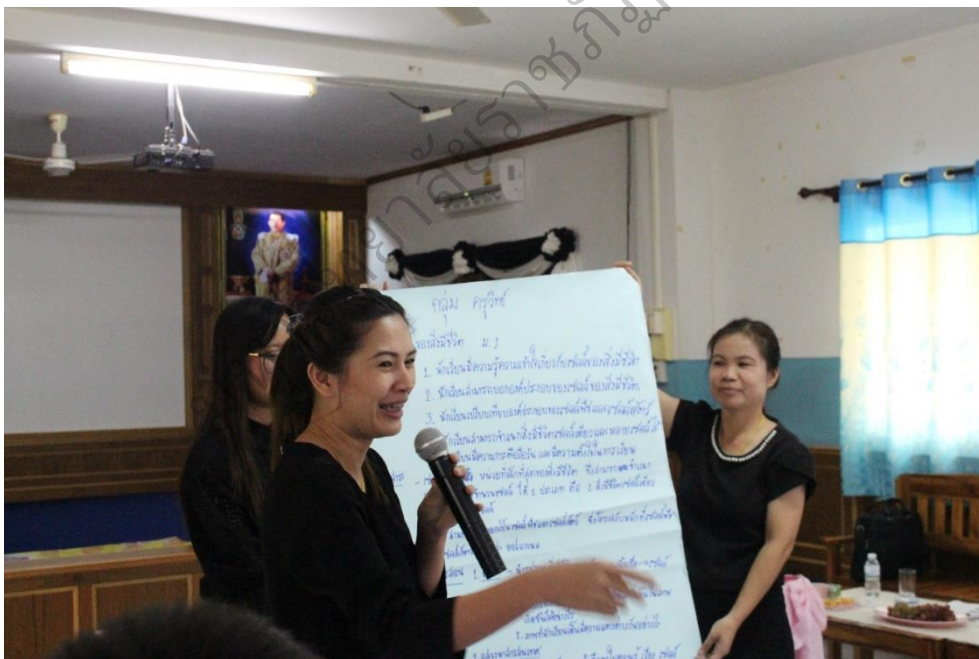
ภาพประกอบ 9 นำเสนอการเขียนแผนการจัดการเรียนรู้ ที่เน้นทักษะการคิดวิเคราะห์