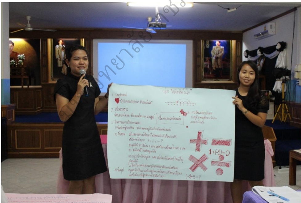
ภาพประกอบ 8 นำเสนอการเขียนแผนการจัดการเรียนรู้ ที่เน้นทักษะการคิดวิเคราะห์