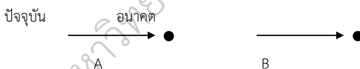
ภาพประกอบ 2 การวิจัยอนาคตใช้วิธีการฉายภาพการพยากรณ์เชิงเส้นตรง

Phase-I Classical Linear Projection (1960-1970) ในช่วง 10 ปีแรก การวิจัยอนาคตใช้วิธีการฉายภาพการพยากรณ์เชิงเส้นตรง วิธีการนี้ใช้ได้ดีกับการพยากรณ์บางอย่างที่เกี่ยวข้องกับองค์ประกอบอื่น ๆ น้อยตัว ดังภาพประกอบ 2