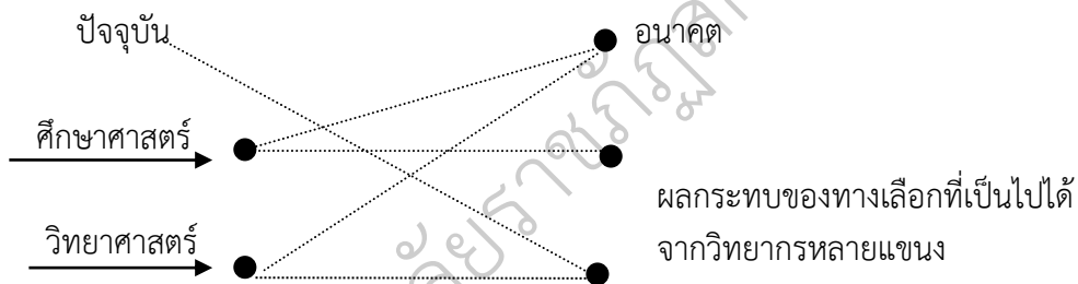
ภาพประกอบ 4 ผลกระทบของทางเลือกที่เป็นไปได้จากวิทยาการหลายแขนง

ในช่วงระยะเวลา 10 ปี การวิจัยอนาคตได้ขยายแนวคิดออกไปศึกษาผลกระทบของความรู้เกี่ยวกับอนาคตจากวิทยาการทุกแขนง การนำผลกระทบจากทุกองค์ ประกอบมา พิจารณาร่วมกัน จะช่วยให้การสร้างภาพอนาคตได้สมบูรณ์มากขึ้น ดังภาพประกอบ 4