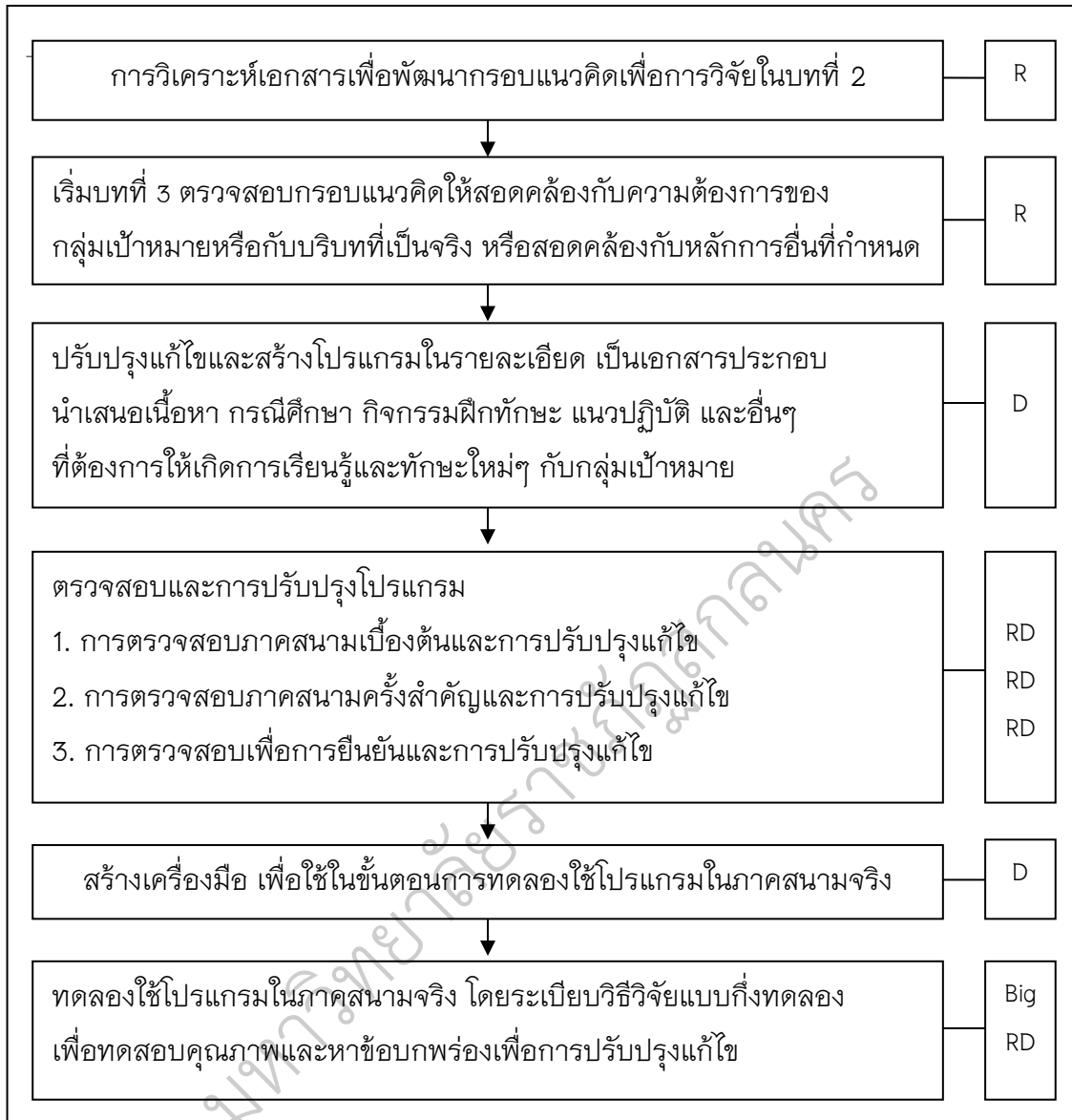
ภาพประกอบ 3 ขั้นตอนการวิจัยและพัฒนา

จากการศึกษาขั้นตอนการวิจัยและพัฒนาของ รัตนะ บัวสนธิ์ (2554, หน้า 13-15) และวิโรจน์ สารรัตนะ (2554, หน้า 151-154) สรุปได้ว่าขั้นตอนการวิจัยและพัฒนาในการวิจัยในครั้งนี้ ประกอบด้วย 3 ระยะ ดังนี้