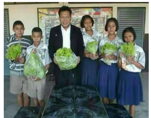
ภาพกิจกรรมการเรียนรู้ แหล่งเรียนรู้ในโรงเรียน