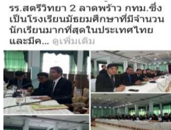
ร.สตรียทยา 2 ลาดพร้าว กทม. ซึ่งเป็นโรงเรียนมัธยมศึกษาที่มีจำนวนนักเรียนมากที่สุดในประเทศไทย และมีค... ดูเพิ่มเติม