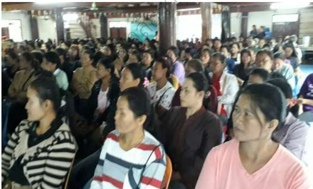
ภาพกิจกรรมเผยแพร่ผลงาน