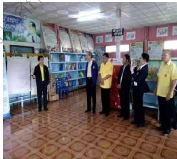
คณะศึกษาดูงานแหล่งเรียนรู้ตามหลักปรัชญาของเศรษฐกิจพอเพียง ที่โรงเรียนบ้านหนองแวง