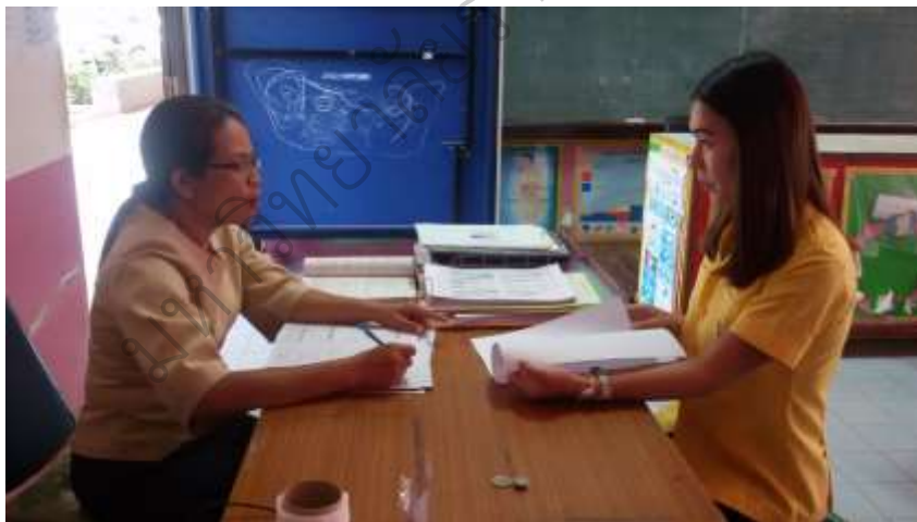
ภาพประกอบ 6 การสัมภาษณ์ครูที่ปรึกษา