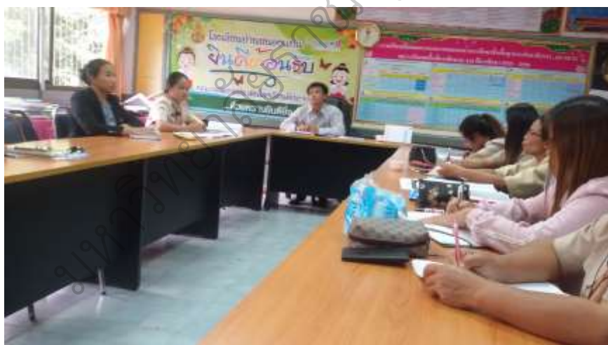
ภาพประกอบ 4 การประชุมครูในวงรอบที่ 2