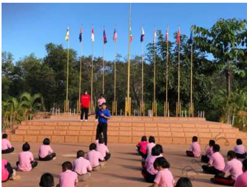
ภาพประกอบ 15 กิจกรรมการอบรมหน้าเสาธง