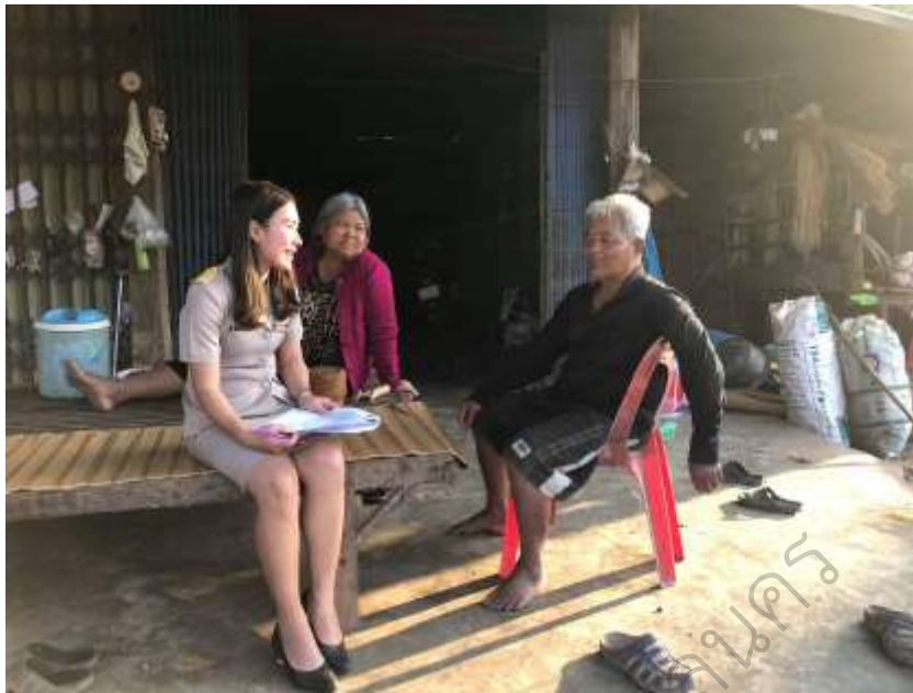
ภาพประกอบ 7 การสัมภาษณ์ประธานคณะกรรมการสถานศึกษา