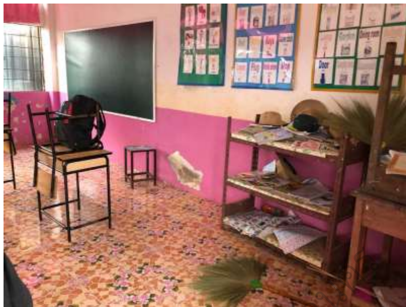
ภาพประกอบ 11 สภาพก่อนการพัฒนาวิทยุนักเรียน