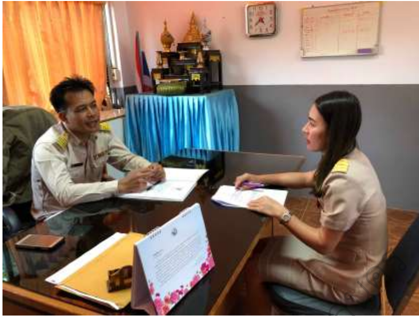
ภาพประกอบ 5 การสัมภาษณ์ผู้บริหารโรงเรียน