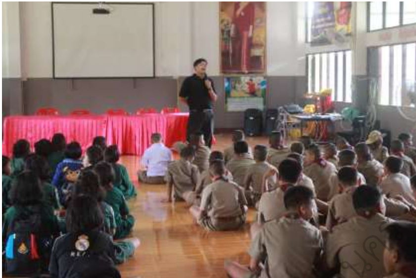
ภาพประกอบ 17 การติดตามกำกับจากครูที่ปรึกษา