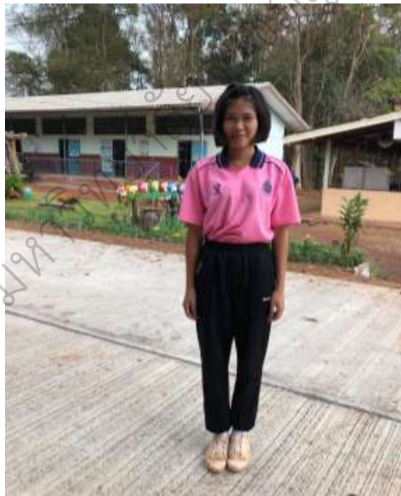
ภาพประกอบ 10 สภาพหลังการพัฒนาวิทยุนักเรียน