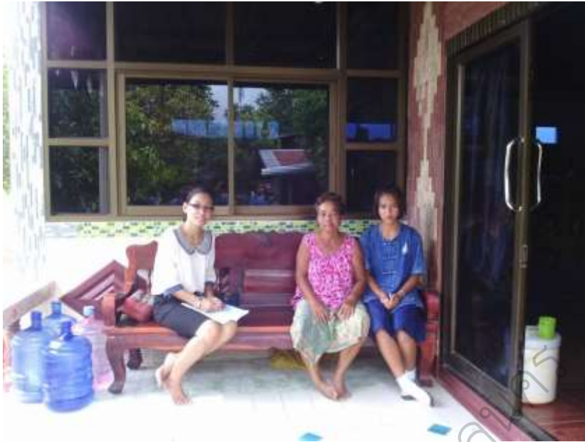
ภาพประกอบ 13 กิจกรรมเยี่ยมบ้านนักเรียน