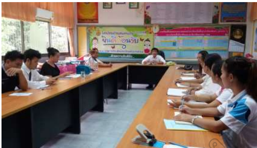
ภาพประกอบ 3 การประชุมครูในวงรอบที่ 1