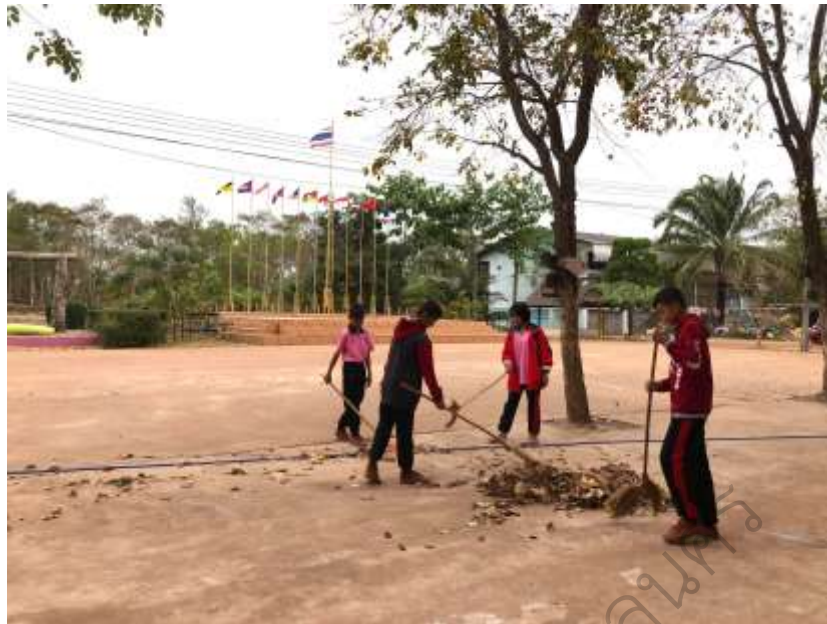
ภาพประกอบ 19 กิจกรรมการพัฒนาวิสัยด้านความรับผิดชอบต่อหน้าที่