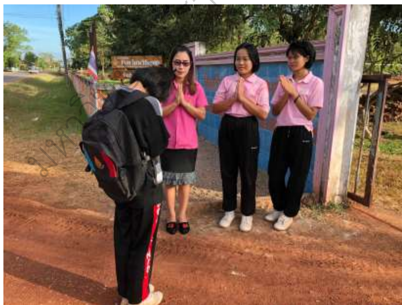
ภาพประกอบ 16 กิจกรรมขึ้นรับ-ส่งนักเรียน