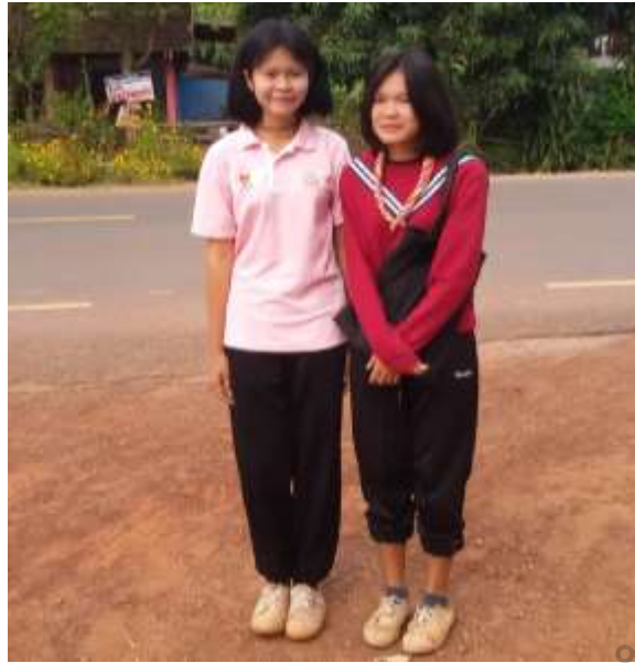
ภาพประกอบ 9 สภาพก่อนการพัฒนาวิทยุนักเรียน