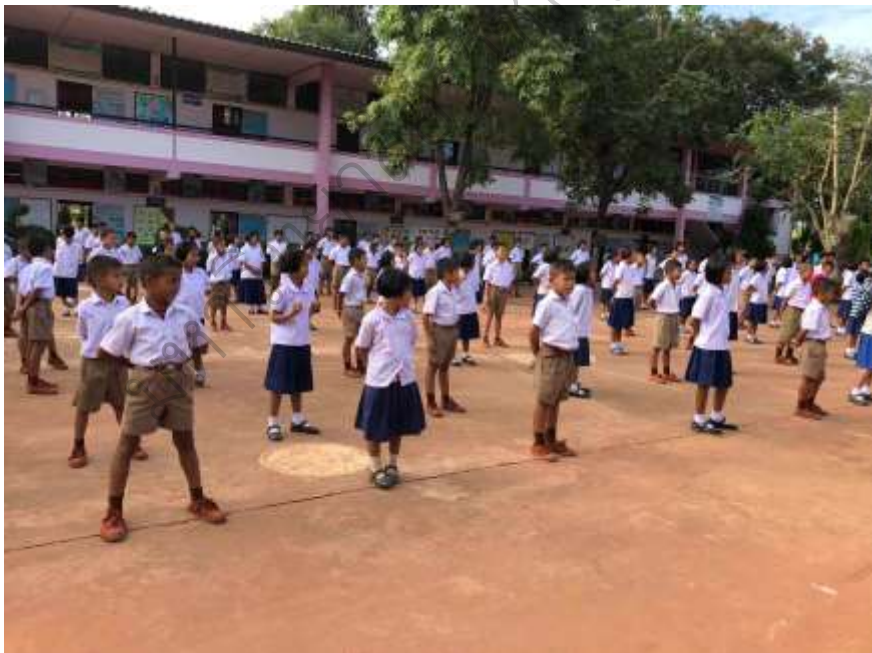
ภาพประกอบ 18 กิจกรรมการพัฒนาวิสัยด้านการตรงต่อเวลา