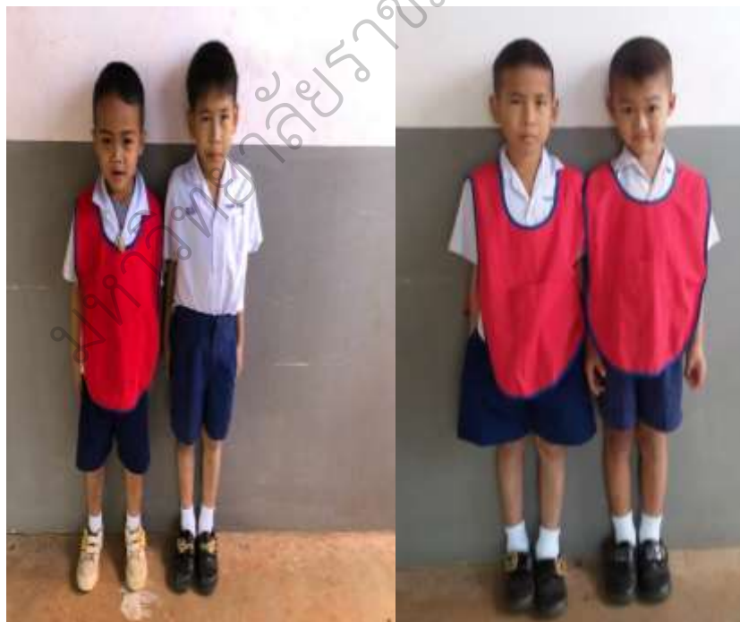
ภาพประกอบ 20 เปรียบเทียบผลการพัฒนาวิสัยด้านการแต่งกาย