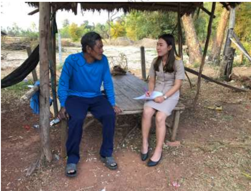
ภาพประกอบ 8 การสัมภาษณ์ผู้ปกครองนักเรียน