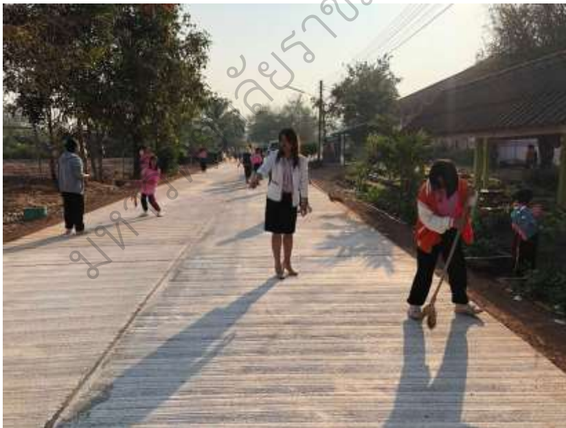
ภาพประกอบ 14 กิจกรรมการรักษาความสะอาดบริเวณโรงเรียน