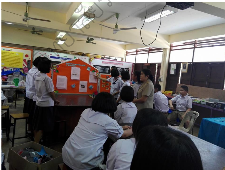
ภาพประกอบ 15 การนำเสนอโครงการ สารที่ใช้ในชีวิตประจำวัน