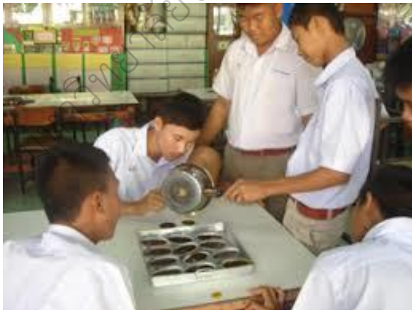
ภาพประกอบ 13 นักเรียนทำสบู่สมุนไพร