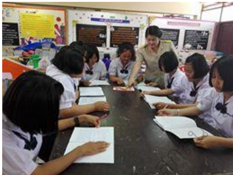
ภาพประกอบ 10 ครูที่ปรึกษาให้คำแนะนำการเลือกหัวข้อโครงการวิทยาศาสตร์