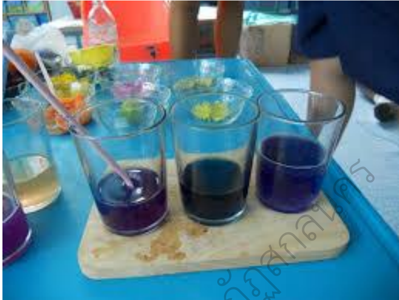
ภาพประกอบ 12 นักเรียนเตรียมอินดิเคเตอร์จากพืช