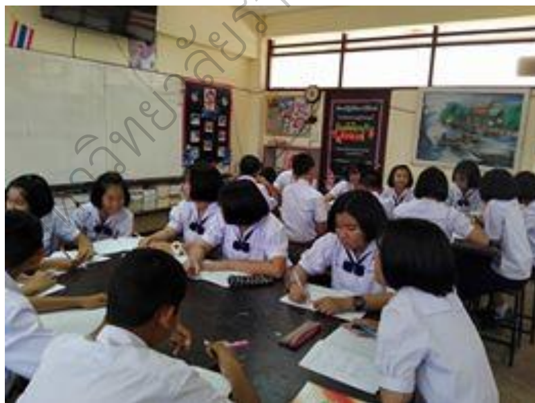
ภาพประกอบ 11 นักเรียนคิดหัวข้อในการทำโครงการวิทยาศาสตร์