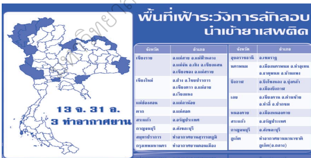
ภาพประกอบ 1 พื้นที่เฝ้าระวังการลักลอบนำเข้ายาเสพติด (ที่มา : ส่วนข้อมูลเฝ้าระวังปัญหาเสพติด สำนักยุทธศาสตร์ ปปส., 2557)

จากสถานการณ์ยาเสพติดภาคตะวันออกเฉียงเหนือ แหล่งผลิตยาบ้าส่วนใหญ่ มาจากประเทศเพื่อนบ้าน โดยเฉพาะอย่างยิ่งประเทศพม่า และนำเข้าประเทศไทยบริเวณ ชายแดนภาคเหนือเพื่อส่งต่อไปยังส่วนต่าง ๆ ของประเทศ ภาคกลางและภาคใต้ในช่วง 10 ปีที่ผ่านมา ปรากฏว่ามีการนำเข้ายาบ้าทางภาคตะวันออกเฉียงเหนืออีกเส้นทางหนึ่ง ทั้งนี้รัฐบาลตั้งข้อสันนิษฐานว่าเป็นยาบ้าที่มาจากแหล่งผลิตเดียวกันกับที่ส่งเข้ามาทาง ชายแดนภาคเหนือ แต่เนื่องจากรัฐบาลไทยเข้มงวดตรวจตราการนำเข้าสินค้าต่าง ๆ มากขึ้น ผู้ผลิตจึงเปลี่ยนเส้นทางเป็นนำเข้ามาจากประเทศ สาธารณรัฐประชาธิปไตยประชาชนลาว และประเทศกัมพูชา (สำนักยุทธศาสตร์ สำนักงานป้องกันปราบปรามยาเสพติด, 2556, หน้า 138) จังหวัดนครพนมก็เป็นอีกจังหวัดหนึ่งที่มีเขตพื้นที่ชายแดนติดกับ สาธารณรัฐ ประชาธิปไตยประชาชนลาวซึ่งเป็นเส้นทางยาบ้าเข้าสู่ประเทศไทย และเป็นพื้นที่เฝ้าระวัง การลักลอบนำเข้ายาเสพติด ดังภาพประกอบ 1