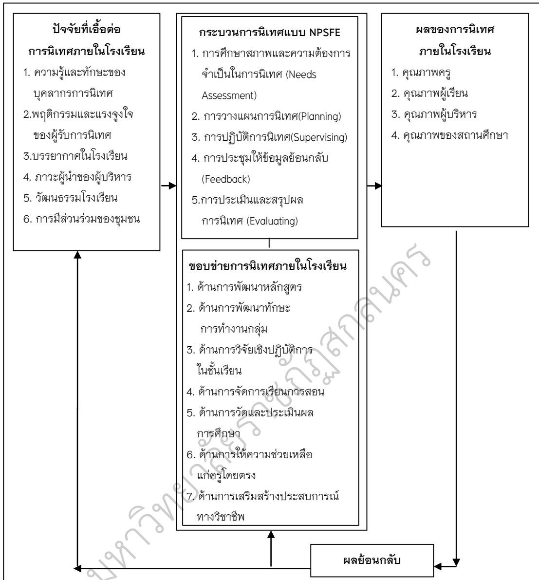
ภาพประกอบ 1 รูปแบบการนิเทศภายในโรงเรียนขนาดเล็ก