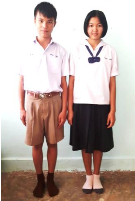
ชุดเครื่องแบบนักเรียน

หมายเหตุ : ภาพประกอบการแต่งกายประจำวัน มีลักษณะ ดังนี้