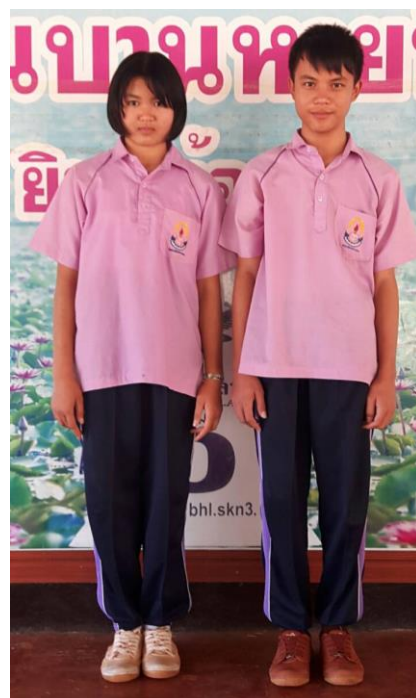
ชุดกิจกรรมพัฒนาผู้เรียน