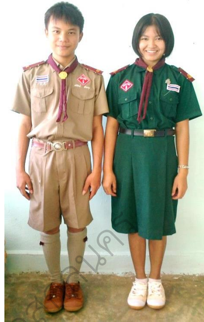
ชุดเครื่องแบบลูกเสือ-เนตรนารี