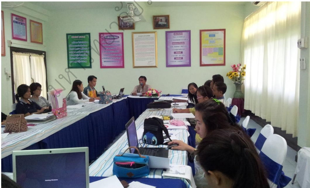
ภาพประกอบ 4 การประชุมแบบมีส่วนร่วม