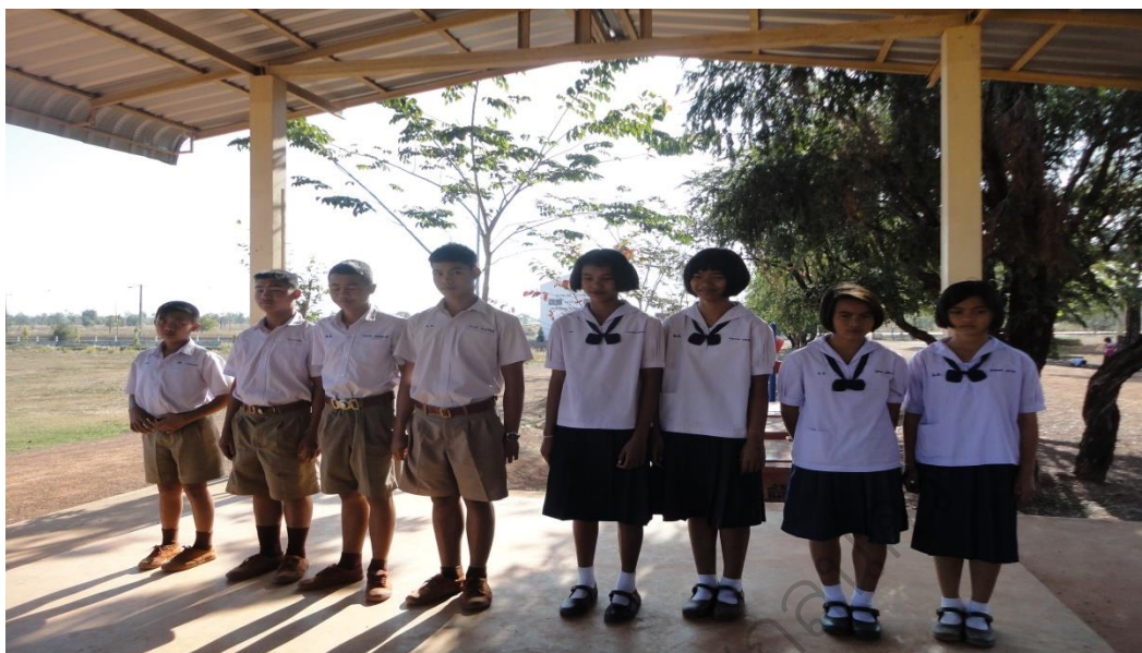
ภาพประกอบ 7 กิจกรรมประกวดการแต่งกายดีมีวินัย