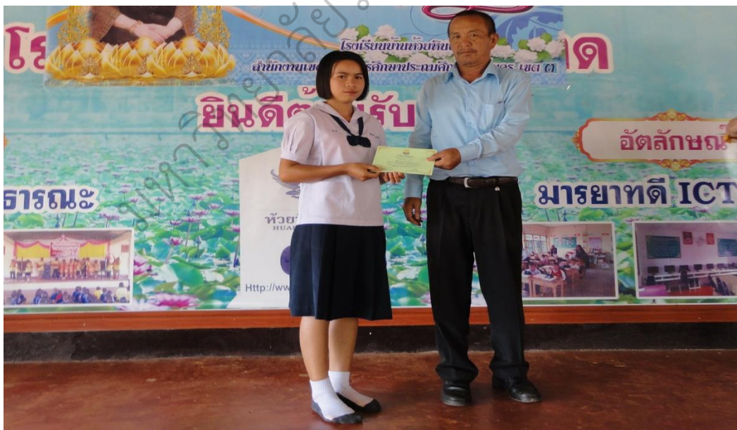
ภาพประกอบ 8 มอบเกียรติบัตรประกวดการแต่งกายดีมีวินัย