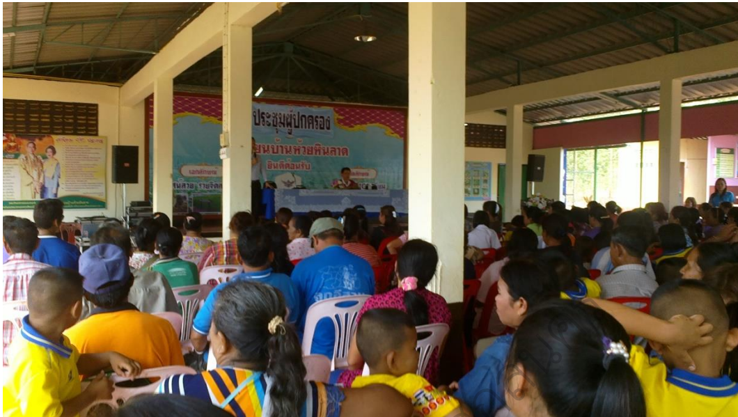
ภาพประกอบ 3 ประชุมครู ผู้ปกครอง คณะกรรมการสถานศึกษาขั้นพื้นฐาน