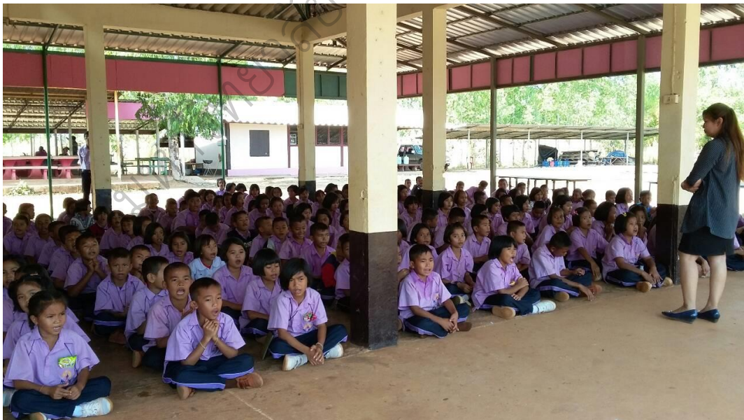
ภาพประกอบ 6 กิจกรรมอบรมความมีวินัยนักเรียนด้านการแต่งกาย