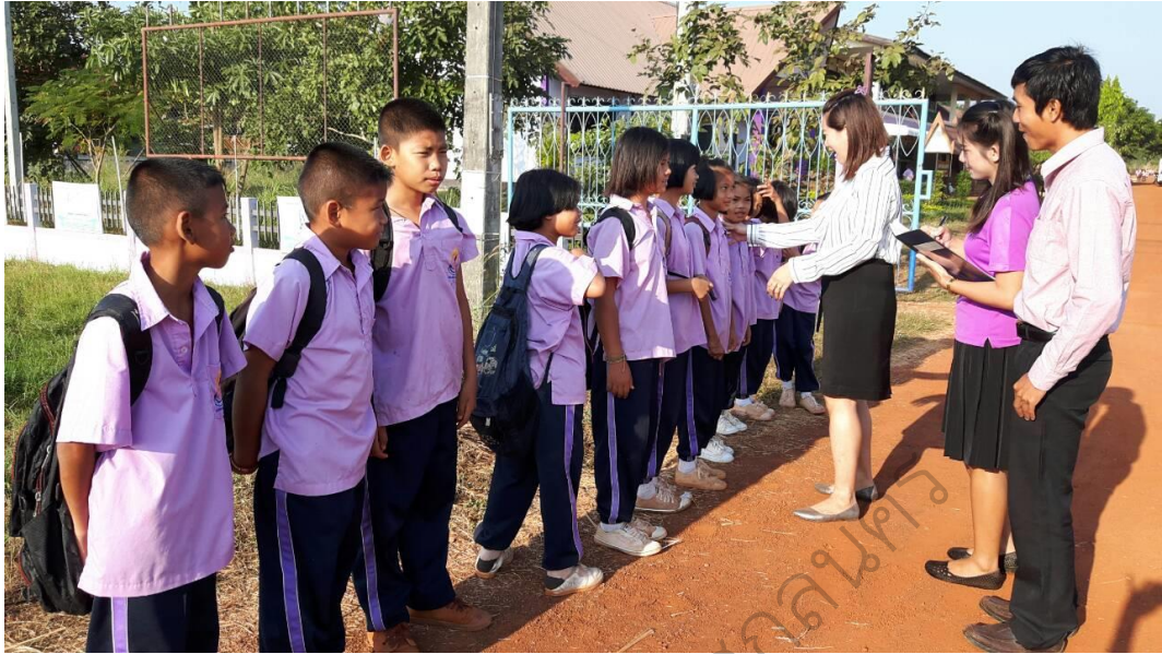
ภาพประกอบ 5 กิจกรรมรับนักเรียนหน้าประตู