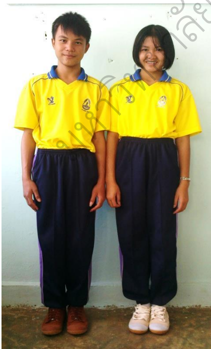
ชุดพลศึกษา